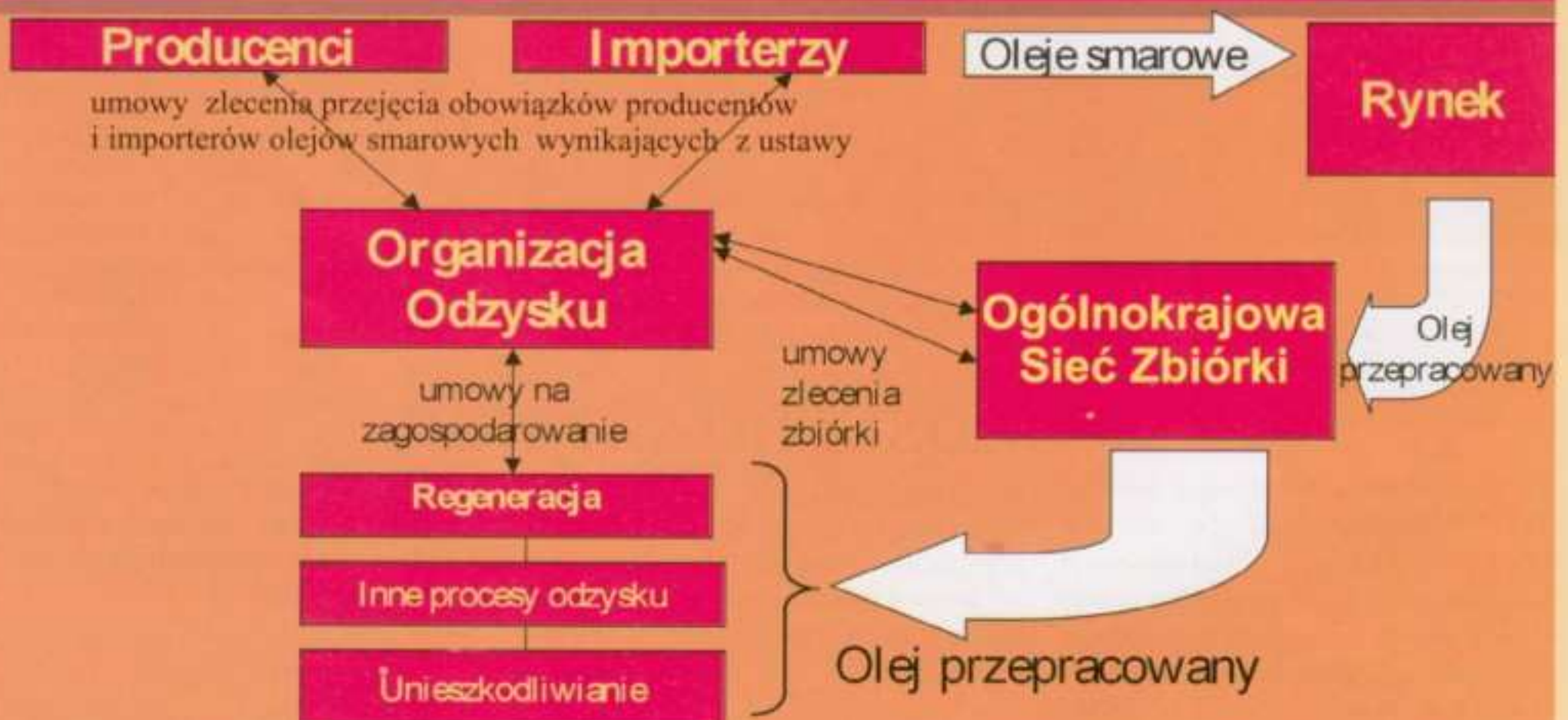
SCHEMAT NR 2