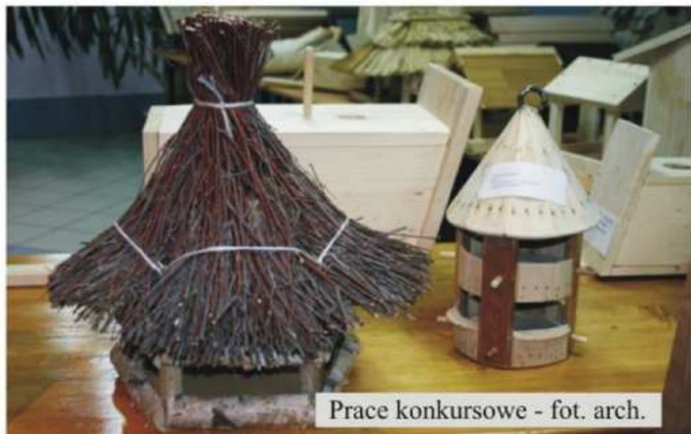
Prace konkursowe - fot. arch.

Na konkurs wpłynęło 96 prac z 7 szkół gminy Jedlicze. Nagrodę za najbardziej liczny udział w konkursie oraz największą liczbę