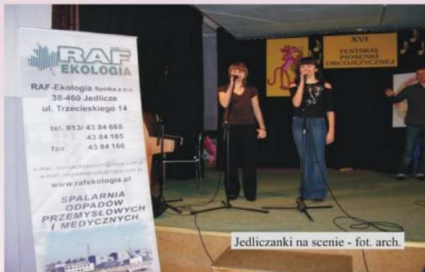
Jedliczanki na scenie