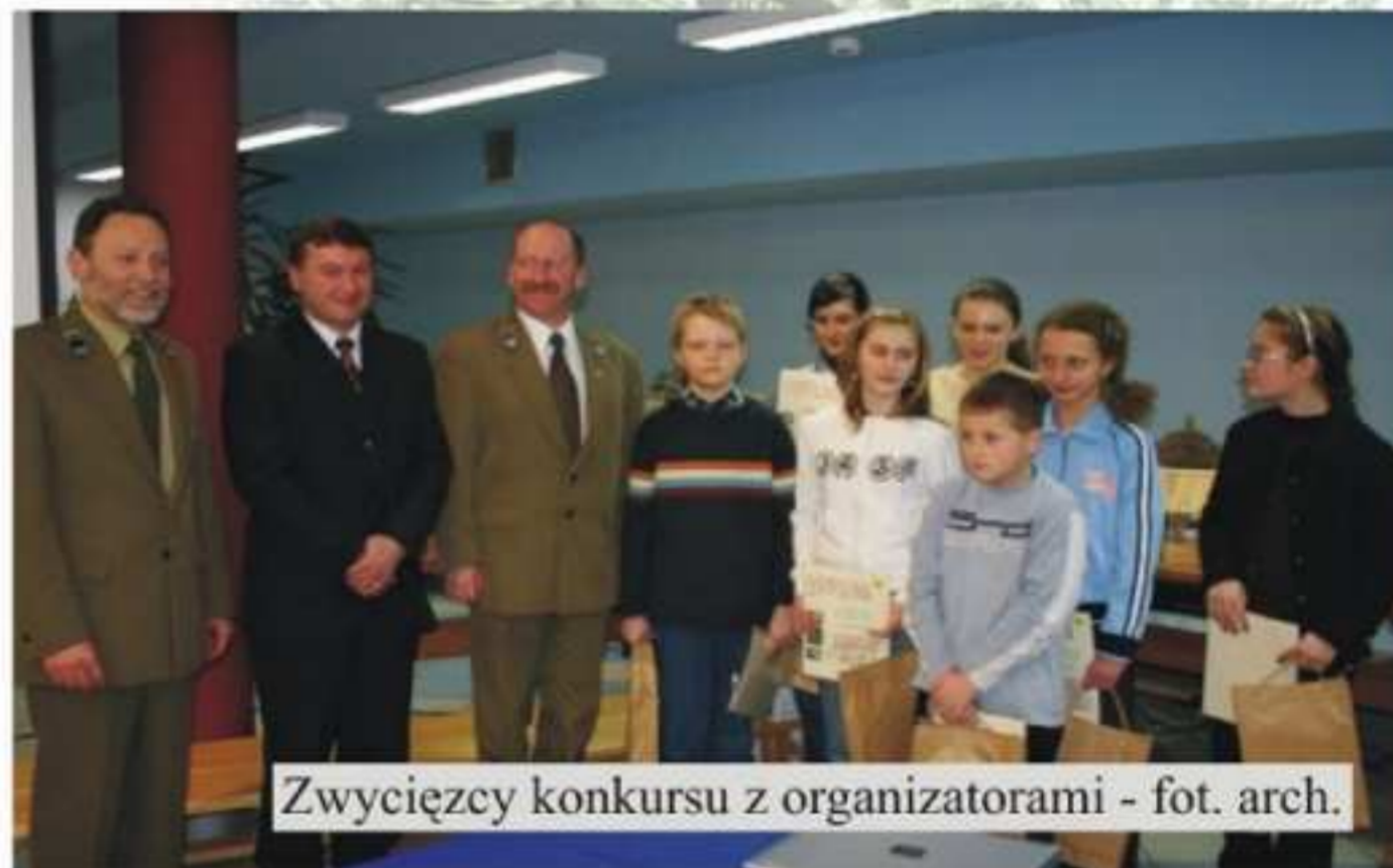
Zwycięzcy konkursu z organizatorami

Ignacy Bielecki wygłosił prelekcję, której hasłem przewodnim