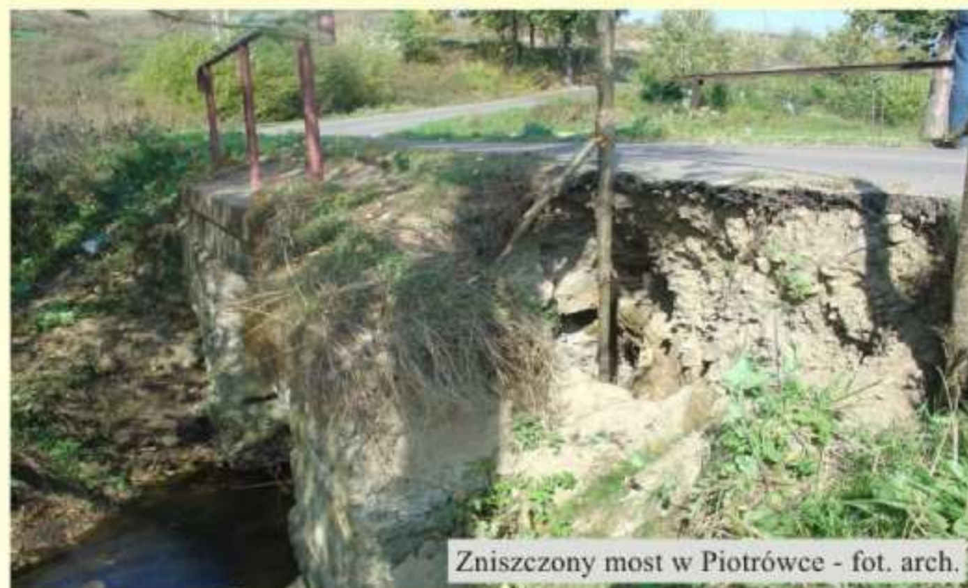
Zniszczony most w Piotrówce

Powodzie, które w ostatnich latach nie oszczędzały naszej gminy spowodowały podmycie przyczółków mostu zlokalizowanego na drodze gminnej z Piotrówki do Podniebyla.