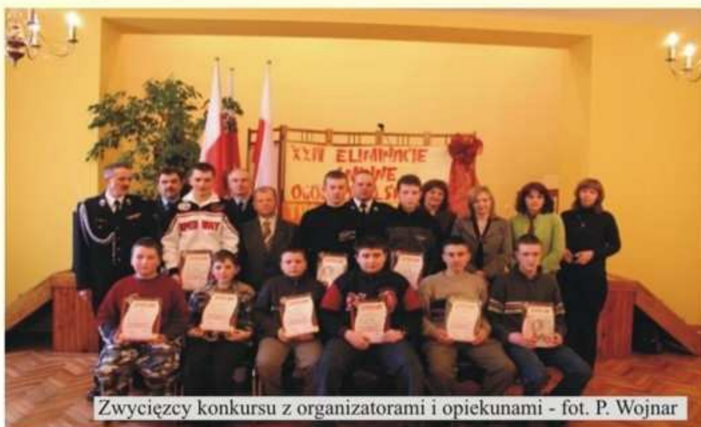
Zwycięzcy konkursu z organizatorami i opiekunami

Za szczeblu Gminnym przeprowadzono eliminacje w trzech grupach wiekowych, w których udział wzięły trzyosobowe zwycięskie ekipy z eliminacji szkolnych.