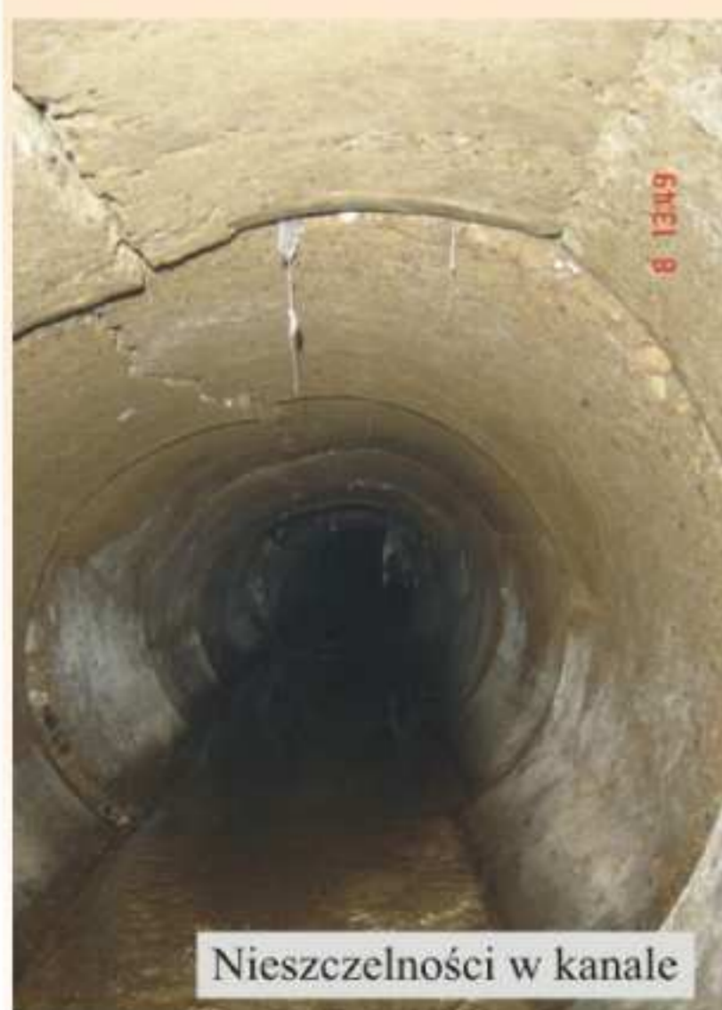
Nieszczelności w kanale

Ekspertyza zawiera obszerną dokumentację fotograficzną, która została przedstawiona radnym podczas Sesji Rady Miejskiej w dniu 28 marca br. Wyjaśniono, że ekspertyza wykazała niedomagania obu kolektorów oraz wskazała odcinki wymagające gruntowanego remontu. Jako przyczyny