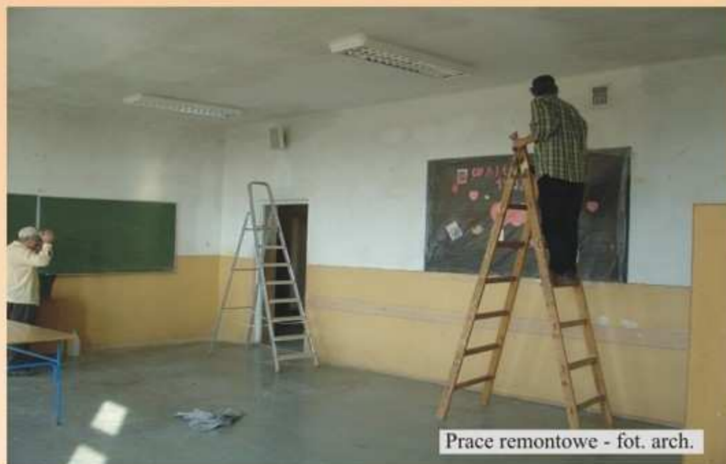
Prace remontowe

9 lutego br. wraz z początkiem ferii rozpoczęły się prace remontowe w Zespole Szkół Publicznych w Jedliczu. Przez cały czas ich trwania szereg osób pracowało by uczniowie mogli rozpocząć drugie półrocze w wyremontowanych pomieszczeniach swojej szkoły.