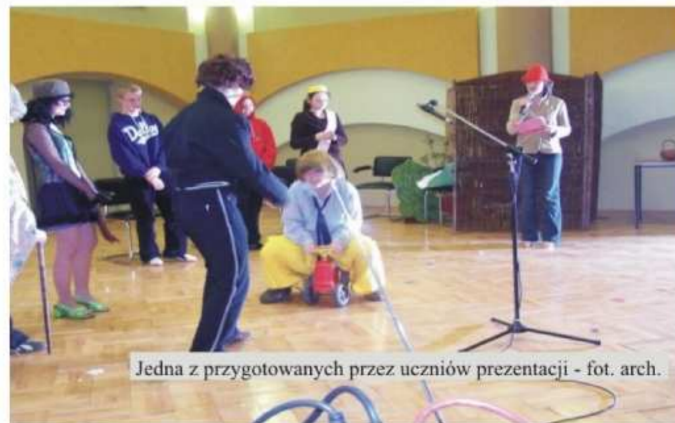
Jedna z przygotowanych przez uczniów prezentacji

21 marca 2007 r. już po raz ósmy młodzież gimnazjalna wzięła udział w realizacji projektu „Szkolny Dzień Teatru”, podczas którego uczniowie przedstawiają przygotowane przez siebie spektakle teatralne. Nad ich realizacją czuwali wychowawcy. Uczniowie, zamiast iść na wagary, z dużym zainteresowaniem oglądali prezentacje swoich kolegów.