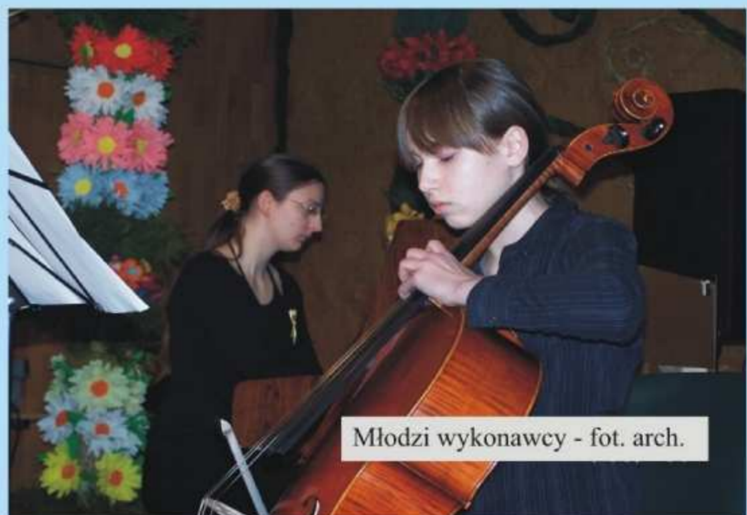
Młodzi wykonawcy

Na koncert zaproszona została młodzież z gimnazjów gminy Jedlicze. Z zaproszenia skorzystali uczniowie z Zespołu Szkół Publicznych w Jedliczu i Zespołu Szkół w Potoku oraz Zespołu Szkół im. Armii Krajowej w Jedliczu.