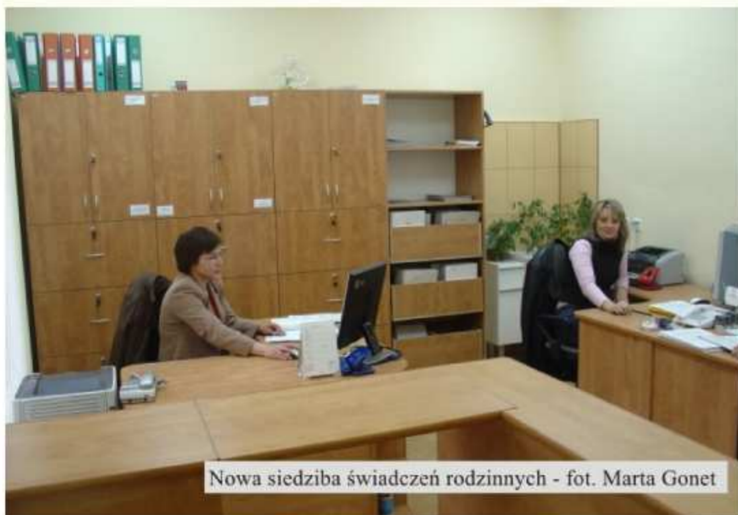
Nowa siedziba świadczeń rodzinnych

Od 2 marca br. sprawy związane ze świadczeniami rodzinnymi można załatwiać w pomieszczeniu administracyjno – biurowym przy sali narad