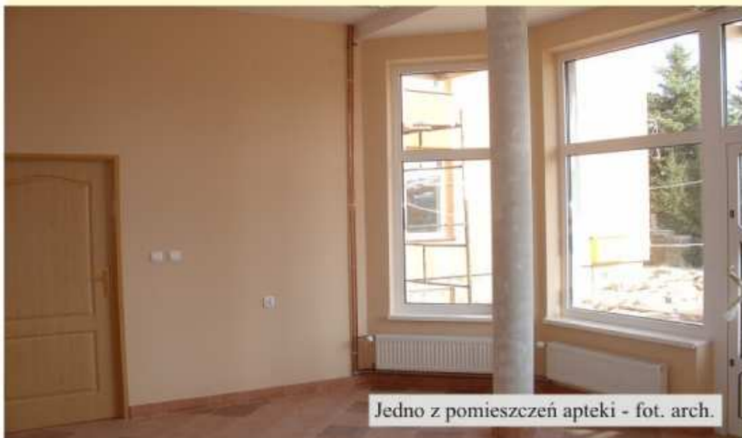
Jedno z pomieszczeń apteki

W lokalu apteki zlokalizowanym w rozbudowywanej Przychodni Rejonowej w Jedliczu trwają ostatnie prace wykończeniowe. Zgodnie z wymogami