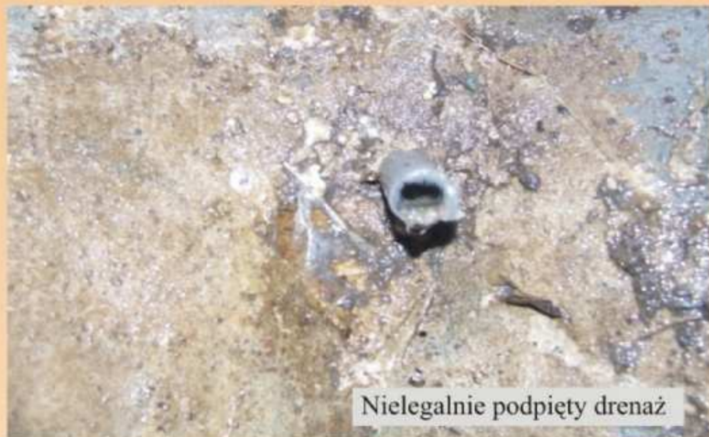
Nielegalnie podpięty drenaż

Od kilku lat co pewien czas wraca problem zalewania posesji przy ulicy Wałowej i Łukasiewicza w Jedliczu. Mieszkańcy tych ulic zwracali się z tym problemem do wielu instytucji oskarżając obecnego burmistrza, pracowników JPGKiM, strażaków oraz urzędników o zaniedbania. Pisano również mnóstwo zażaleń i donosów, składano wnioski do Prokuratury, nadzoru budowlanego, na Policję. Tymczasem okazało się, że przez te tereny przebiega sieć, która podczas obfitych opadów deszczu nie mieści wody i część nieczystości