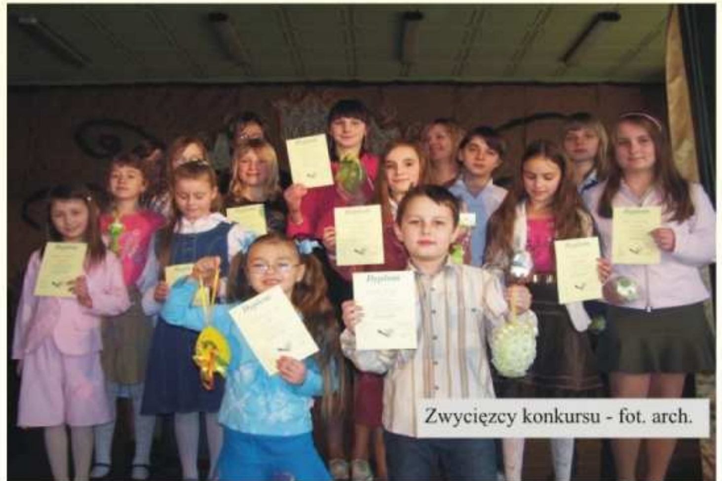
Zwycięzcy konkursu

Wyróżnienie Martyna Woltmann - Zespół Szkół w Jedliczu