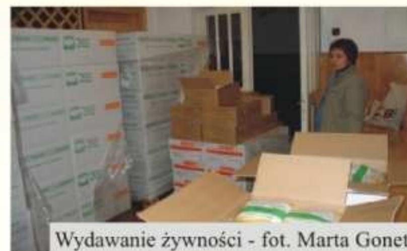
Wydawanie żywności

15 marca 2007r. w Domu Ludowym w Męcince Gminny Ośrodek Pomocy Społecznej wydawał artykuły żywnościowe w ramach Programu „Dostarczanie żywności dla najuboższej ludności Unii Europejskiej”. Żywność wydawana jest od 3 lat raz w miesiącu. Rozdysponowano: 800 kg cukru, 800 kg kaszy jęczmiennej, 800 kg mąki pszennej, 800 kg płatków kukurydzianych, 280 kg sera żółtego, 160 kg serów topionych, 800 kg makaronu. Z pomocy żywnościowej skorzystały 194 rodziny, które aktualnie były objęte pomocą GOPS. Na terenie województwa podkarpackiego głównym koordynatorem programu jest Bank Żywności w Rzeszowie. Partnerem w pozyskiwaniu żywności dla mieszkańców gminy Jedlicze jest Ochotnicza Straż Pożarna w Długiem. Jej dystrybucją zajmuje się Gminny Ośrodek Pomocy Społecznej w Jedliczu.