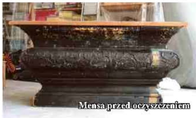
Mensa przed oczyszczeniem

Trwają prace konserwatorskie Kaplicy Cmentarnej pw. Jezusa Ularzowanego w Jedliczu. Konserwatorzy oczyścili mensę ołtarzową z XVIII w. Ściągając z niej warstwę czarnej farby odkryli ciemnozielony kolor, przeplatany posrebrzonymi elementami ozdobnymi. W takiej sytuacji podjęta została decyzja o przywróceniu mensie ołtarzowej jej pierwotnego wyglądu.