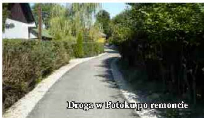
Droga w Potoku po remoncie