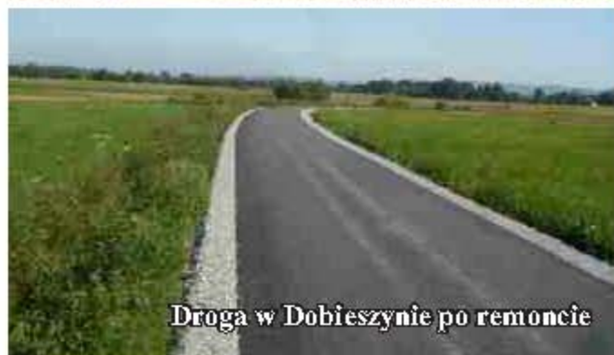
Droga w Dobieszynie po remoncie