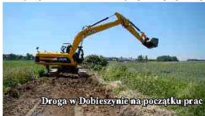
Droga w Dobieszynie na początku prac

Kolejne drogi oddane do użytku, tym razem w miejscowości Potok i Dobieszynie. W ramach prac na obu odcinkach wykonano nową podbudowę i położono nawierzchnię mineralno bitumiczną. Koszt remontu w Potoku wyniósł ponad 77 tys. zł, zaś w Dobieszynie ponad 240 tys. zł. Łącznie wyremontowano 950 m dróg. Całość kosztów pokryta zostanie z dotacji otrzymanej z Ministerstwa Spraw Wewnętrznych na usuwanie skutków wódsek żywiołowych powstałych w wyniku powodzi w 2010 r.