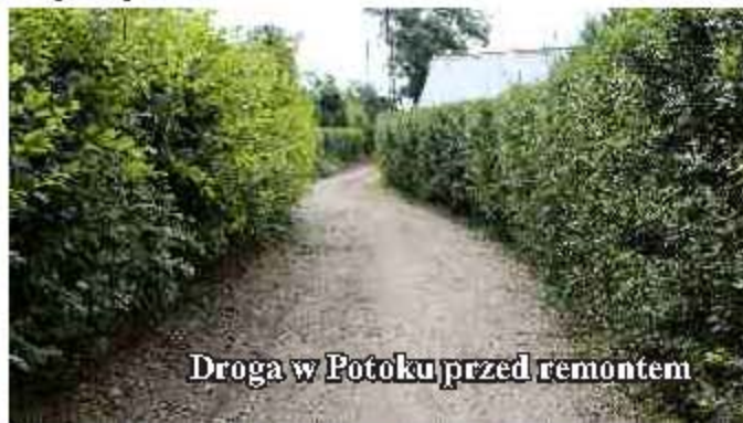
Droga w Potoku przed remontem