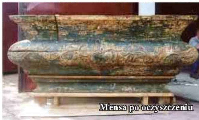
Mensa po oczyszczeniu