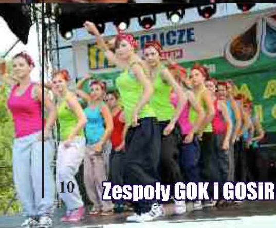
Zespoły GOK i GOSiR