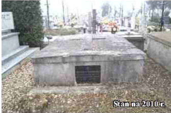
Stan na 2010 r.

Kolejna kwesta odbyła się w listopadzie ubiegłego roku oraz podczas koncertu „Paryżu Kocham Cię”. Brakujące środki w kwocie 3,5 tys. zł. przekazała Rada Rodziców Zespołu Szkół Publicznych w Jedliczu.