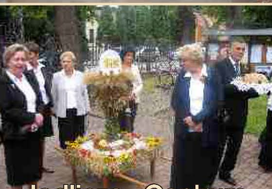
Jedlicze - Centrum