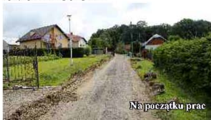
Na początku prac

Zakończono przebudowę ciągu ulic realizowaną w ramach Narodowego Programu Przebudowy Dróg Lokalnych, etap II, Bezpieczeństwo Dostępność Rozwój. Był to drugi etap remontu ciągu komunikacyjnego (pierwszy o długości 5 km, obejmował remont od drogi krajowej przez Bratkówkę, Moderówkę, Męcinkę do ul. Brzozowej w Jedliczu realizowany był w 2009 r.) Tym razem zmodernizowano ul. Betleja, Grabiny i Podlas w Jedliczu. Całkowita wartość projektu to 786 294,78 zł, z czego 235 888,00 zł to środki finansowe pozyskane z Budżetu Państwa. Na przyszły rok przygotowano już dokumentację na remont kolejnego odcinka w ramach wyżej wymienionego programu.