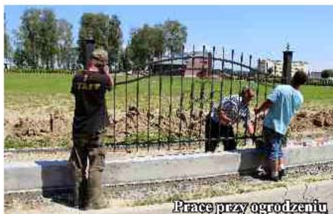
Prace przy ogrodzeniu

Kontynuowane są prace związane z budową ogrodzenia cmentarza komunalnego w Jedliczu, aktualnie prowadzone są prace przy montażu przęsła.