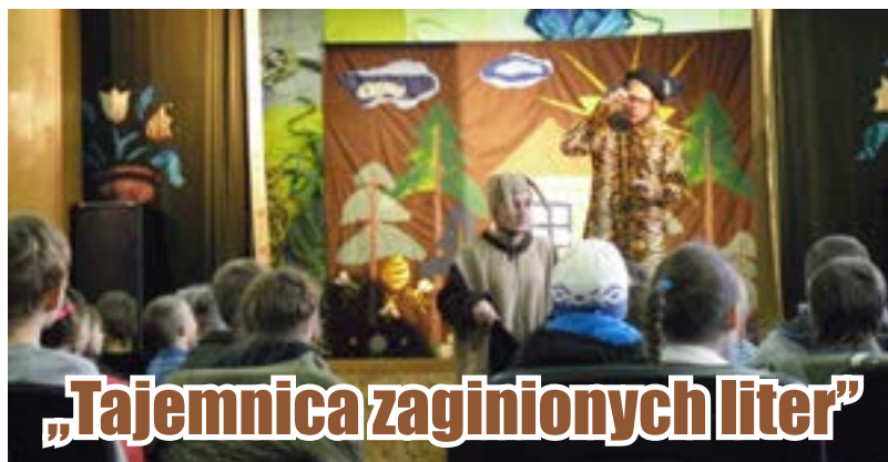
„Tajemnica zaginionych liter”