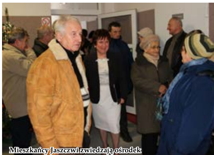
Mieszkańcy Jaszczwi zwiedzają ośrodek