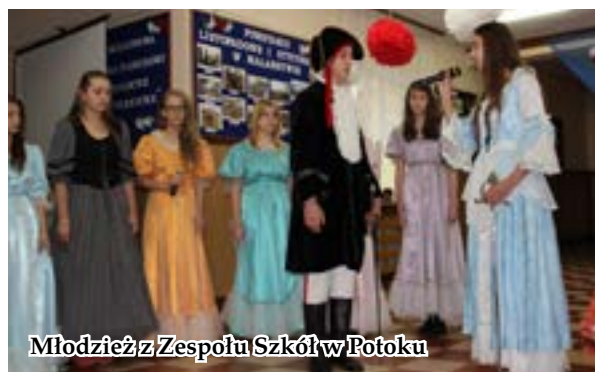
Młodzież z Zespołu Szkół w Potoku