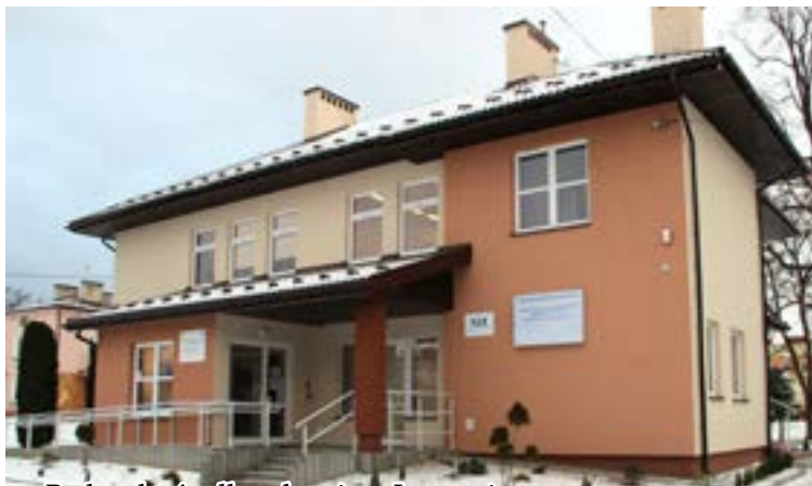
Budynek ośrodka zdrowia w Jaszczwi