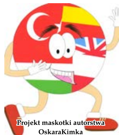
Projekt maskotki autorstwa OskaraKimka

autorstwa Oskara Kimaka. Z kolei logo zaproponowane przez szkołę CEIP Los Olivos z Teneryfy będzie reprezentować nasz wspólny projekt. Kolejne konferencje poświęcone były tradycyjnym grom i zabawom dla dzieci. Każda szkoła przedstawiła dwie gry lub zabawy popularne w swoim kraju w wersji filmowej. Proponowane polskie gry to tradycyjne „Dwa Ognie” i „Palant”. Wprowadzoną teorię zastosowano w praktyce podczas kolejnego dnia w szkole. Na boiskach szkolnych i w klasach uczono tamtejszych uczniów oraz nauczycieli nowych gier.