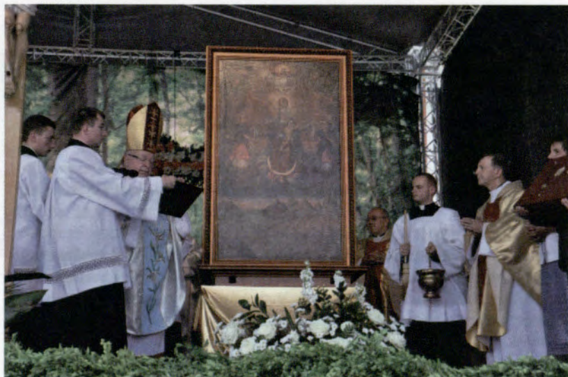
Koronacja Obrazu Matki Bożej Królowej Świata w Sokolowie Młp.