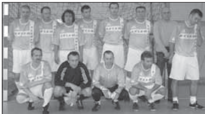
Występująca w Sędziszowie drużyna lubelskiego Motoru mimo iż w składzie miała reprezentantów Polski zdobyła tylko 3 punkty i zajęła zaledwie trzecie miejsce w swej grupie.

* W ostatni czwartek karnawału zakończyły się ligowe zmagania w rozgrywkach Powiatowej Amatorskiej Ligi Piłkarskiej sezonu 2006/07. Mistrzem trzeci raz z rzędu, zdobywając na własność „Złoty Puchar PALP” została drużyna Moto – Hurtu Białej Gwiazdy Ropczyce. Drugie miejsce wywalczył zespół PUK Team Ropczyce, a trzecia lokata dla ADUS Team Sędziszów Młp. Kolejne miejsca zajęły zespoły: Płomienia Zagorzycze, Romy Kamionka, Sneyers Ropczyce, Celtów DSI Ropczyce i zamykający pierwszoligową tabelę team TAU Sędziszów Młp. Najlepsza w II lidze dywizji A to drużyna Atomu Ropczyce, przed Mazakiem Sędziszów Młp., Artpressem z Sędziszowa, LZS GK Ropczyce, Team Of Star Sędziszów Młp. i LO z-BEER-y Sędziszów Młp. Dywizję B II ligi wygrało Dynamo Sędziszów Młp. Dalej w kolejności Extrans Sędziszów Młp., Anko GS Sędziszów Młp., Plon Kle-