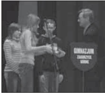
Uczniowie Gimnazjum z Zagorzyc Górnych zwyciężyli w konkursie wiedzy o Sędziszowie Młp.

Za rok kolejny jubileusz. 525 rocznica. Znacząca data. Przed ćwierć wiekiem przynię wówczas działające Towarzystwo Miłośników Ziemi Sędziszowskiej, przy zaangażowaniu władz miejskich, wydało jedyne naukowe dzieło szeroko traktujące o historii Sędziszowa i sąsiednich miejscowości. „Szkielet dziejów Sędziszowa Małopolskiego i okolicy” to nie pełny obraz przeszłości naszego miasta, a jedynie wybrane jego elementy. Wynikało to z przyjętej przez autorów koncepcji pracy, a także określonych realiów historycznych, w jakich dzieło powstawało – o pewnych wydarzeniach nie należało pisać wcale,