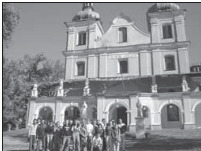
Uczestnicy projektu przed Sanktuarium Matki Bożej Słuchającej w Kalwarii Pałacowskiej.