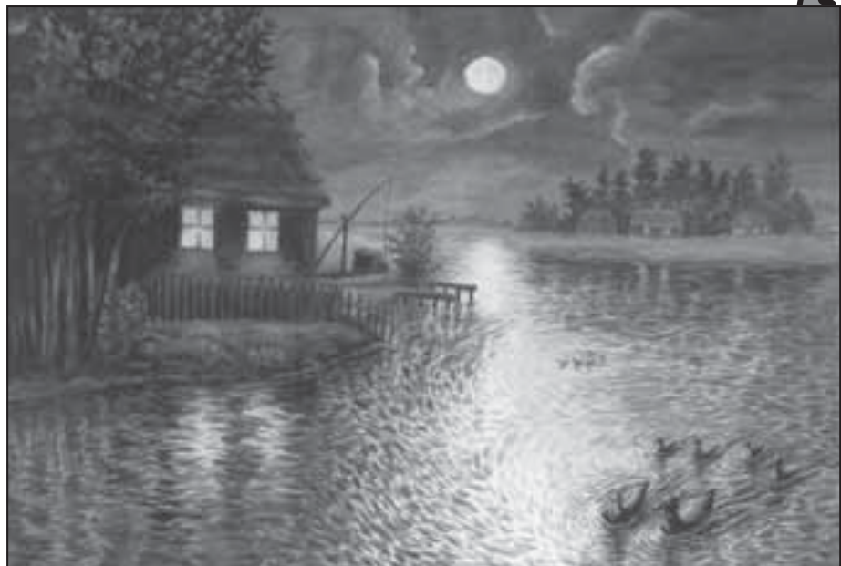
„Noc”, akwarela. Mal. M. Wilczok

śmiały się donośnie, nawet ich pożywienie było skromne, „postne”. Na wsi był to czas rozpoczynania pracy na roli. Jak zwykle obserwowano zmiany w pogodzie, wróżąc przyszłe plony. Już „śnieżne” zapusty zapowiadały obfitość siana. Niepokój budziły natomiast opady deszczu na początku Wielkiego Postu. Oznaczały one „mokrą” wiosnę, opóźniająca wyjście w pole.