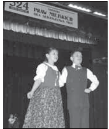
Na scenie „Małe Rochy”.

Nie jestem zwolennikiem działań okazjonalnych, jednorazowych zrywów, wynikających z potrzeby chwili. Sądzę, że należy pod-