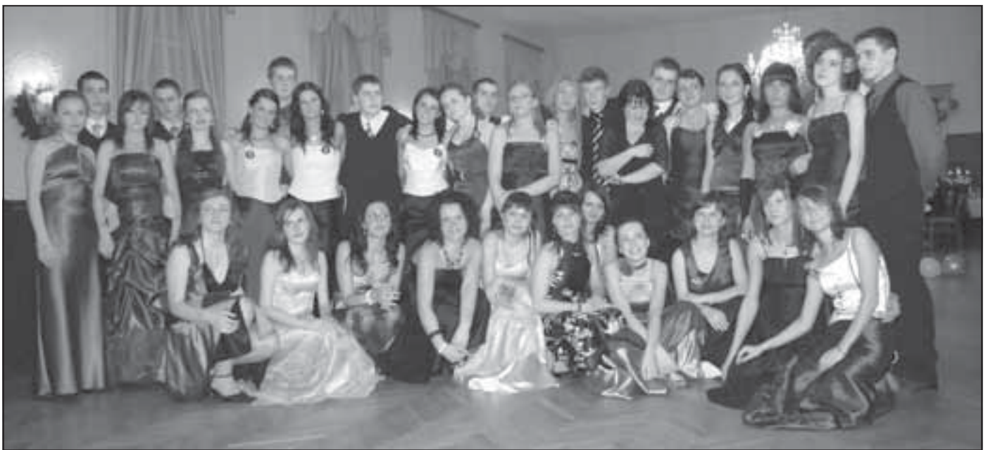
Uczniowie klasy IIIc w sali balowej

jak przystało na czas karnawału, wszyscy wyglądali elegancko, dostojnie i czarująco. Mimo różnych wieści napływających z kraju, co do zachowań uczniów i ich osób towarzyszących na studniówkach, sędziszowscy maturzyści nie zawiedli pokładanych