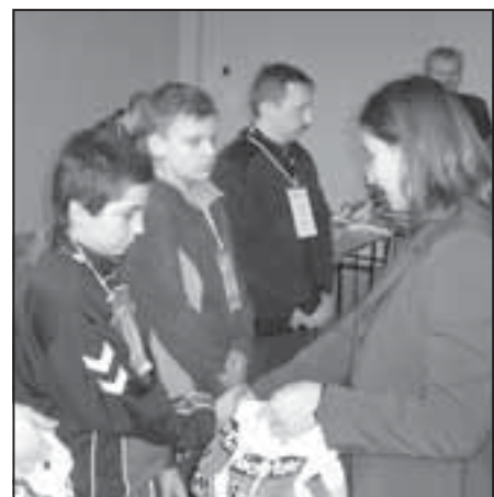
Nagrody za wytrwałość.

W tym roku przygotowaliśmy przyjeżdżającym do nas zawodnikom małą niespodziankę. Polegała ona na wprowadzeniu dodatkowego – piątego – etapu, który wcześniej nie był ujęty w regulaminie. Było to możliwe dzięki terenowi, w którym tym razem zawody się odbywały, a który umożliwił wprowadzenie tak zwanych „startów lotnych” bez jednoczesnego podwyższania ryzyka zagubienia się drużyn. Nowy, piąty etap to również dodatkowe punkty do InO czyli Odnaki Imprez na Orientację.