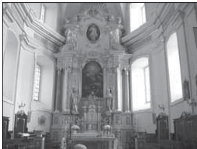
Ołtarz w Sanktuarium Maryjnym w Czudcu.

Młodzież i nauczyciele z Zespołu Szkół Agro – Technicznych zakończyli pracę nad projektem Sanktuaria Maryjne Miejscem Pielgrzymek Narodu . Jest to kontynuacja realizowanego w szkole od września 2006 r. projektu pt. „Święci w figurach i kapliczkach przydrożnych powiatu ropczycko-sędziszowskiego”.