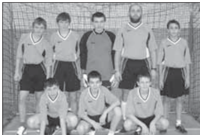
Zespół Team Of Star Sędziszów Młp. był najmłodszą drużyną uczestniczącą w rozgrywkach sezonu 2006/07.