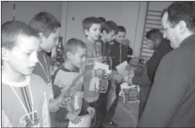
Wręczenie nagród w kategorii TD