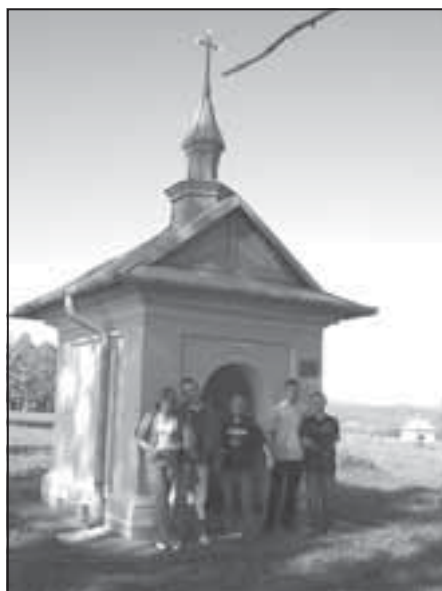
Na kalwaryjskich ścieżkach.