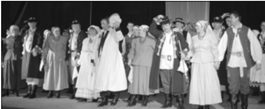
Uczestnicy widowiska na scenie.