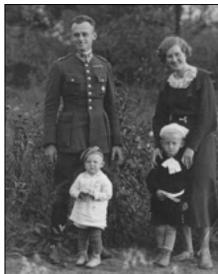
Witold Pilecki z rodziną.