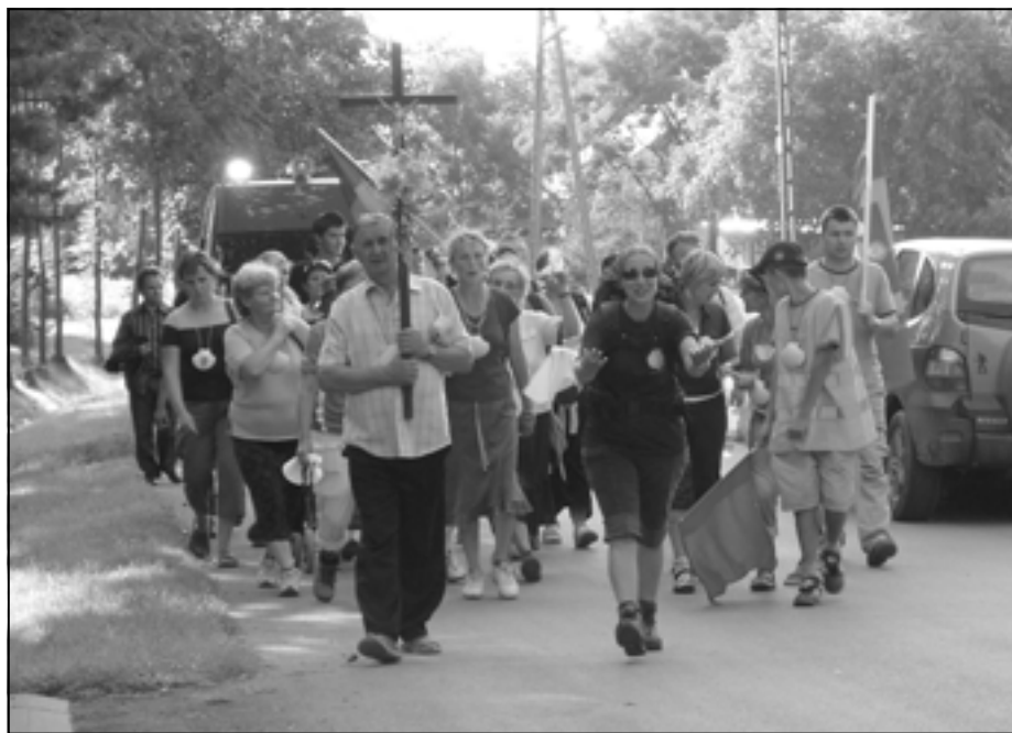
Grupa pielgrzymów św. Jakuba na szlaku (wejście do Więclawic Starych 26.07.2008 r.)