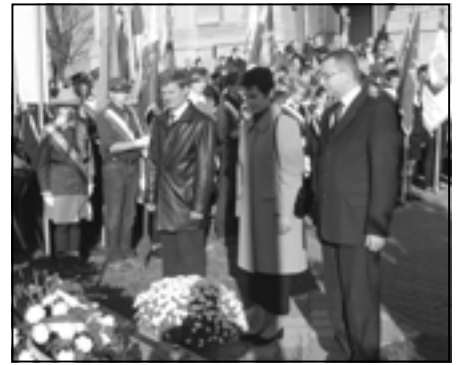
Przedstawiciele samorządu gminnego podczas uroczystości.

Wykonawcy, poprzez poezję i pieśni poprowadzili nas przez lata niewoli i walki o zachowanie polskości, aż po radosny mo-