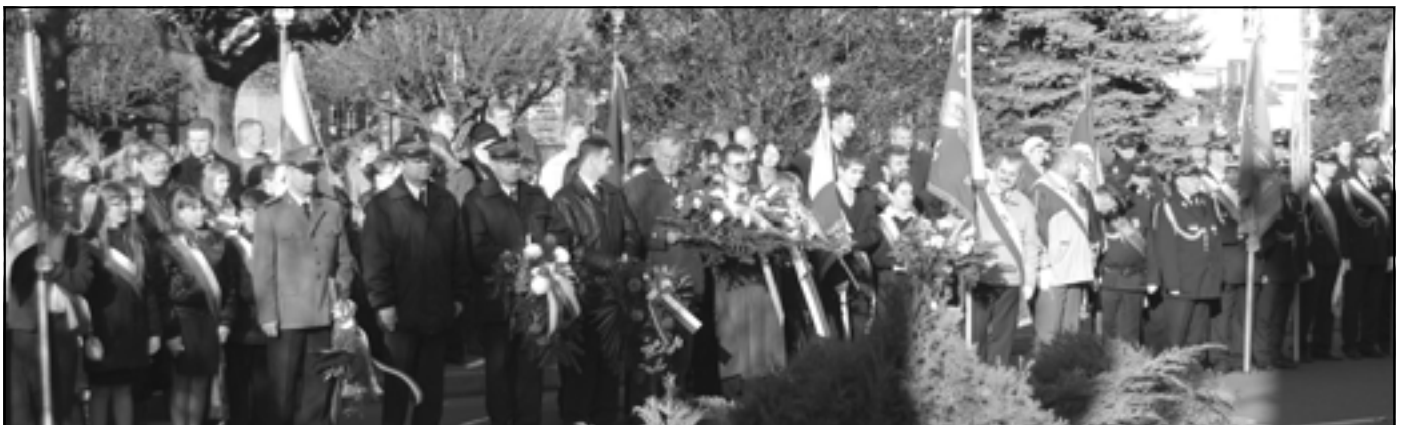
Delegacje i poczty sztandarowe przed Ratuszem.

Warto również wspomnieć o pomysle władz samorządowych naszej gminy, zmierzającym do zachęcenia mieszkańców do uczczenia Święta Niepodległości. Z inicjatywy burmistrza zakupiono biało-czerwone flagi, które za pośrednictwem szkół trafiły do rąk uczniów ostatnich klas szkół podstawowych i gimnazjów, z prośbą o dekorowanie nimi domów z okazji Święta Niepodległości i innych świąt państwowych. Benedykt Czapka