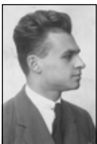
Witold Pilecki, lata 20.

Nie znamy wszystkich okoliczności powyższej decyzji. Wiemy, że rozkazu nie mu-