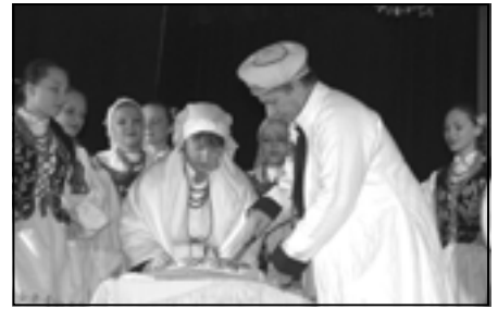
„Nasz pan drużba kołoc kraje..”

Nie obyło się bez zatargu między tańczącymi i bijatyki tak, że „starzy” musieli godzić młodszych.