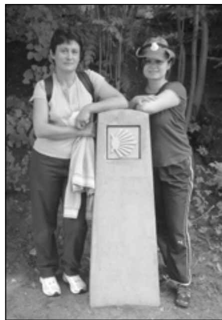
Stup-drogowskaz z muszlą św. Jakuba w Zieloncach – symbolem pielgrzymowania.

Drogi św. Jakuba dla Polaków są nowością, ale w Niemczech, Francji i Hiszpanii przeżywają prawdziwy renesans. Jak wynika ze statystyk sanktuarium św. Jakuba Apostoła w Santiago de Compostela w 1970 r. przybyło ich tam zaledwie 68, w 1985 r. – 690, a w roku 2007 już 114 tysięcy pielgrzymów. Odrodzenia się kultu św. Jakuba i tradycji pą-