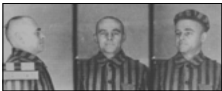
Witold Pilecki, więzień KL Auschwitz nr 4859.

siał wykonać, miał wolną rękę. Okazji do aresztowania nie musiał szukać długo; 19 września 1940 r. hitlerowcy urządzili na Żoliborzu, Grochowie i Mokotowie wielką łapankę. Pilecki przebywał wówczas w mieszkaniu Eleonory Ostrowskiej przy al. Wojska Polskiego na Żoliborzu. Mógł łatwo uniknąć aresztowania, lecz sam wyszedł do żołnierza niemieckiego stojącego w drzwiach mieszkania.