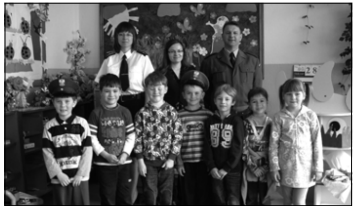
Policjanci z najmłodszymi uczniami z Boreczku.