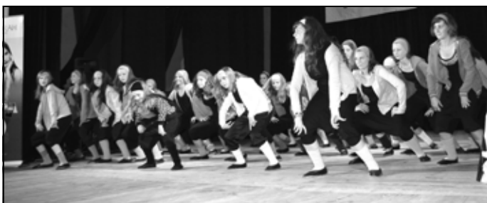
Blues w tańcu dyskotekowym.