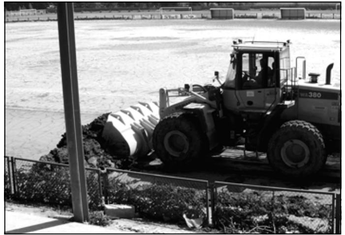
Do oczyszczenia z mułu płyty stadionu Lechii potrzebny był ciężki sprzęt.

Udział w akcji ratowniczej brały wszystkie jednostki Ochotniczej Straży Pożarnej z terenu gminy Sędziszów Młp. W akcji usuwania skutków powodzi wsparcia gminnym jednostkom udzielały również straża pożarne skierowane na nasz teren przez PSP Ropczyce, były to jednostki z: KP PSP Mielec, KP PSP Kolbuszowa, JRG Rzeszów, JRG Ustrzyki, OSP Niedolany, OSP Mymoń, OSP Poraż, OSP Posada Jasielska, OSP Dubiecko, OSP Bachów, OSP Bircza, OSP Rymanów, OSP Równie, OSP Miejsce Piastowe, OSP Pustyny, OSP Iwonicz, OSP Kombornia, OSP Żołyńca, OSP Kopanie, OSP Soni-