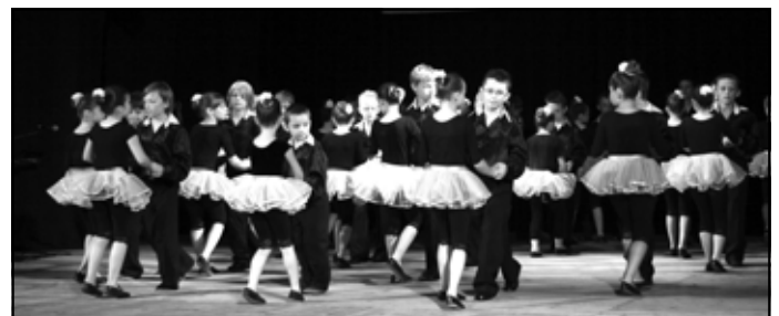
Na scenie zespół Blues.