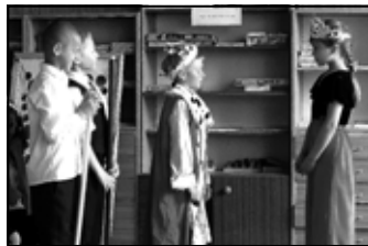
Występ dla kolegów i rodziców na zakończenie projektu.

że każdy człowiek ma wiele stonkowo odrębnych inteligencji, co podważa założenie o istnieniu tylko jednego typu inteligencji. Te inteligencje są równoprawne, żadna nie jest ważniejsza od innej. Wyróżnia on 8 typów inteligencji: językową, ruchową, matematyczną – logiczną, wizualno – przestrzenną, muzyczną, interpersonalną i intrapersonalną. Teoria ta ma stanowić podstawę do zmiany modelu edukacji. W szkole bowiem dzieci powinny mieć możliwość nabycia umiejętności wykorzystywania własnego potencjału i uczyć się w sposób jaki im odpowiada. Każdy człowiek posiada naturalne predyspozycje do określonego rodzaju lub rodzajów inteligencji. Poszczególne typy inteligencji są u ludzi w różnym stopniu rozwinięte i tworzą wspólnie indywidualny profil inteligencji. W tym programie dostrzega się zachodzące zmiany poprzez określenie „mocnych” i „słabych” stron. Znając te profile oraz zainteresowania i możliwości dzieci z klasy pierwszej, został opracowany autorski program pt. „Z legendą przez Polskę”. Podczas jego realizacji uczniowie poznali wiele zakątków Polski i legendy związane z każdym z tych regionów. Podziwiali zabytki, dowiadywali się