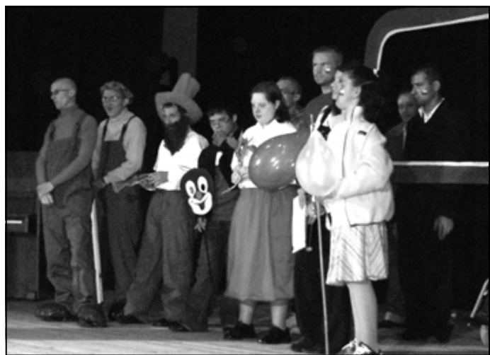
Sąsiedzi, Rumcajs, Krecik: podopieczni DCA przedstawiają Czechy.