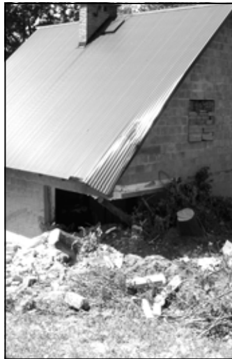
Zniszczony przez osuwisko dom w Zagorzycach.

Łącznie w trakcie akcji powodziowej (maj, czerwiec) wydano ok. 30 tys. worków i dostarczono kilkaset metrów sześciennych piasku.