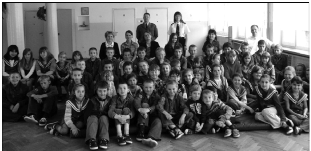
Uczniowie, nauczyciele i goście z Policji na „rodzinnej” fotografii.