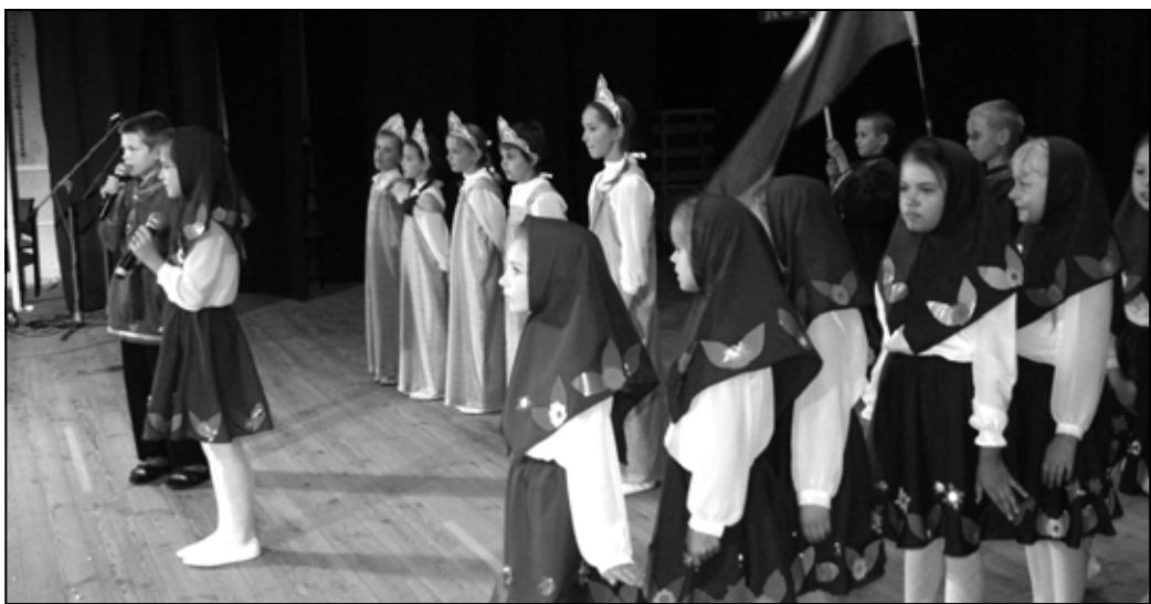
Rosję prezentują uczniowie z Góry Ropczyckiej.

Tegorocznym Prezentacjom Artystycznym Szkół przyświecało hasło „Podróż dookoła świata”,