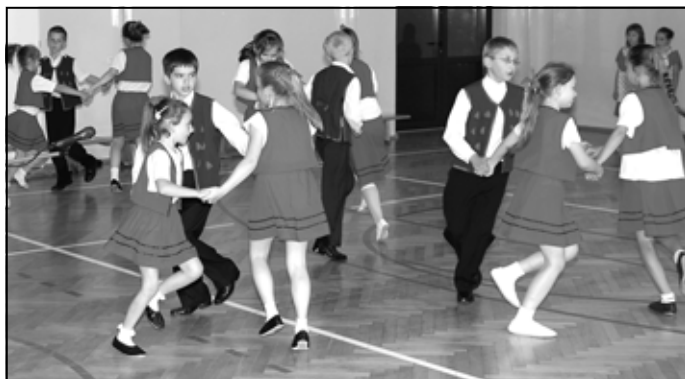
Roztańczone dzieci z Góry Ropczyckiej.

Na koniec przyszła pora na występ najstarszych uczniów naszej szkoły, z klas IV-VI. Uczniowie wykonali kilka tańców, m.in. poloneza i polkę czeską. Ubrani byli barwnie i kolorowo, tańczyli z wdziękiem, czym zachwycili Rodziców i wszystkich zgromadzonych. Tańce przeplatane były śpiewem solowym i zespołowym, inscenizacją i recytacjami. Za swój