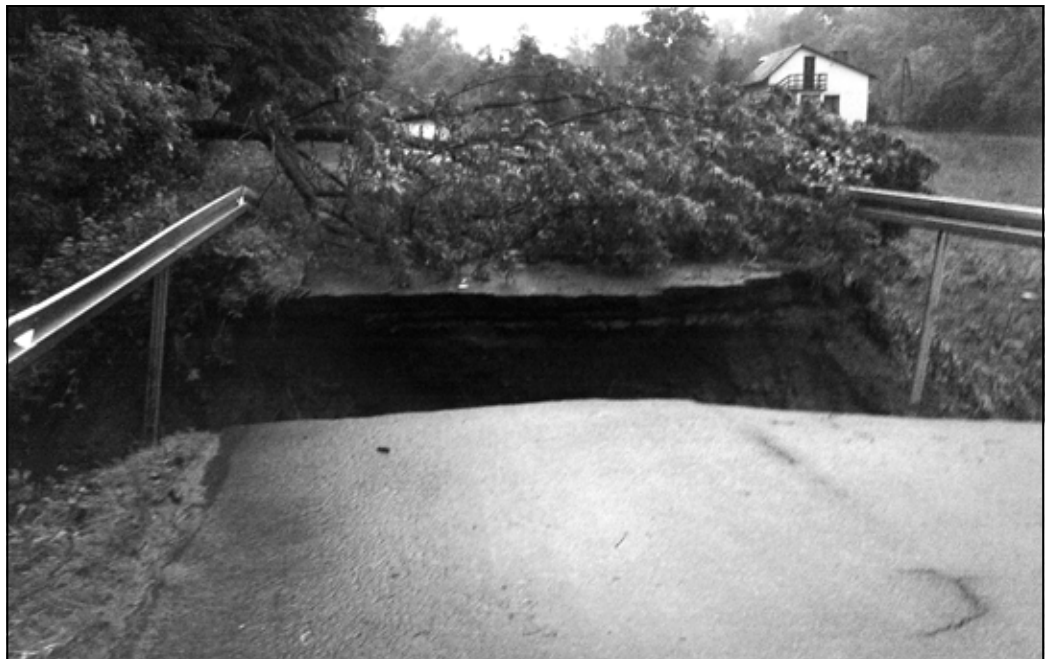
Zniszczona przez wodę droga w Szkodnej.