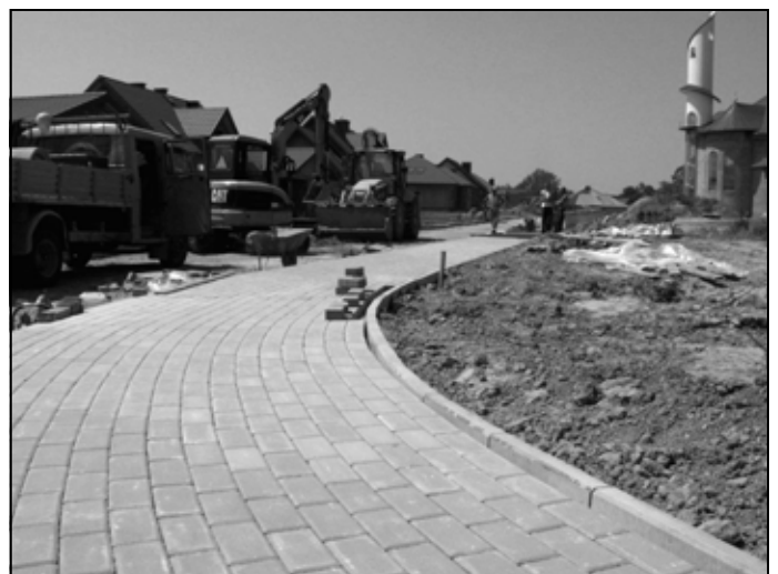
Budowa ulic na „Trójkacie”.