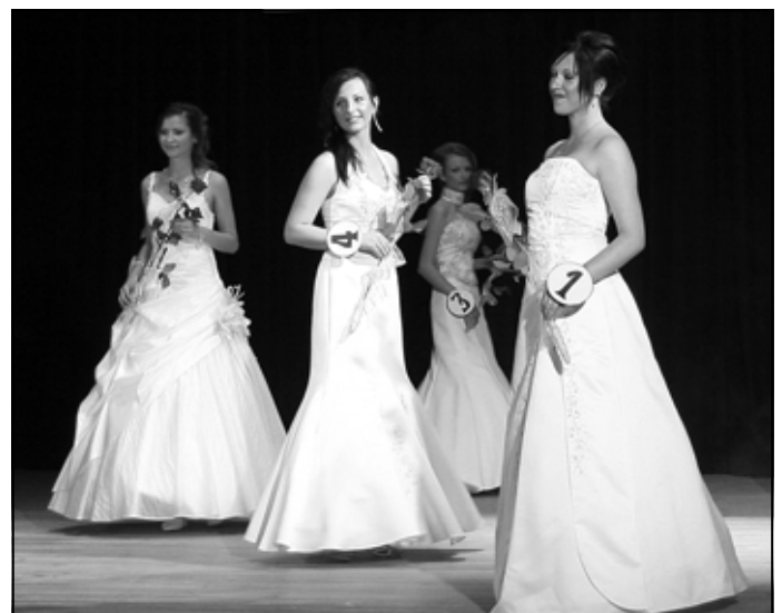
Kandydatki do tytułu Miss w sukniach ślubnych.