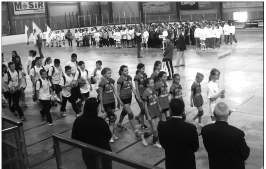
Przemarsz reprezentacji Podkarpacia.

Korzystając z pięknej pogody i mając trochę wolnego czasu,