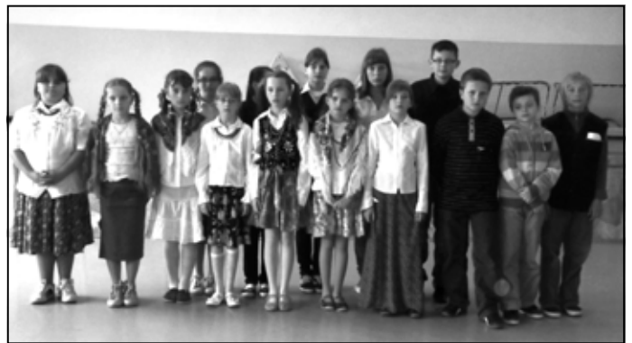
Uczestnicy konkursu i recytatorzy.