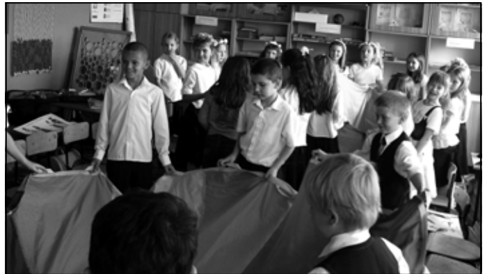
Zabawy z chustą animacyjną.

W Szkole Podstawowej w Kawęczynie miesiąc ten od lat ma jeszcze jedno skojarzenie – z tradycyjnym, lubianym konkursem regionalnym. Tak jak przed laty również i w roku bieżącym doborowa stawka 11 uczniów z klas: IV, V i VI z ochotą zdecydowała się dodatkowo pogłębić wiedzę o swojej małej Ojczyźnie. W obecności pozostałych kolegów i nauczycieli 21 czerwca uczestnicy konkursu odpowiadali na pytania dotyczące historii i współczesności Sędziszowa Młp. oraz okolicznych miejscowości. Posiłkując się ilustracjami, opowiadali o życiu i obyczajach naszych przodków. Wbrew pozorom staropolskie zwyczaje nie stanowią zamkniętej, obcej nam dziedziny. Wpływają one znacząco na naszą mentalność, podkreślając silną więź człowieka z jego przeszłością. Oryginalność rodzimych, kulturowych tradycji decyduje przecież o naszej odrębności i tożsamości narodowej. Kwestię ową podkreślali w swych wypowiedziach uczestnicy konkursu. Komisja brała również pod uwa-