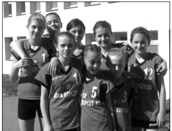
Drużyna z Góry Ropczyckiej podczas Mistrzostw Polski w Elblągu.

Wyjazd siatkarek do Elbląga był możliwy dzięki Sponsorom, którymi byli: