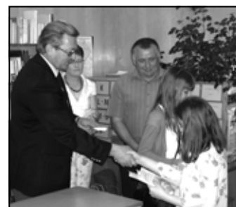
Gratulacje i wręczanie nagród