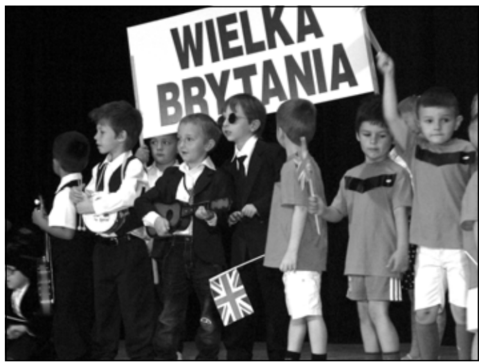
Zespół The Beatles oraz „Czerwone Diabły” czyli Przedszkole nr 1 prezentuje Wielką Brytanię.