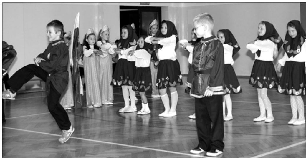
Tańce rosyjskie w wykonaniu uczniów szkoły.