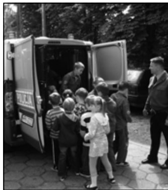
Spotkanie było dla dzieci z Boreczku okazją do obejrzenia z bliska policyjnego sprzętu.