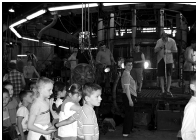
Wizyta w Hucie Szkła w Krośnie.

Ordrzykoń i ruiny zamku „Kamieniec”, sławnego ze sporu Firlejów i Skotnickich, którą to historię wykorzystał A. Fredro w znanej wszystkim komedii „Zemsta”. Tam też z daleka podziwiano rezerwat skalny „Prządki”, a także panoramę Pogórza Strzyżowskiego i Dynowskiego.