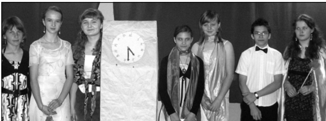
Uczestnicy spektaklu „Cinderella”.