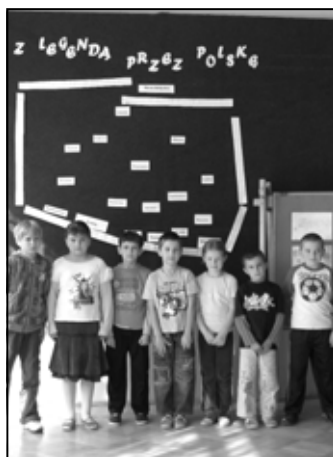
Uczestnicy konkursu w szkole w Zagorzycach Dolnych.