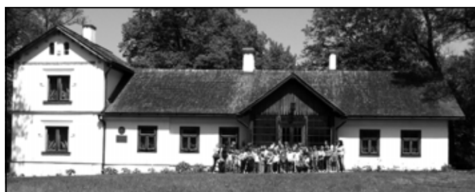
Przed Muzeum Marii Konopnickiej w Żarnowcu.