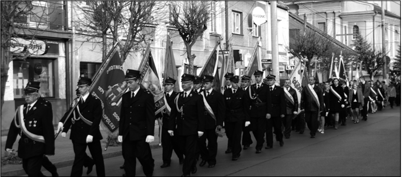
Uroczysty przemarsz z kościoła parafialnego pod ratusz. Na czele druhowie z jednostek OSP.

11. listopada 2010 roku odbyły się gminne obchody 92. rocznicy odzyskania niepodległości.