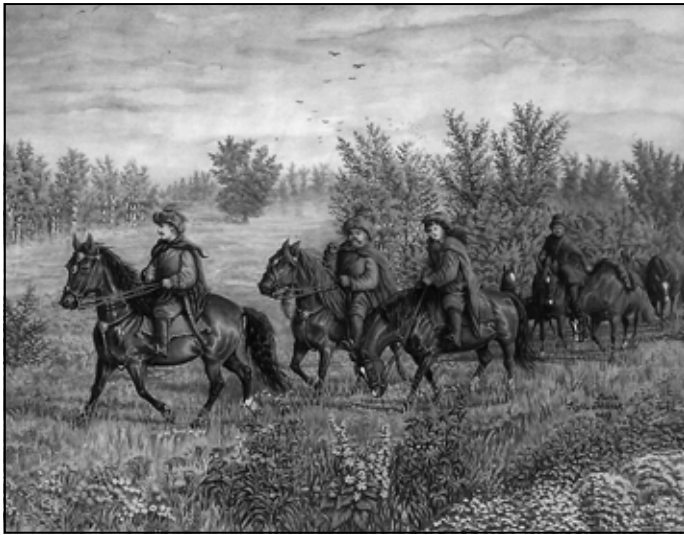
Święty Hubert z lasu cały obiad daje.

roślach. Jak wiadomo, dawniej ludzie byli o wiele bardziej przesądni niż obecnie. Dotyczyło to też myśliwych. Przed łowami „zamawiali” fuzje, kule odlewali pod figurami świętych, starali się uniknąć spotkania z młochami i starszymi kobietami. Bywało, że mimo wszystko „zmyślna” zwierzyna wywodziła myśliwych na manowce: A gdy ów się chwali, tamten żali, Ten żył na psy, ten na siebie (...) Wieść powrotu odgłos niesie, aż w domowe nasze progi, Tam nas czeka stół nakryty, nie wykwintny, lecz obfity.