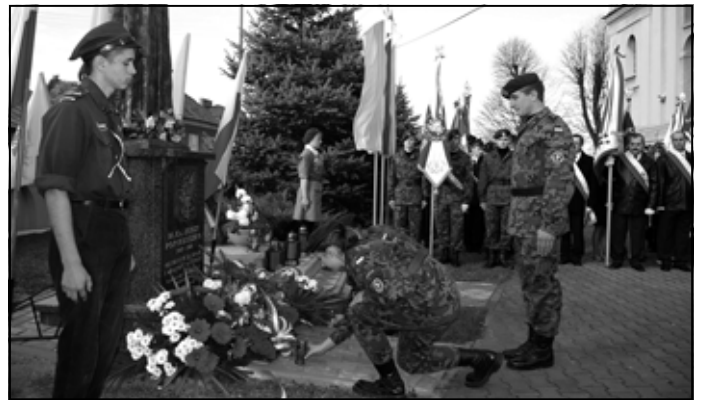
„Strzelcy” zapalają znicze przed pomnikiem bł. ks. Jerzego Popiełuszki.

dziernika 1917 roku, tj. od chwili ogłoszenia warszawskiej Rady Regencyjnej, że łączy Galicję do Państwa Polskiego, wywieszono, mimo protestów starostwa i żandarmerji, na gmachu Magistratu polską flagę i nie zdjęto jej, mimo poleceń, które nadszły z namiestnictwa lwowskiego, już w dniu 1. listopada 1918 roku spadły o 8-mej rano orły i emblematy austriackie na oczach batalionu austriackiego, wojska, złożonego z Czechów i Niemców.