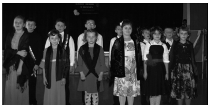
Uczniowie klasy IV SP w Kawęczynie uczestniczący w akademii z okazji 92. rocznicy odzyskania niepodległości.