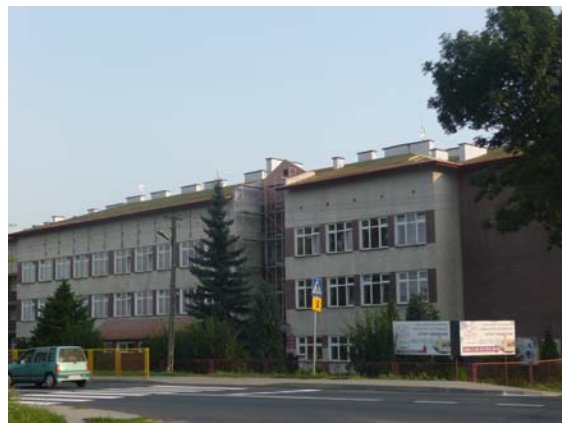
Zmiana dachu na budynku ZS w Stalach.

ofert wybrano najkorzystniejszą ofertę P.H.U. „WAMIX” Tarnobrzeg za kwotę brutto 365 371,36 zł. Termin zakończenia prac: 27.08.2010r.