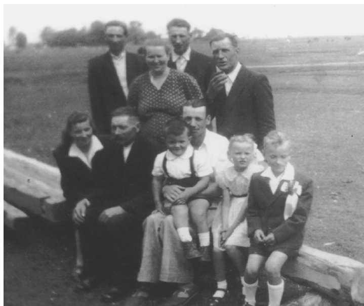
Pierwsza Komunia Święta 1958r.