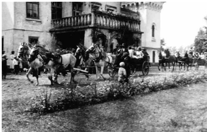
Dożynki 1928r. (przed pałacem Dolańskich)