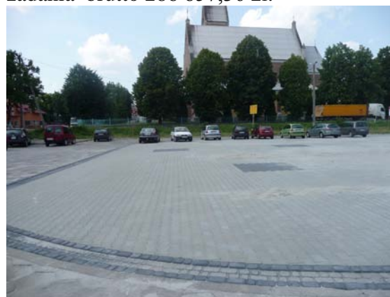
Plac targowy w Grębowie.

Inwestycja pn.: „Remont miejsc służących krzewieniu kultury-Przebudowa centrum Grębowa” została wykonana przez firmę MOKBUD z Tarnobrzega, której oferta została wyłoniona jako najkorzystniejsza spośród 10 firm. Wartość zadania brutto 286 857,36 zł.