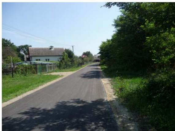
Droga gminna Żupawa-Centrum 300m.

W toku realizacji są następujące odcinki dróg: Zabrnje - Lisia Góra (245m), Stale-Rokita (936m), Zabrnje-Barany (705m), pozostałe o łącznej długości 1156m zostały już zrealizowane.