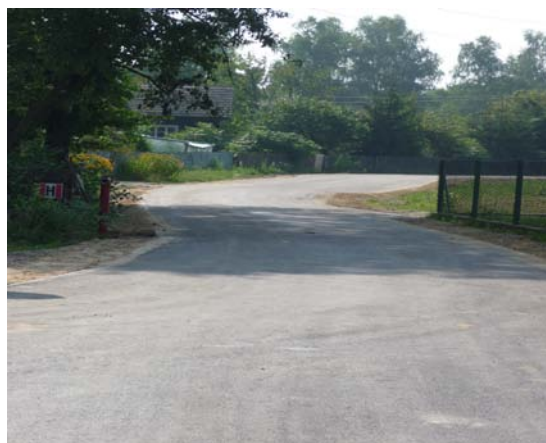
Droga gminna Stale-Ługi (310m)

Obecnie w trakcie realizacji jest droga Wydrza – Fietko (280m), natomiast pozostałe w/w o łącznej długości 2,5 km zostały już zrealizowane.