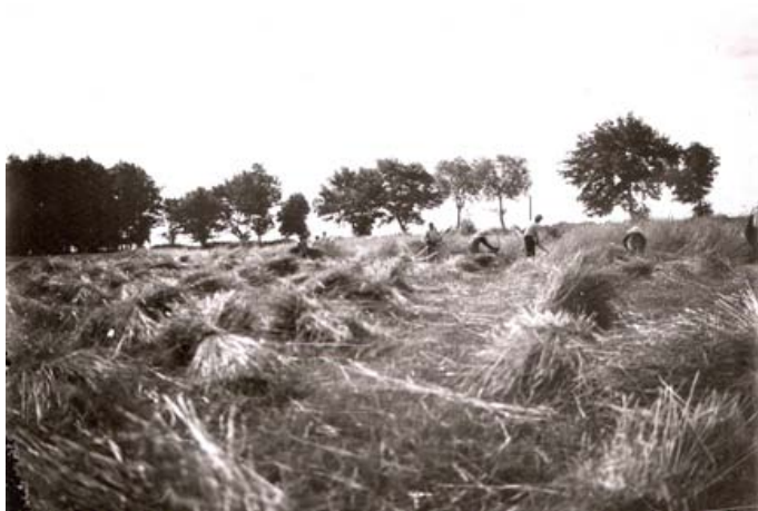
Żniwa w majątku Dolańskich, rok 1940.

Stare zdjęcia przedstawiają pracujących zniwiarzy na polach Dolańskiego i dożynki w 1928 r. – korowód przed pałacem.