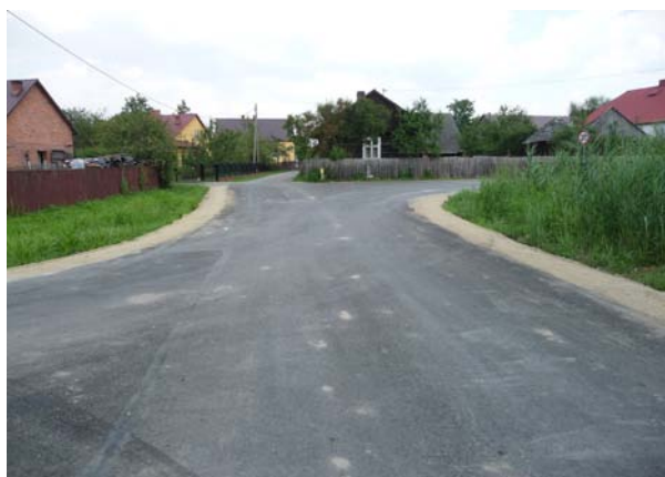
Droga gminna Jamnica za szkołą 550m

W kwietniu dokonano wyboru oferty na: „Przebudowę dróg gminnych: Zabrnje – Lisia Góra, Żupawa – Centrum, Żupawa – Wdowiak, Jamnica – Podchoinie, Stale – Rokita, Zabrnje-Barany, Grębów – Za Weterynarią” .