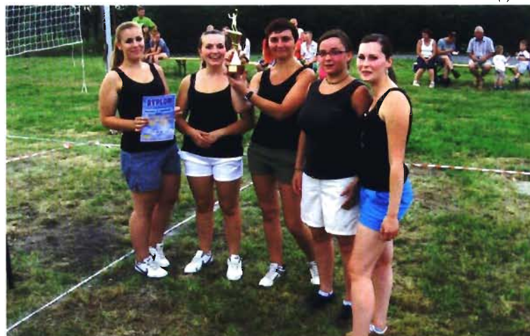
Zwycięska drużyna panien w siatkówce

Po turnieju siatkówki rozegrany został mecz piłki siatkowej panny - mężatki. Mimo starań mężatek drużyna panien wygrała mecz 25 : 22.