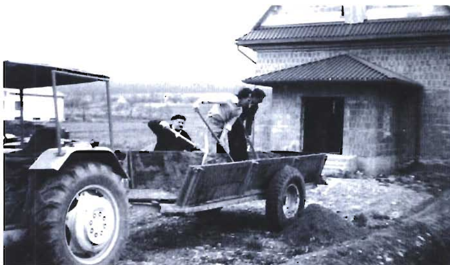
Mieszkańcy Niżej Łąki pracują przy budowie kościoła

Dlaczego wsi tak bardzo zależało na kościele? - Część mieszkańców chodziła do kościoła do Wrocanki, bo było blisko, ale starsi przywiązani byli do Bóbrki (Niżna