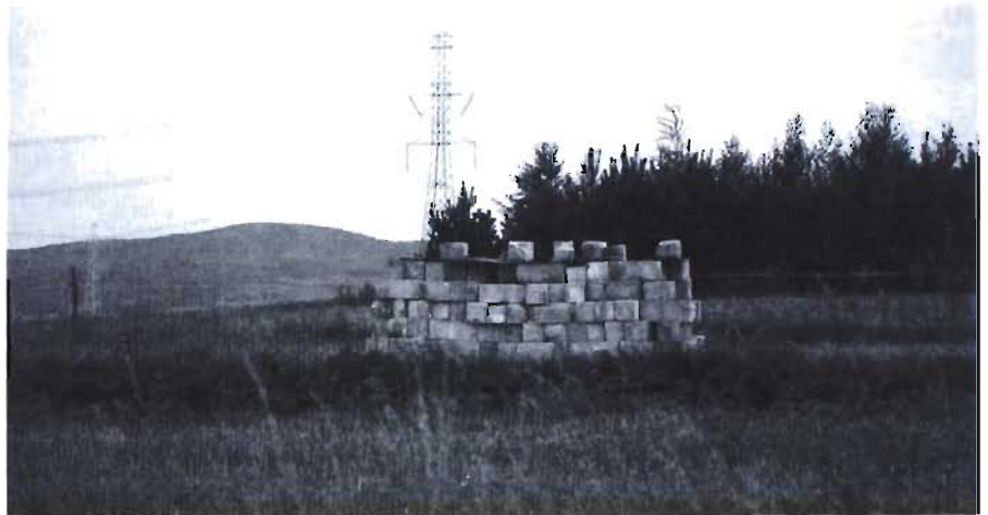
Pierwsze pustaki (z rozbiórk) stoją już na działce, na której ma być zbudowany kościół.