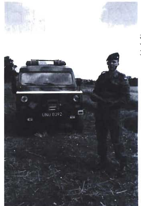
Odnaleziony granat moździerzowy zabrali ze sobą saperzy