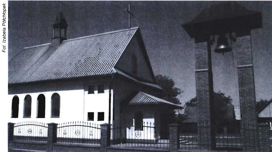
Kościół w Niżnej Łące - duma mieszkańców

- Starsi żyją kościołem. Dla nich kościół jest wszystkim. Dla młodych - różnie - próbuje wyjaśnić jedna z mieszkank Niżnej Łąki. - Msze są w niedziele i święta. Chrzczyny, śluby - sporadycznie. Ale na majówki ludzie zbierają się sami i sami odprawiają nabożeństwa. Często różaniec, przed pogrzebami, odprawiany jest zamiast w domu, to w kościele. Ostatnio było 50 osób.