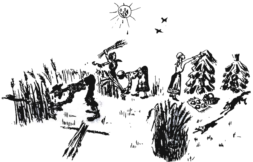
Moje coroczne wczasy

Gdy pogoda zaczynała się psuć, trzeba było zwozić zboże pośpiesznie i to nieraz w nocy, aby tylko nie dopuścić do zмокnięcia i zgnicia na polu. Te ukłucia wysuszonych kłosów czy słomy, mimo upływu dziesiątek lat, czuję do dzisiaj.