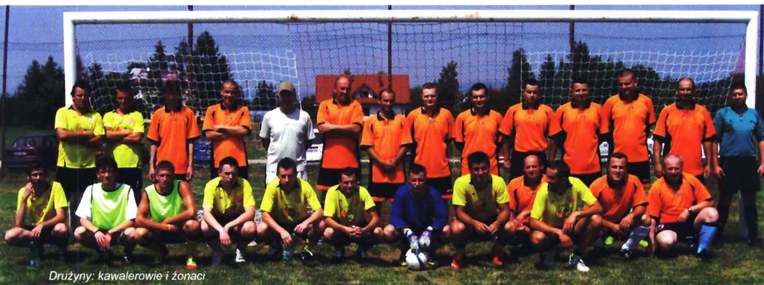
Drużyny: kawalerowie i żonaci