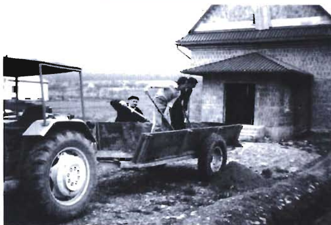
4 Jak budowano kościół w Niżnej Łące