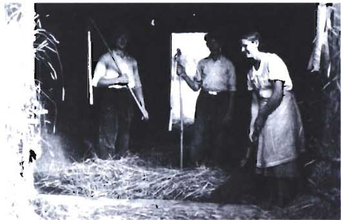
Kiedyś zboże młócono cepami