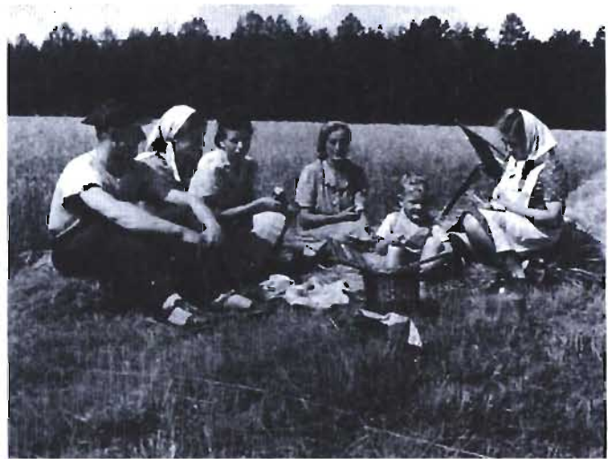
Pora obiadowa w polu