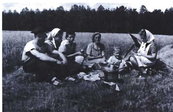
26 Moje coroczne wakacje