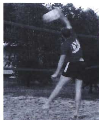
34 Siatkówka plażowa