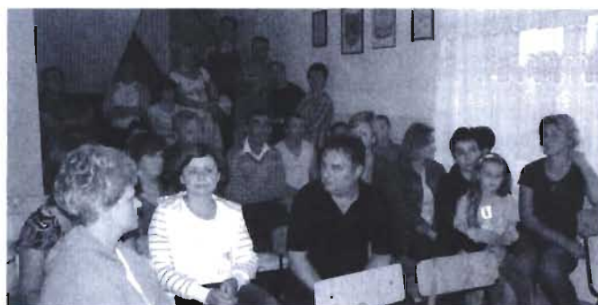
Spotkanie założycielskie w szkole