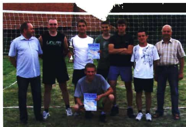
II miejsce w turnieju zdobył zespół z Rogów