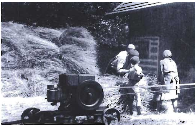
Młocka. Esiok - zwany też motorkim, służył do napędzania młocarni