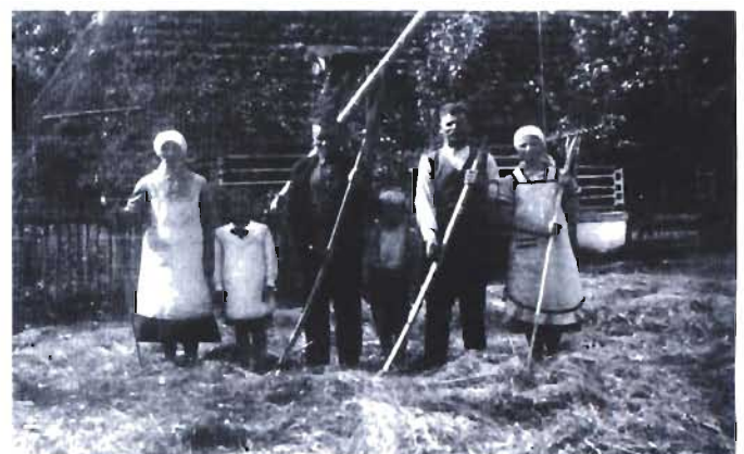
Kiedyś zboże młócono cepami