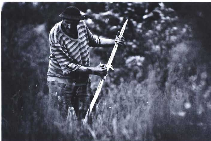
Jedno z cyklu zdjęć „...by sprostać unijnym wymogom... - koszenie trawy”. Fot. Marcin Pirga z Głownienki – I NAGRODA w konkursie fotograficznym „Człowiek i jego otoczenie” organizowanym przez GOK w Miejscu Piastowym