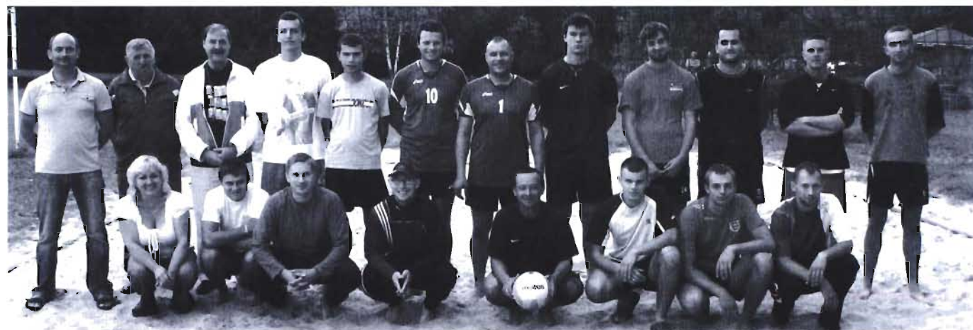
Uczestnicy rozgrywek powiatowych z organizatorami