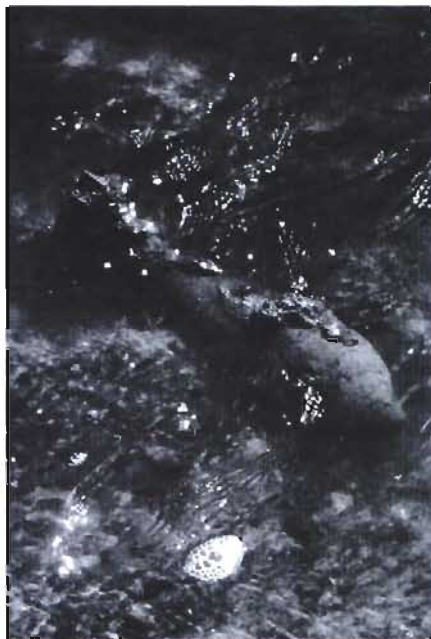
Pocisk został odstroniony podczas poszerzania rowów melioracyjnych

Saperzy, po zabezpieczeniu niewypału, przeszukali fosę. Znaleźli jeszcze łuskę od karabinu maszynowego.