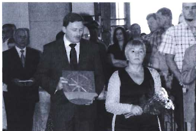
10 Dzień Patrona Gminy