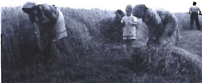
Skoszone zboże kobiety powróżkami wiązały w snopki