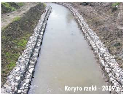
Koryto rzeki - 2009 r.

to dopiero pierwszy etap - informuje burmistrz - Przed nami budowa zbiornika wodnego, tzw. polderu (inwestycja