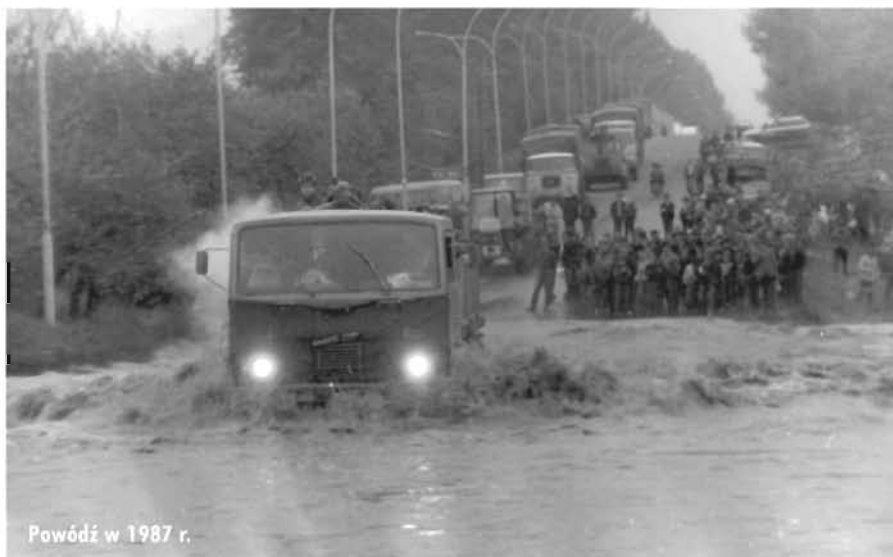
Powódź w 1987 r.

Natura, na szczęście, była łaskawa dla naszego miasta. Opady ustały, a prowadzone od kilku lat prace regulujące brzegi i koryto Mleczki oraz modernizacja stopnia wodnego byłej cukrowni, przejętego przez miasto, przyniosły pierwsze efekty. W ciągu kilku lat prace na rzece wyniosły około 1 mln zł. - Dotychczasowy zakres prac