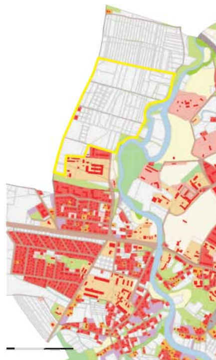
granice terenu objętego opracowaniem miejscowego planu zagospodarowania przestrzennego „za szpitalem” w Przeworsku