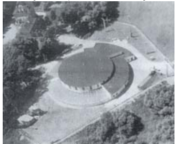
Oczyszczalnia ścieków w Paczkowie. Widok z lotu ptaka

Sam budynek jest niewielki i mieści się na działce 36a. Zwraca uwagę