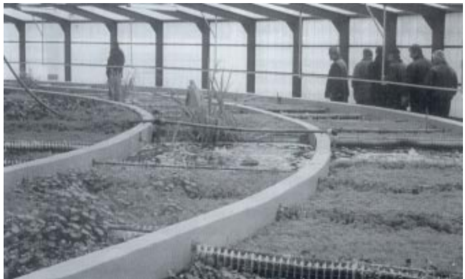
Paczków. Laguna hydroponiczna - III stopień oczyszczania ścieków