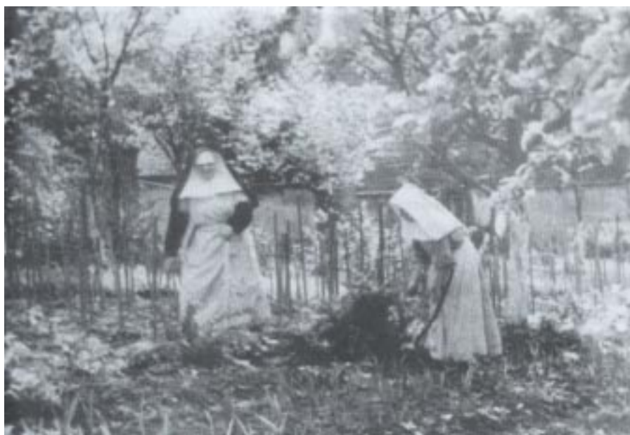
Siostry pracujące w przyklasztornym ogródku

czasem popatrzeć jak w nurcie wojennej szarzyzny mignął czasem szereg maluchów w kolorowych czapczkach na głowie, idących na spacer pod opieką Sióstr. Jedyną rzeczą jaką im w owym czasie dokuczała to faktyczna bieda, na którą nie było rady. We dworze rezydował niemiecki zarządca dóbr, a probostwo uważało, że zaopatrzyło je w sposób wystarczający. Jednak Siostrzyczki nie tylko dzielnie przetrwały złe lata, ale potrafiły też zatroszczyć się o potrzeby dzieci z Ochronki i ich rodzin, organizując dla nich posiłek i buty. Ochronka ta w roku 1949 została prze-