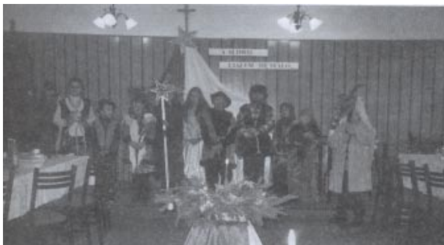
Grupa kolędnicza ze szkoły w Borówkach