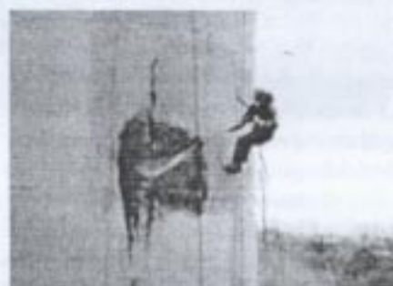
Piaskowanie na mokro i na sucho (remont komina w WSK Rzeszów, 1993)

Dane za 1999 r.: wysoka rentowność sprzedaży - 8,06%, efektywność wykorzystania aktywów - 19,52%, dochodowość środków zainwestowanych w przedsiębiorstwie - 34,06% i wskaźnik płynności finansowej (bieżącej) - 1,90 świadczą o dobrej kondycji finansowej przedsiębiorstwa, zdolności do generowania zysków i wysokim poziomie kadry menedżerskiej. Stan zatrudnienia wykazuje tendencję zwyżkową, pracownicy REST -u stale podnoszą kwalifikacje uczestnicząc w kursach i szkoleniach.