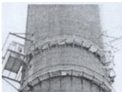
Montaż konstrukcji na obiektach wysokich (komin wys. 266 m, Trzebinia 1999)