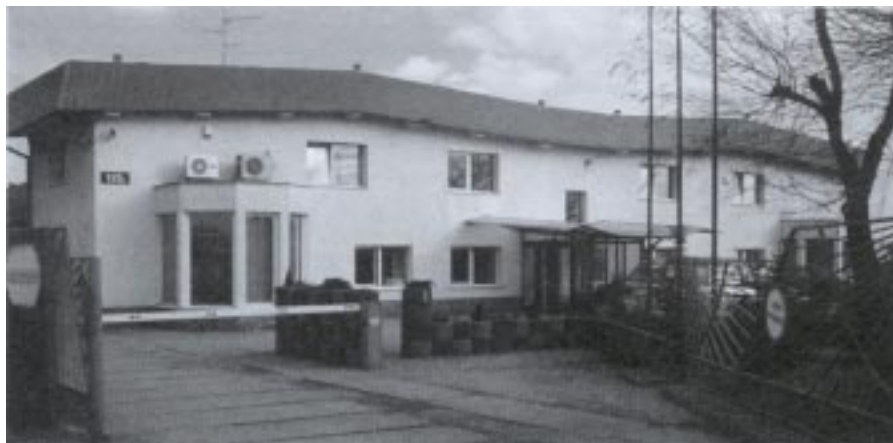
Budziwój, budynek firmy