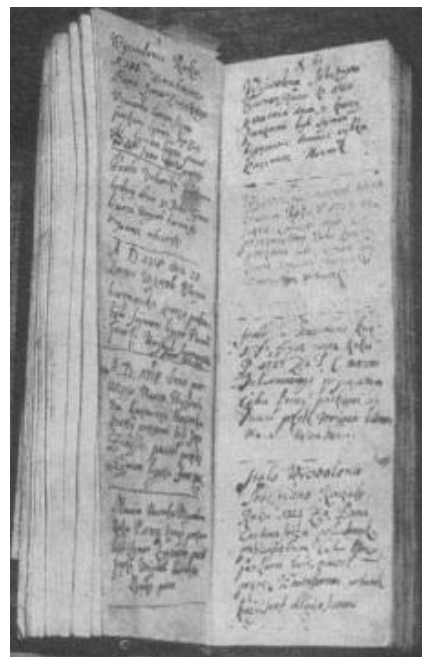
Tyczyńska księga cechowa

Oprócz opieki nad wyznaczonym ołtarzem, obowiązkowym udziale w mszach, żałomszach, procesjach i głównych świątach, cech zamawiał sobie do roczne msze opłacane z własnych składek, zwane „mszami przeprośnymi” lub „przeprósną niedzielą”. Końcem XVIII w. koszt jej wynosił od 6 do 8 złotych. Jak należy