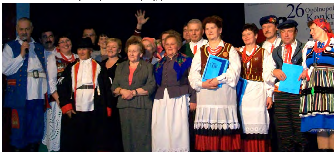
Po raz kolejny zespół „Grodziszczoki” zdobył główne nagrody