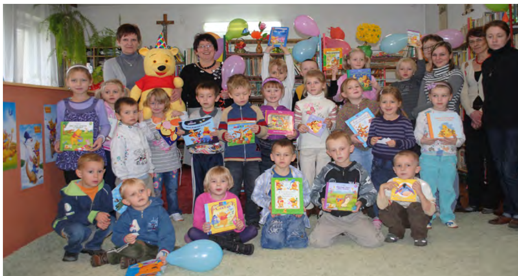
Przedszkolaki z Laszczyn otrzymały pamiątkowe kolorowanki