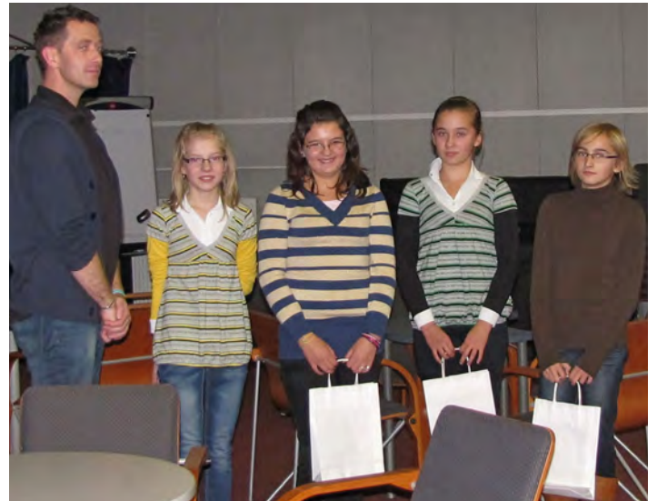
Zwycięzcy konkursu otrzymali nagrody