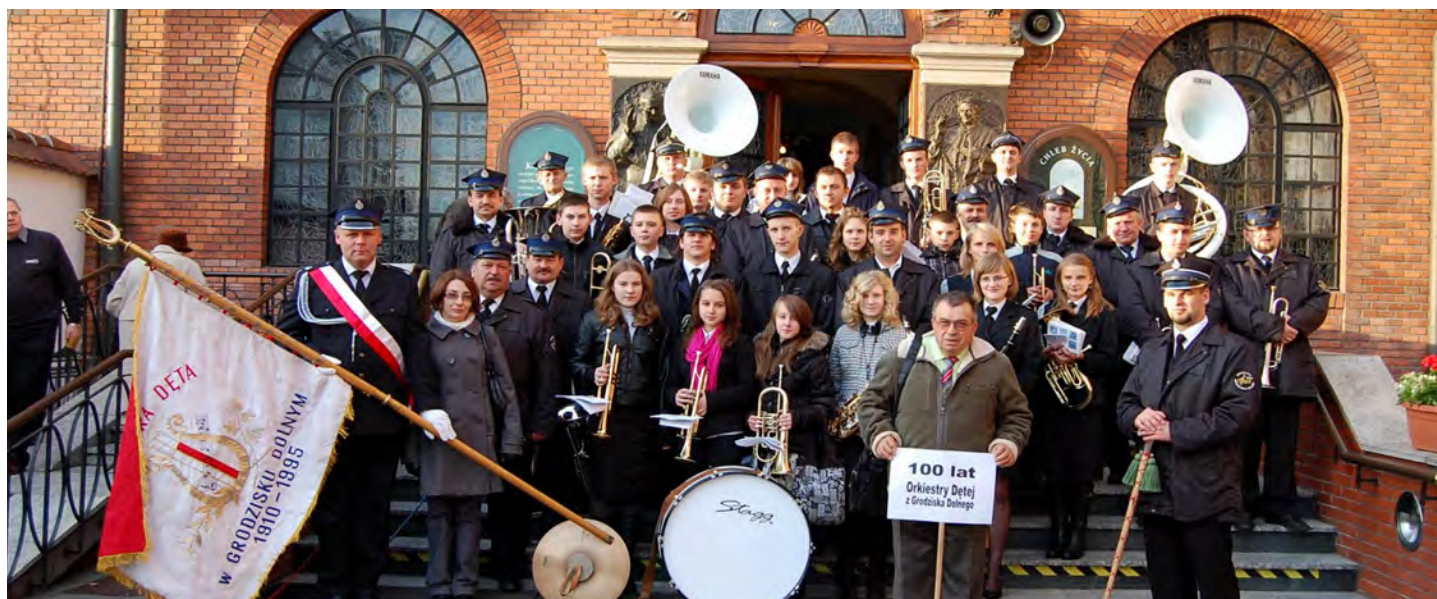
Pielgrzymka do Łagiewnik była zwieńczeniem tegorocznych jubileuszowych obchodów Orkiestry Dętej