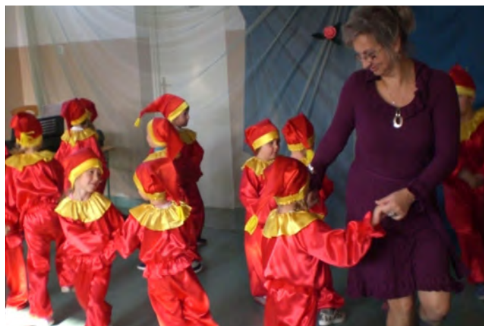
Miłym akcentem spotkania był taniec maluchów