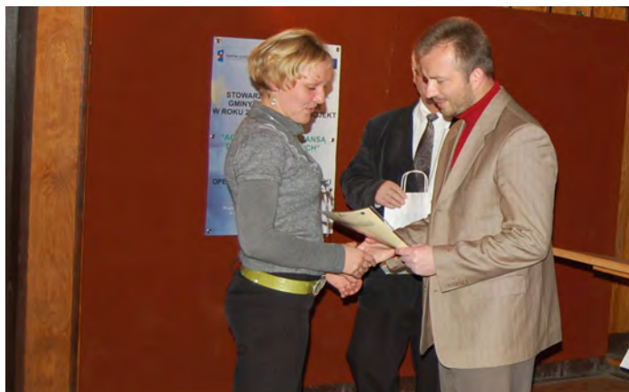
Uczestniczki projektu otrzymały certyfikaty

Celem projektu było przekazanie grupie 30 Pań teoretycznej i praktycznej wiedzy z zakresu prowadzenia działalności agroturystycznej, jak również przygotowanie ich do podejmowania pracy przy obsłudze ruchu turystycznego. Zajęcia szkoleniowe składały się z trzech