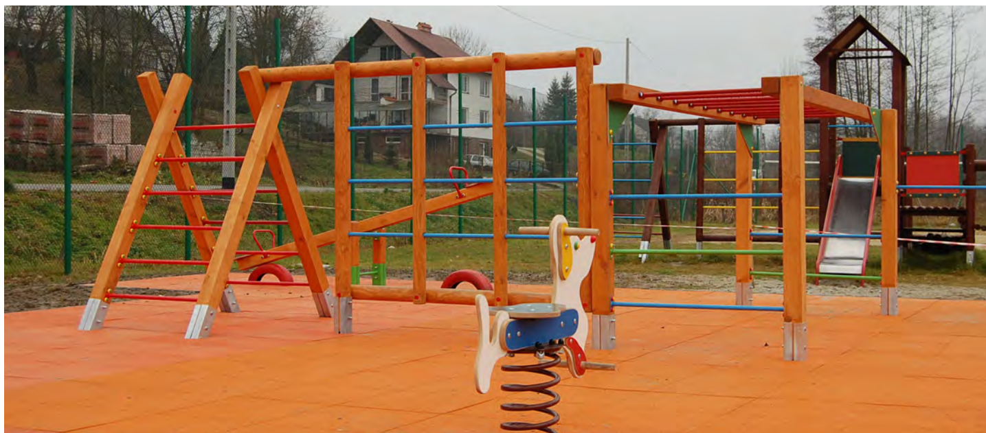
Nowy plac zabaw na Orliku w Grodzisku Dolnym