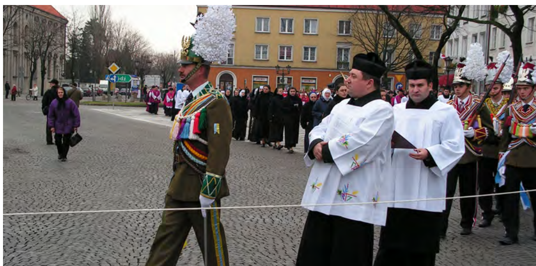
Uroczysty przemarsz ulicami Łowicza