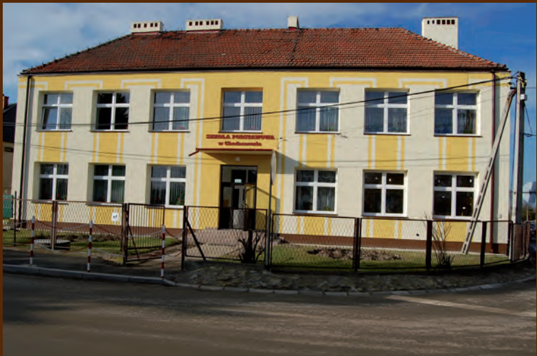
Nowa elewacja na Szkole Podstawowej w Chodaczowie