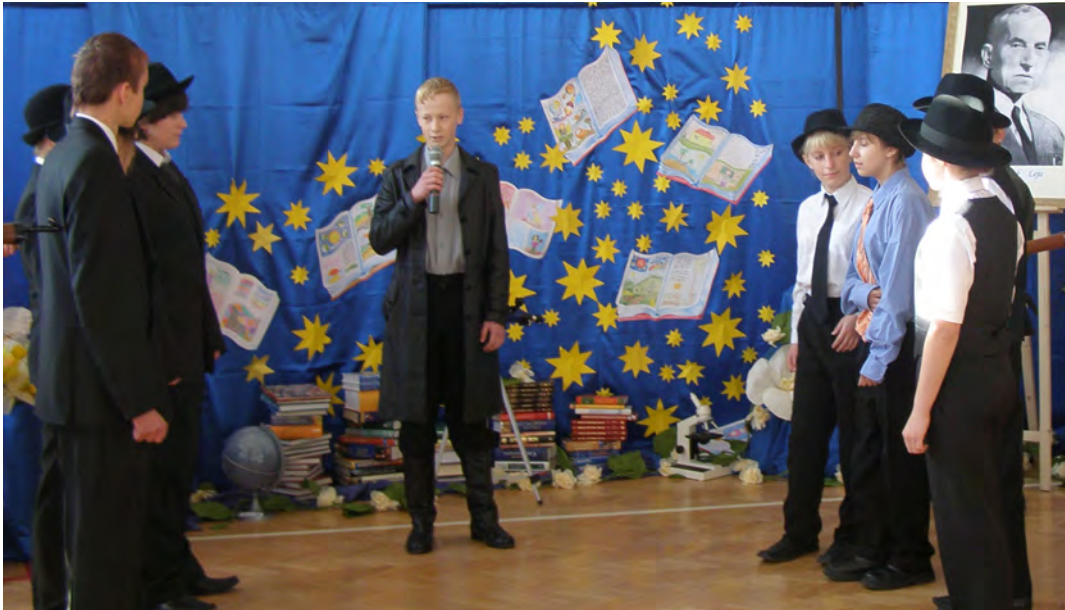
Młodzież z wielkim przekonaniem wcielała się w grane role