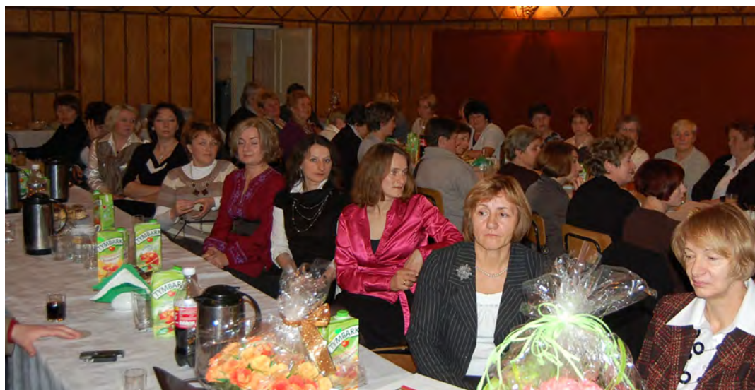
To już trzeci projekt realizowany przez Stowarzyszenie

modułów tematycznych tj.: „Warsztatów liderów”, „Obsługi ruchu turystycznego” i „Promocji turystycznej regionu”. Z praktyczną stroną funkcjonowania gospodarstw agroturystycznych uczestniczki projektu mogły się zapoznać w czasie dwudniowego wyjazdu studyjnego w okolice Myczkowiec w Bieszczadach.