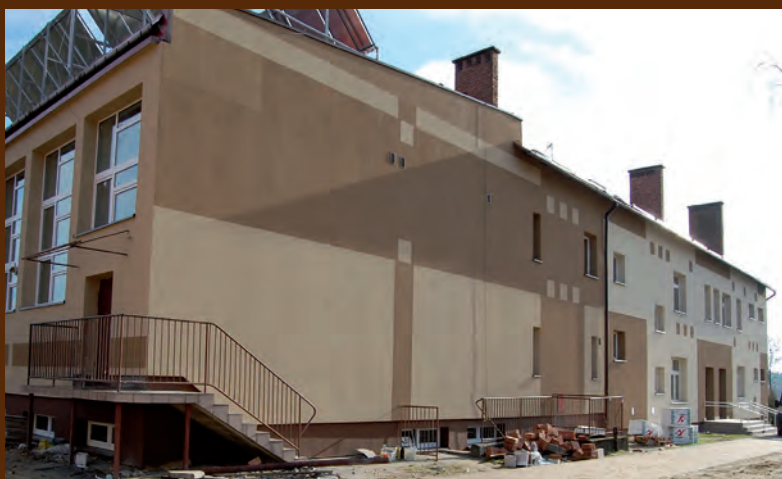
Nowa elewacja na budynku Szkoły Podstawowej w Laszczynach