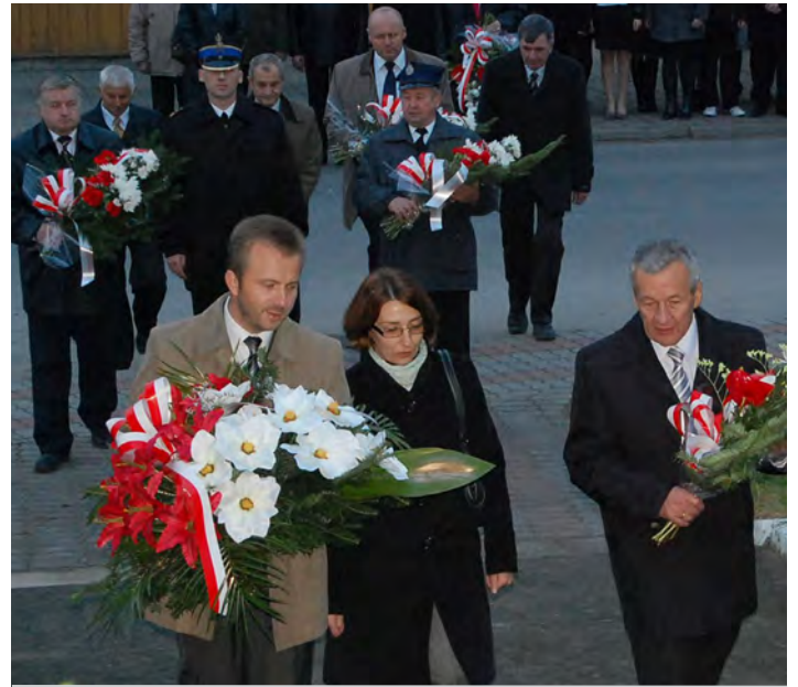
Delegacje wieńcowe składają kwiaty w Miasteczku