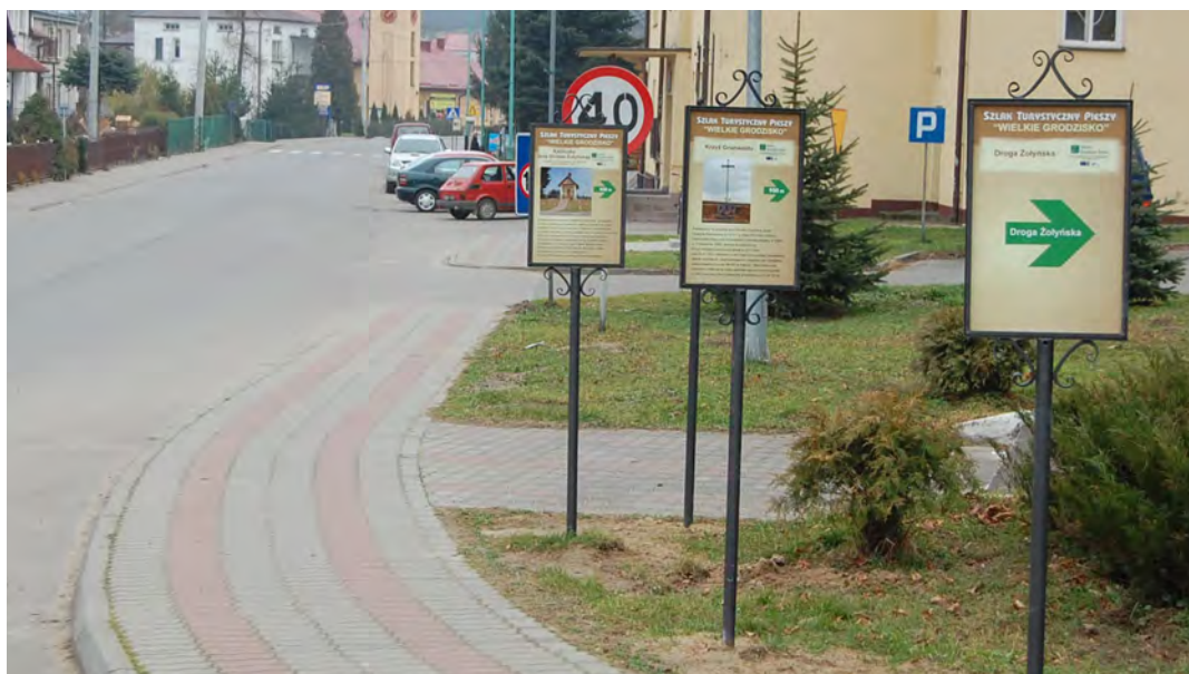
Na tablicach zamieszczono krótkie informacje z opisem danego obiektu