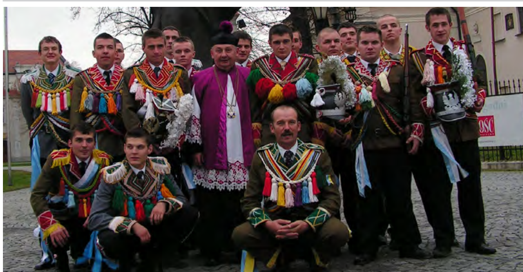
Do Łowicza „Turki” przybyły na zaproszenie ks. prałata S. Majkuta

W tym roku relikwie niesione były przez przedstawicieli różnych organizacji, stowarzyszeń, akcji i ruchów religijnych. Tego jakże wielkiego zaszczytu dostąpił także oddział „Turków” z Grodziska Górnego.