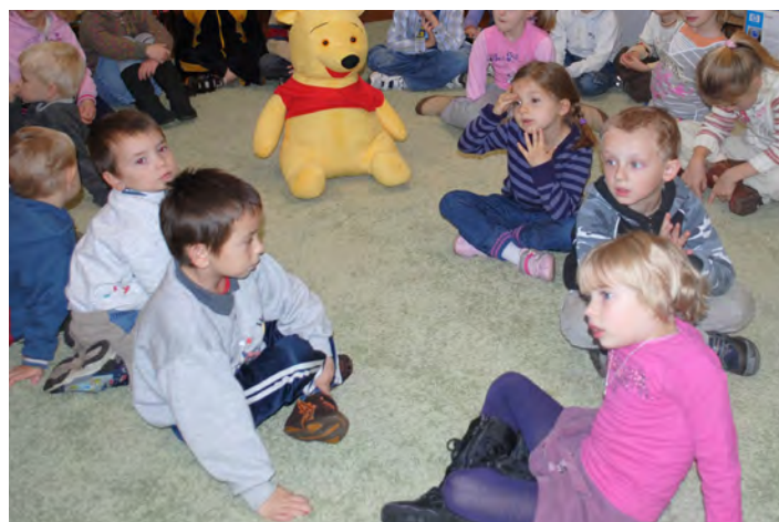
Na urodziny do Kubusia przybyło wielu gości

z Ochronki Świętego Jozefa. Spotkanie rozpoczęło się od krótkiej prezentacji kulisów powstania książki o Puchatku, następnie dzieci wysłuchały opowieści o przygodach naj słynniejszego misia na świecie. Później nastąpiło sprawdzenie wiedzy o Kubusiu oraz jego przyjaciółach i przystąpiono do zabaw ruchowych. Dzieci odnajdowały ukryte wśród innych książek bajeczki o Kubusiu Puchatku i nauczyły się wyliczanki misia o bardzo małym rozumku a wielkim sercu... i apetycie. Goście mieli okazję zło-