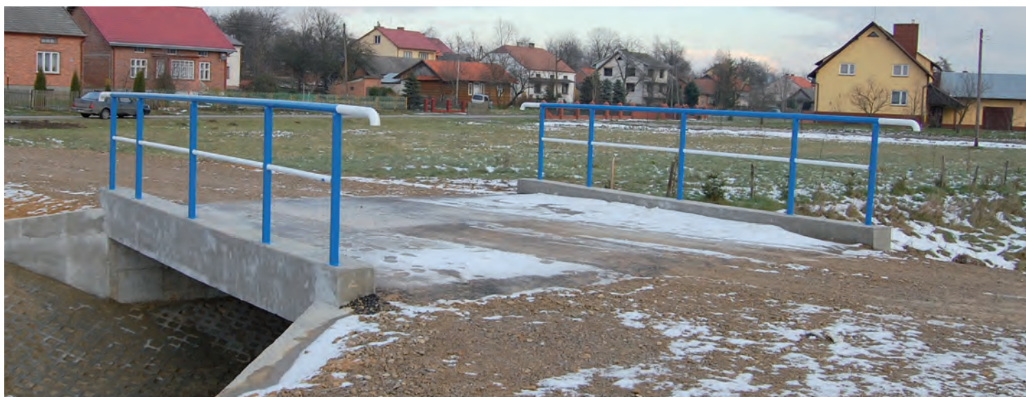
Przebudowany most na Misia w Grodzisku Górnym. Wartość inwestycji 112 tys. zł. Wykonawca: SUDR w Grodzisku Dolnym