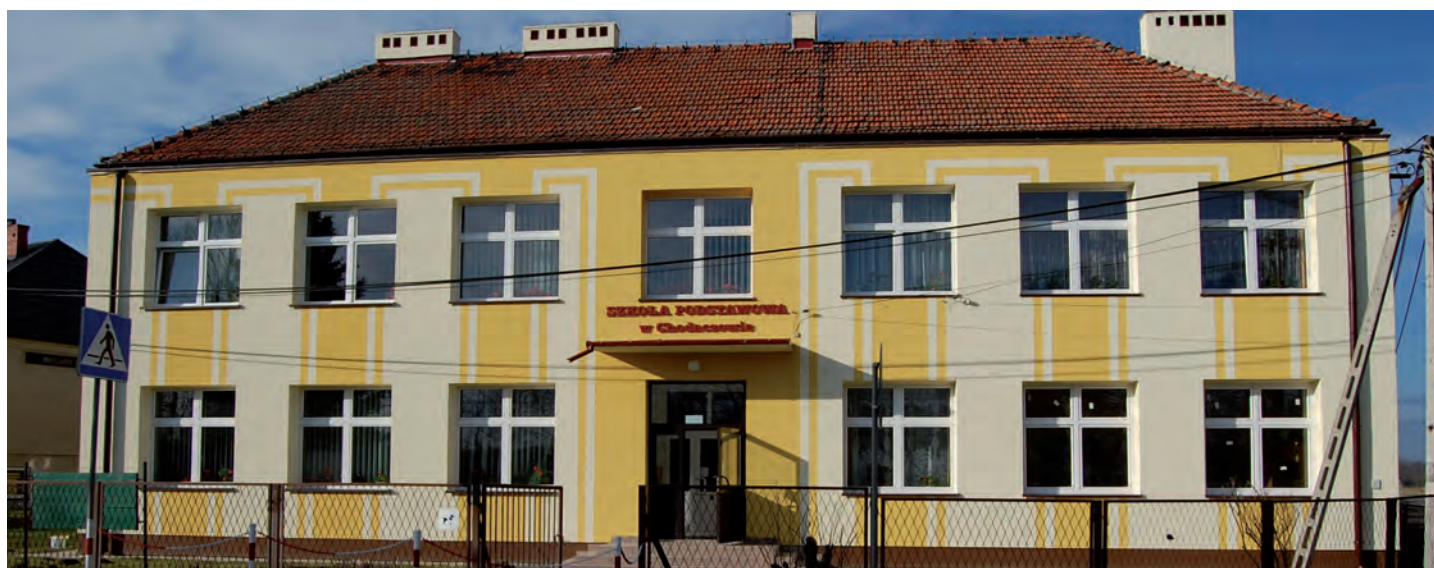
Nowa elewacja na Szkole Podstawowej w Chodaczkowie. Wartość inwestycji: 280 tys. zł. Wykonawca: Firma APEX z Leżajska