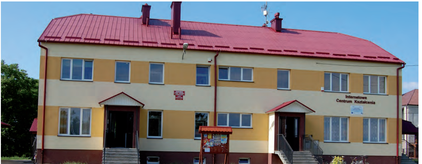
Nowa elewacja Domu Wiejskiego w Grodzisku Nowym. W budynku utworzono Internetowe Centrum Kształcenia. Wartość inwestycji 198 tys. zł. Wykonawca: Firma IGLOBUD z Leżajska