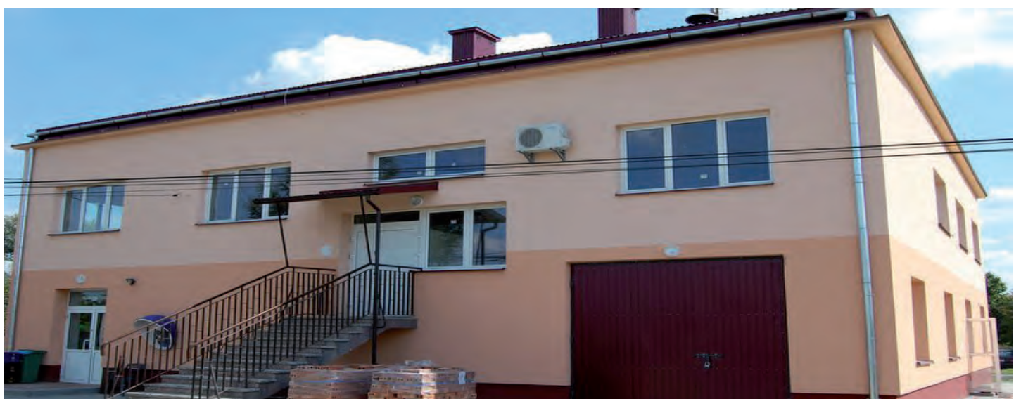
Nowa elewacja Remizy OSP w Chodaczowie. W budynku mieści się Punkt Lekarski. Wartość inwestycji 309 tys. zł. Wykonawca: Firma APEX z Leżajska