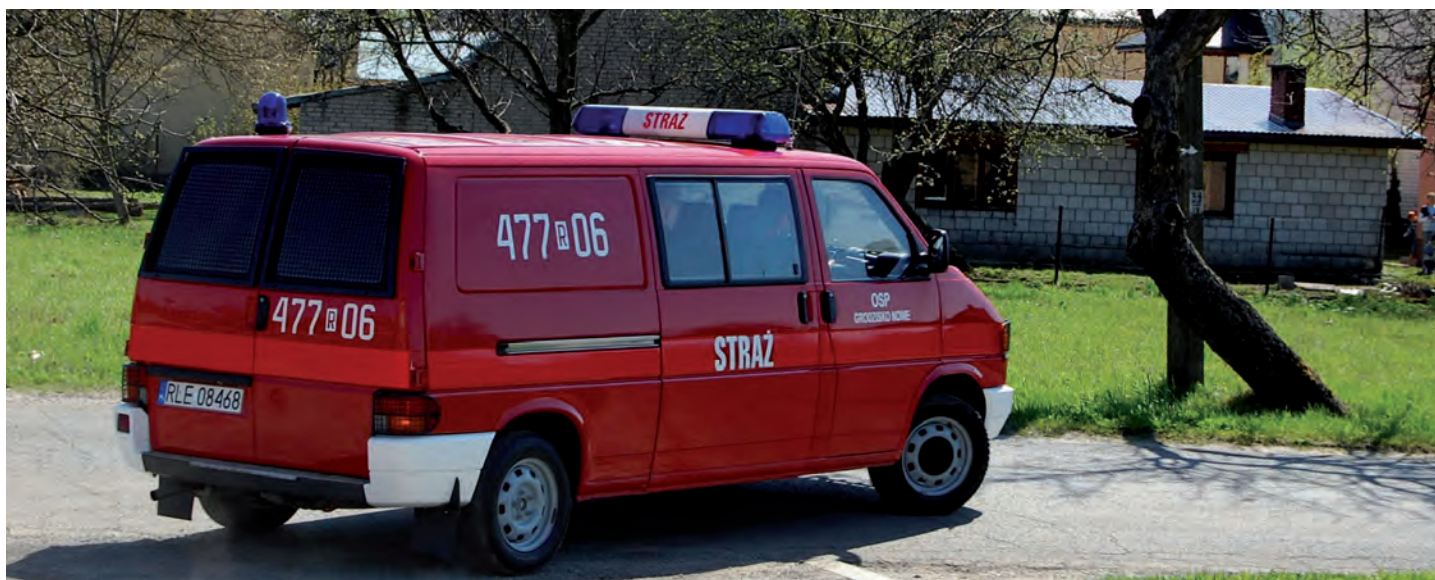
Pozyskany samochód dla jednostki OSP w Grodzisku Nowym. Wartość księgową 12 tys. zł Samochód przekazała Komenda Wojewódzka Policji w Rzeszowie