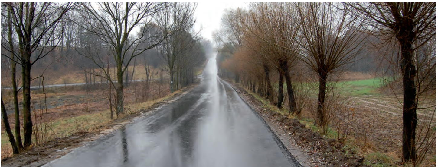
Przebudowana droga powiatowa Grodzisko Dolne „Miasto” - Podlesie. Wartość dofinansowania Gminy Grodzisko Dolne 374 tys. zł. Wykonawca: Leżajskie Przedsiębiorstwo Robót Drogowo-Mostowych S.A