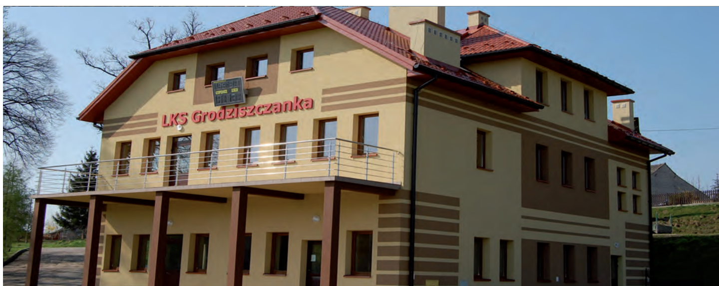
Zmodernizowany obiekt szatni sportowej w Grodzisku Górnym. Wartość inwestycji: 780 tys. zł. Wykonawca: Firma KOREM z Jeżowego, Firma LAX-POL z Ropy