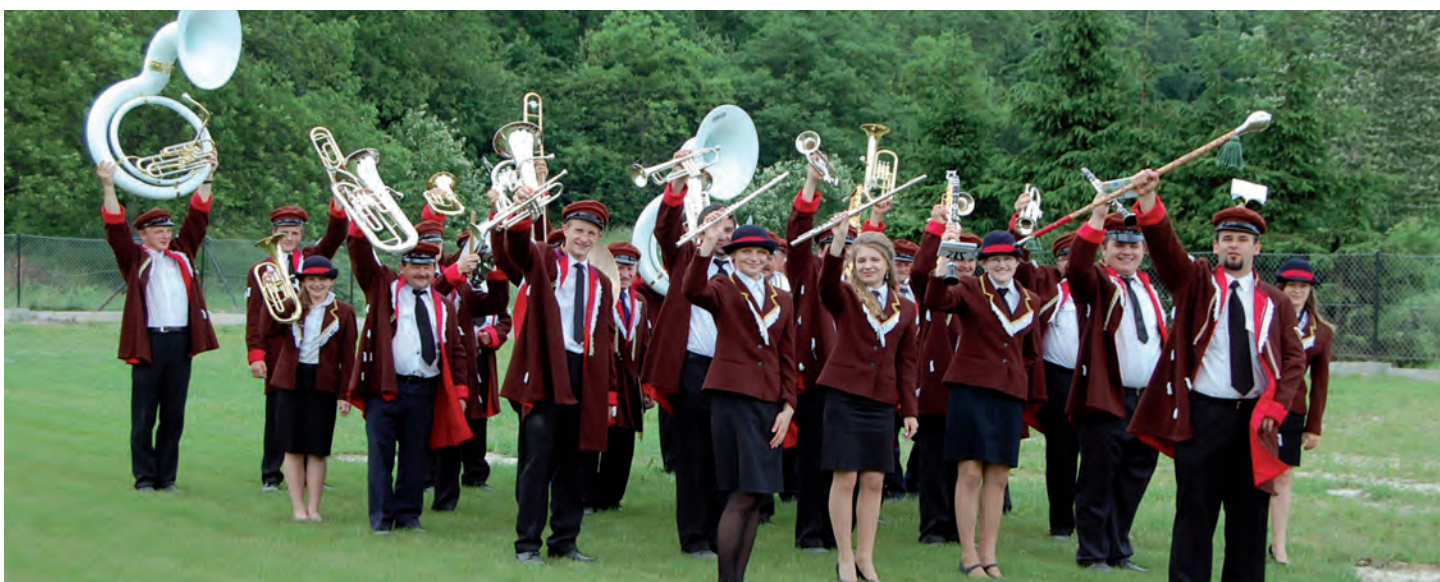
W ramach projektu Orkiestrze Dętej z Grodziska Dolnego zakupiono nowe stroje i instrumenty. Wartość zadania 145 951 zł