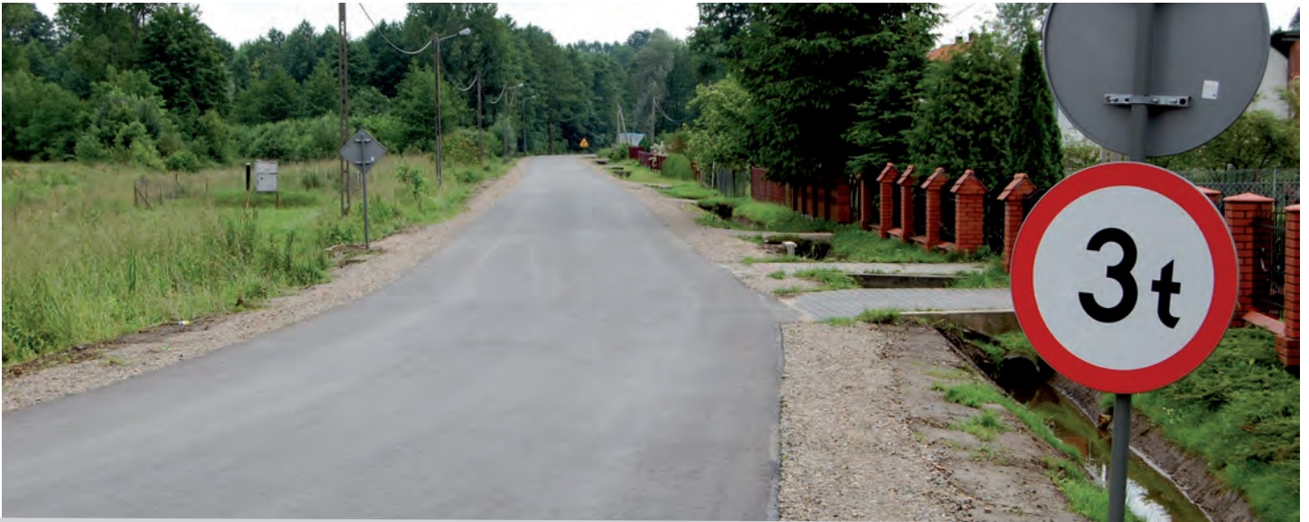
Odremontowana droga gminna tzw. Mokrzanek". Wartość inwestycji: 676 tys. zł. Wykonawca: Firma SKANSKA oddział Rzeszów