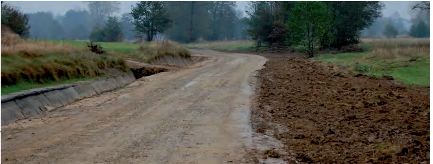
Droga do gruntów rolnych, tzw. Pastewnik w Grodzisku Dolnym. Wartość zadania 163 tys. zł Wykonawca: SUDR w Grodzisku Dolnym