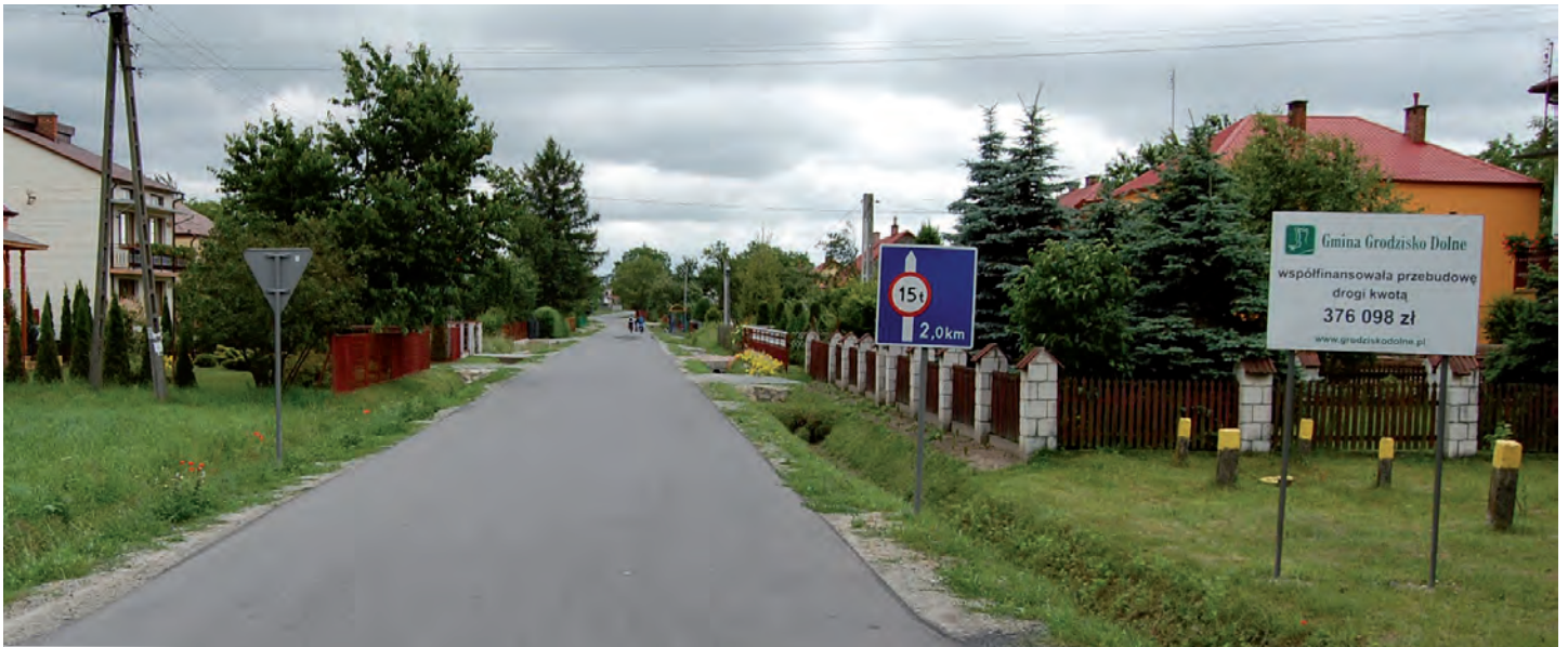
Wyremontowana droga powiatowa Grodzisko Nowe-Chodaczów-Tryńcza. Wartość dofinansowania Gminy Grodzisko Dolne 376 tys. zł. Wykonawca: Jarosławskie Przedsiębiorstwo Robót Drogowo-Mostowych S.A