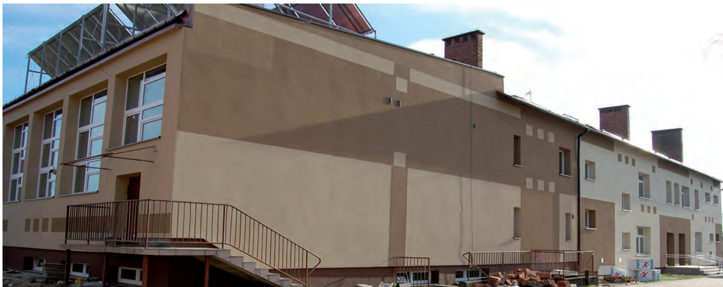
Nowa elewacja na budynku Szkoły Podstawowej w Laszczynach. W obiekcie mieści się siedziba ORW. Wartość inwestycji 325 tys. zł. Wykonawca: Firma APEX z Leżajska