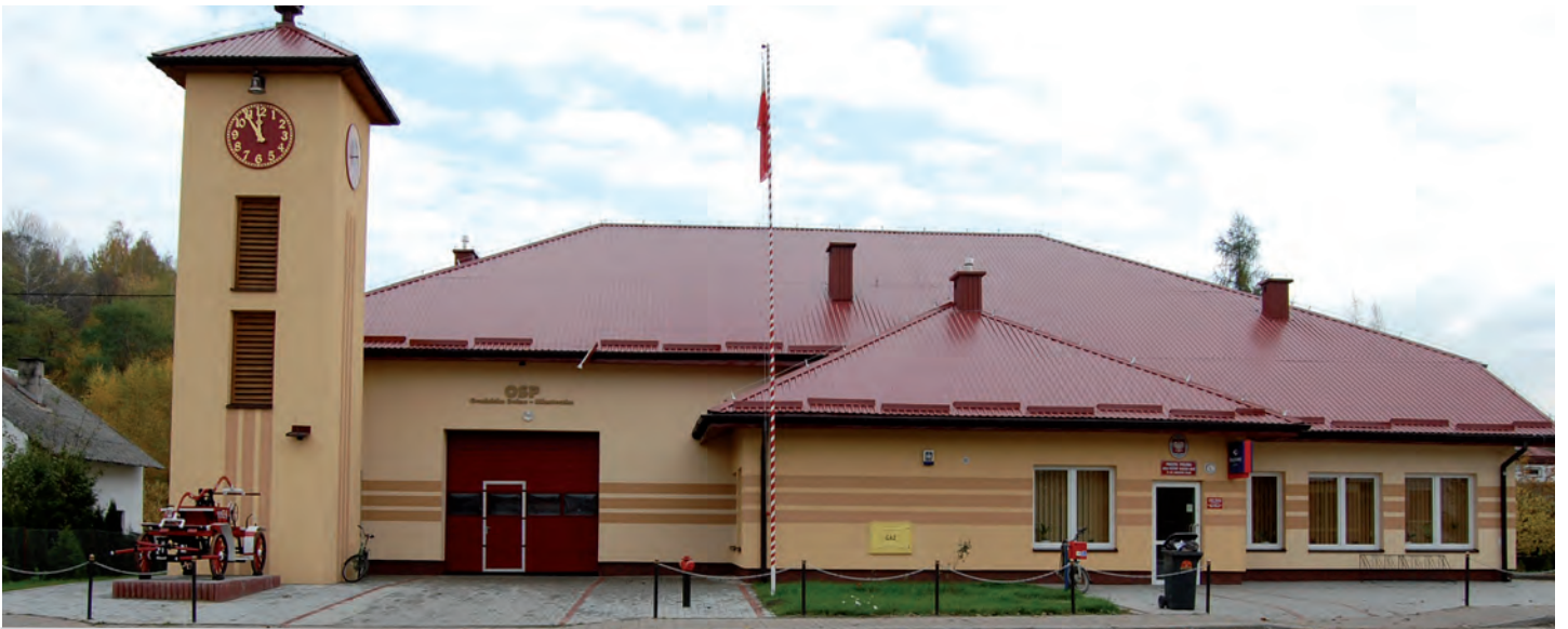
Zmodernizowany obiekt OSP w Grodzisku Dolnym Miasteczku. Wartość inwestycji 638 tys. zł. Wykonawca: Firma APEX z Leżajska