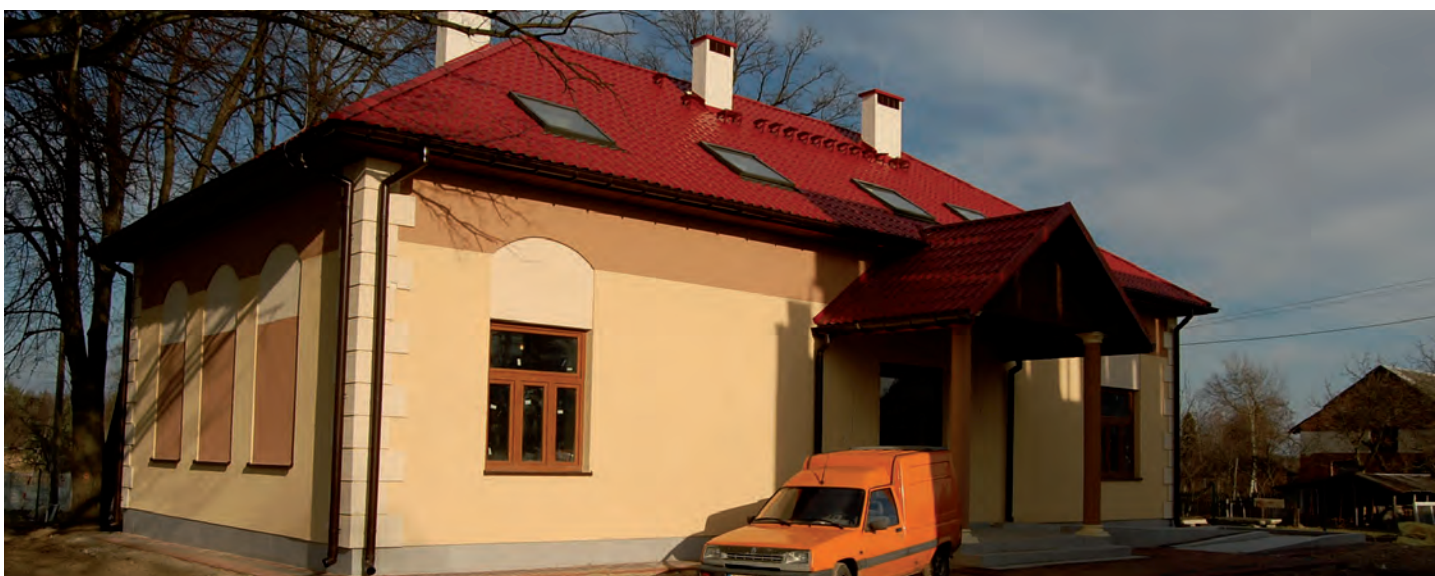
Na potrzeby ORW prowadzonego przez Stowarzyszenie Rodziców Dzieci Niepełnosprawnych w Grodzisku Dolnym modernizowany jest budynek starej szkoły w Laszczynach. Inwestycję prowadzi Stowarzyszenie. Wartość inwestycji 1 006 055 zł.