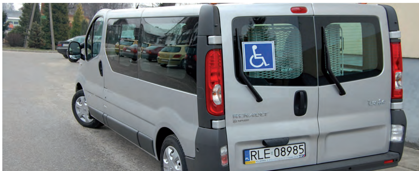
Pozyskany samochód do przewozu podopiecznych Środowiskowego Domu Samopomocy w Laszczynach. Wartość inwestycji: 128 tys. zł