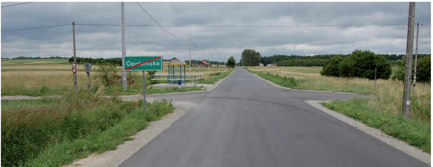
Nowa nawierzchnia na drodze powiatowej Grodzisko Dolne-Opaleniska-Zmysłówka. Wartość dofinansowania Gminy Grodzisko Dolne 998 tys. zł. Wykonawca: Jarosławskie Przedsiębiorstwo Robót Drogowo-Mostowych S.A