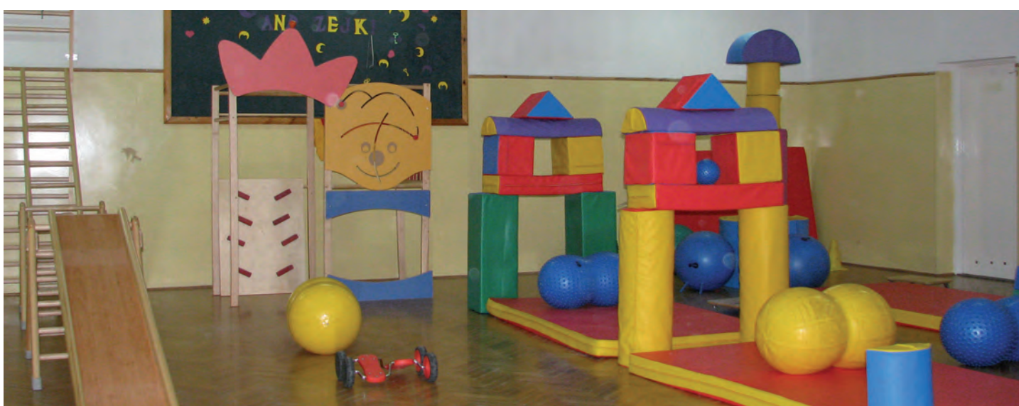
Dla najmłodszych stworzono odpowiednio wyposażone miejsca do zabaw. Wartość inwestycji ponad 39 tys. zł Projekty zrealizowano w ramach programu „Radosna Szkoła”