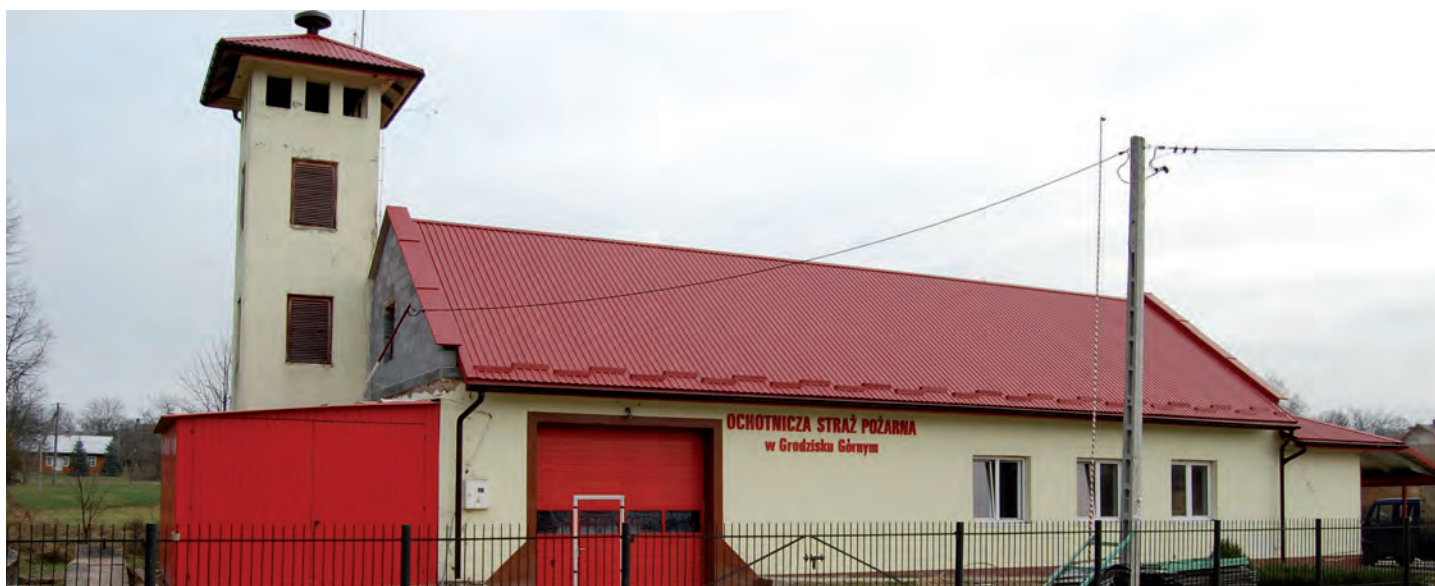
Remiza OSP w Grodzisku Górnym w trakcie modernizacji. Wartość inwestycji 293 tys. zł. Wykonawca: Firma FACHBUD z Przeworska, Zakład Gospodarki Komunalnej w Grodzisku Dolnym