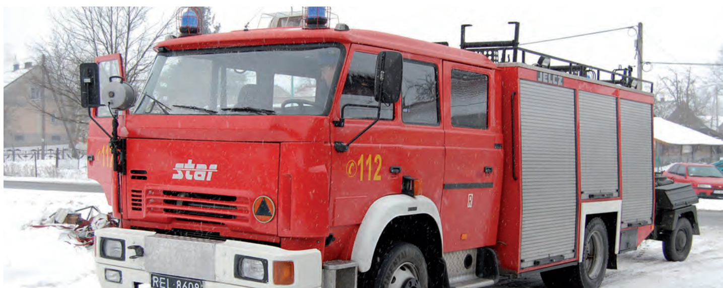
Pozyskany samochód dla jednostki OSP w Grodzisku Górnym. Wartość księgową 332 tys. zł. Samochód przekazała Komenda Powiatowa PSP w Leżajsku