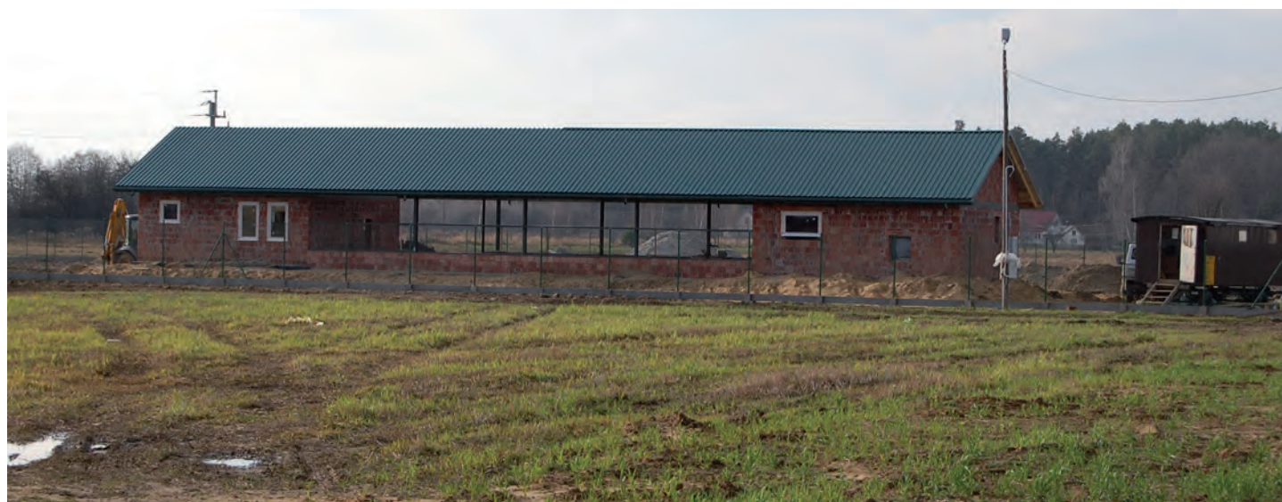
W Chodaczowie powstaje oczyszczalnia ścieków. Wartość inwestycji 10,5 mln. Wykonawca: Konsorcjum Pol-Aqua z Piaseczna