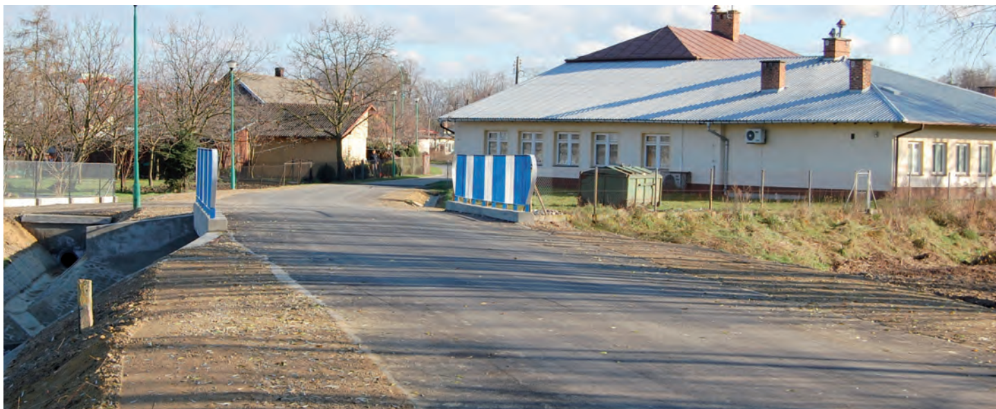
Przebudowany most koło remizy OSP w Grodzisku Dolnym. Wartość inwestycji 274 576 tys. zł. Wykonawca: SUDR w Grodzisku Dolnym