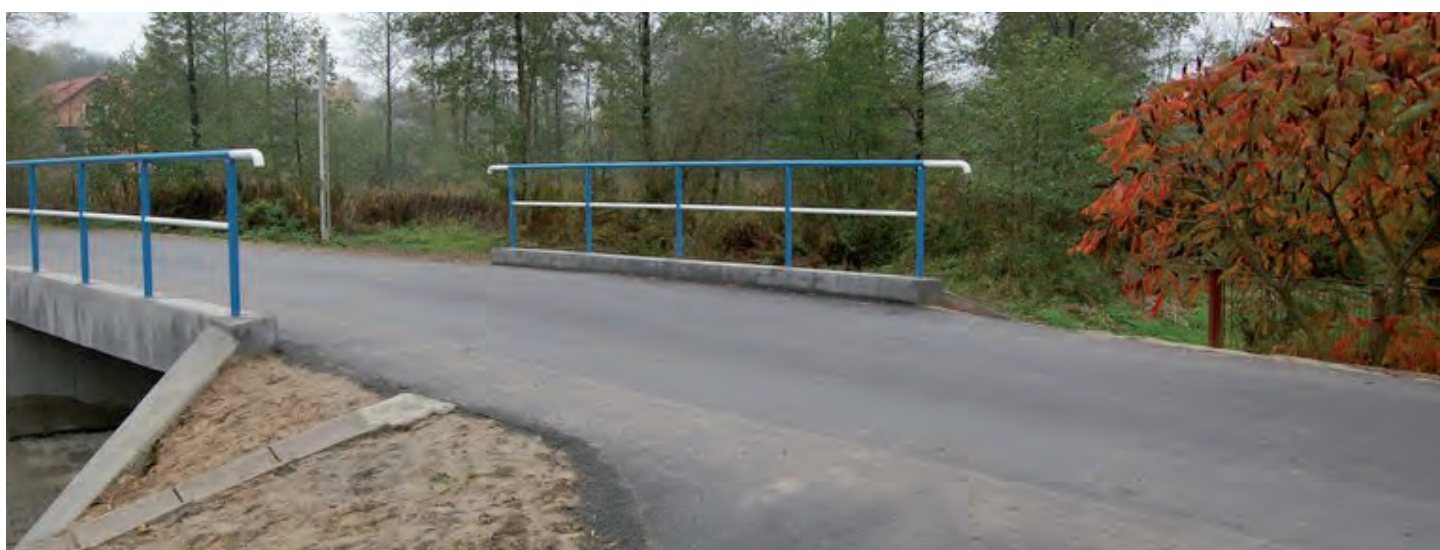
Przebudowany most koło Rydzika w Grodzisku Dolnym. Wartość inwestycji 109 tys. zł. Wykonawca: SUDR w Grodzisku Dolnym