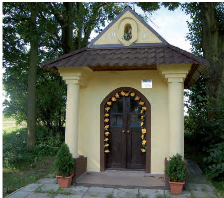
W ramach projektu „Grodziskie kapliczki” renowacji poddano 5 grodziskich kapliczek