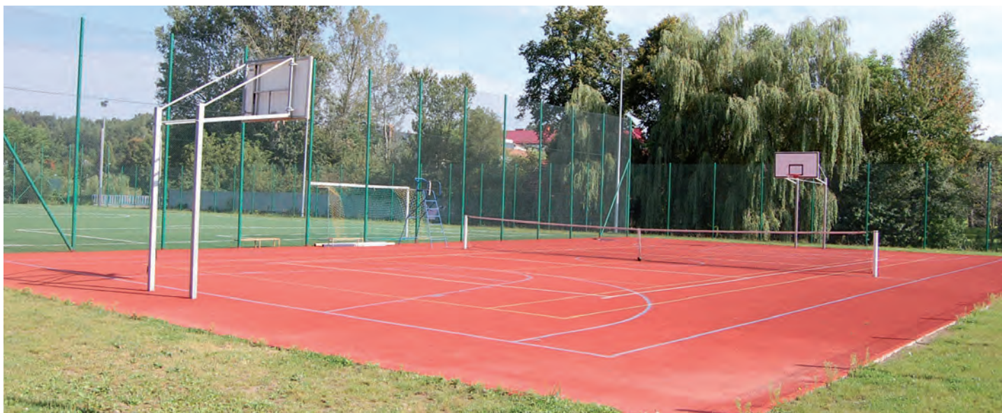
Przy Zespole Szkół w Grodzisku Dolnym wybudowano „Orlika”. Wartość inwestycji 1 200 tys. zł. Wykonawca: Firma KOREM z Jeżowego