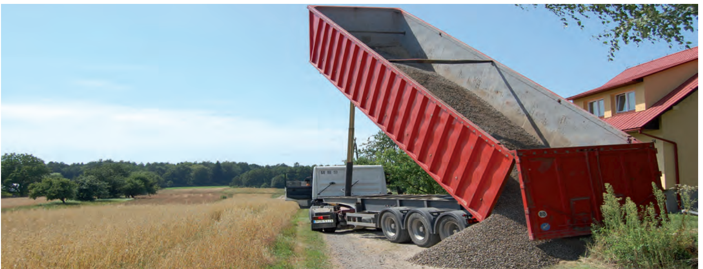
W 2010 roku z funduszu sołeckiego na drogach gminnych rozłożono ponad 1500 ton kamienia. Kamień trafił na drogi z inicjatywy mieszkańców