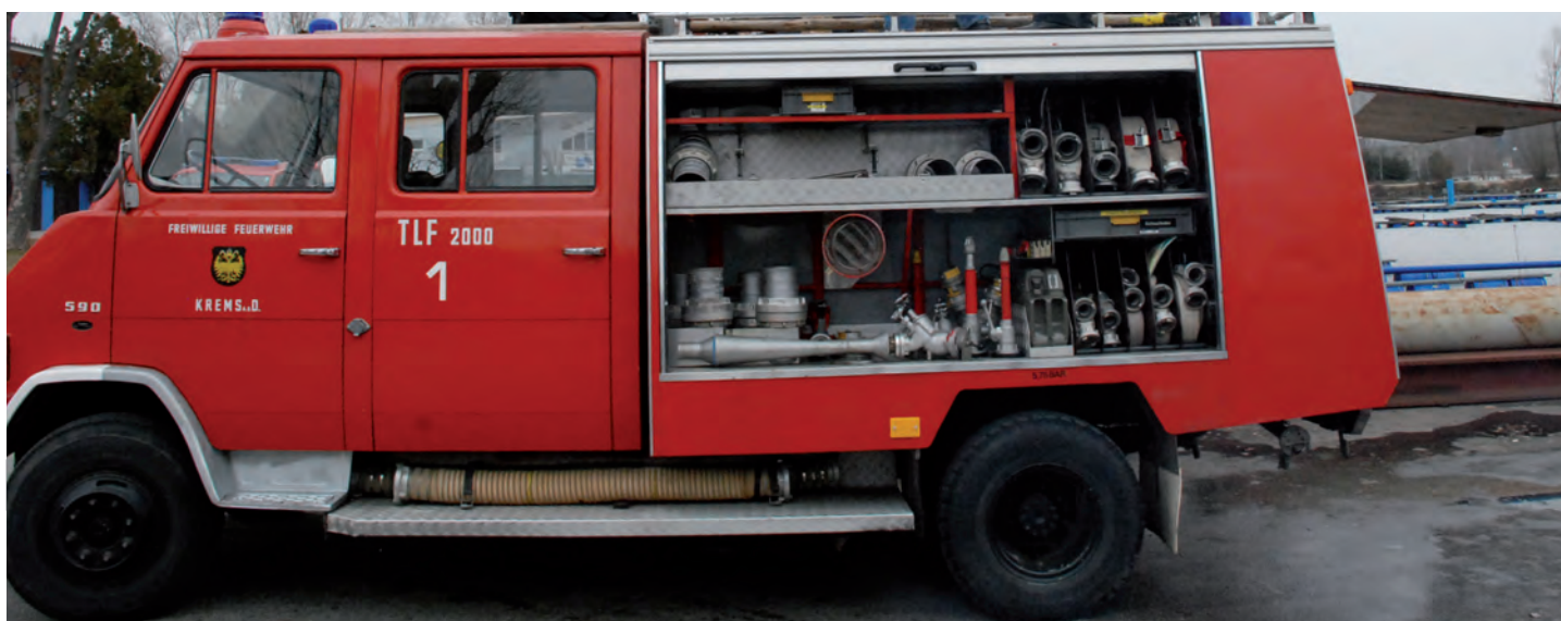
Pozyskany przez jednostkę z Krems (Austria) samochód dla jednostki OSP w Laszczynach. Koszt zakupu 31 tys. zł.