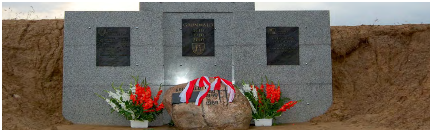
Pamiętkowa tablica przy Krzyżu Grunwaldu