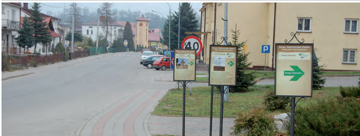
W tym roku wykonano pierwszy etap szlaku turystycznego pieszego „Wielkie Grodzisko”. Ścieżka wiedzie od zbiornika wodnego „Czyste”, wzdłuż dogi powiatowej do Grodziska Górnego. W roku przyszłym powstanie drugi etap szlaku, w kierunku Wólki Grodziskiej. Wartość inwestycji 367 721 zł. Wykonawca: Firma DRO-BRUK z Gniewczyny Trynieckiej