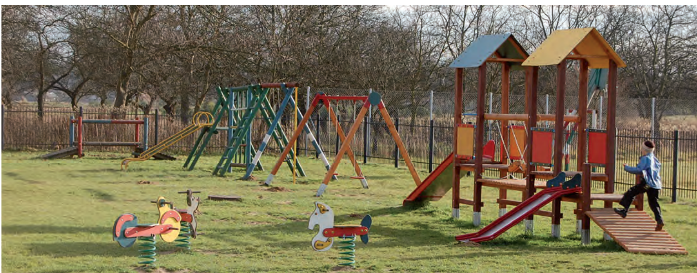
Przy szkołach samorządowych utworzono place zabaw. Wartość inwestycji 159 tys. zł. Projekt zrealizowano w ramach POKL