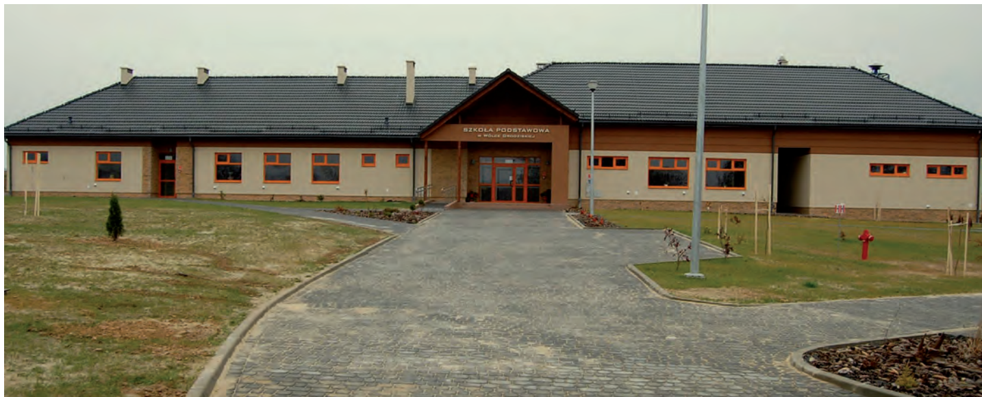
Nowy budynek Społecznej Szkoły Podstawowej oraz Remizy OSP w Wólce Grodziskiej. Wartość inwestycji 4,5 mln. Wykonawca: Firma KOREM z Jeżowego