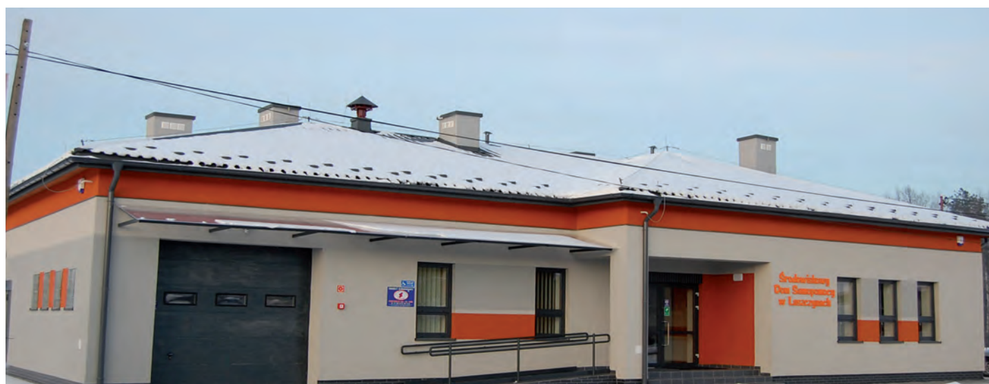
W Laszczynach powstał Środowiskowy Dom Samopomocy. Wartość inwestycji 950 tys. zł. Wykonawca: Firma EURO OKNA-PLUS z Sieniawy