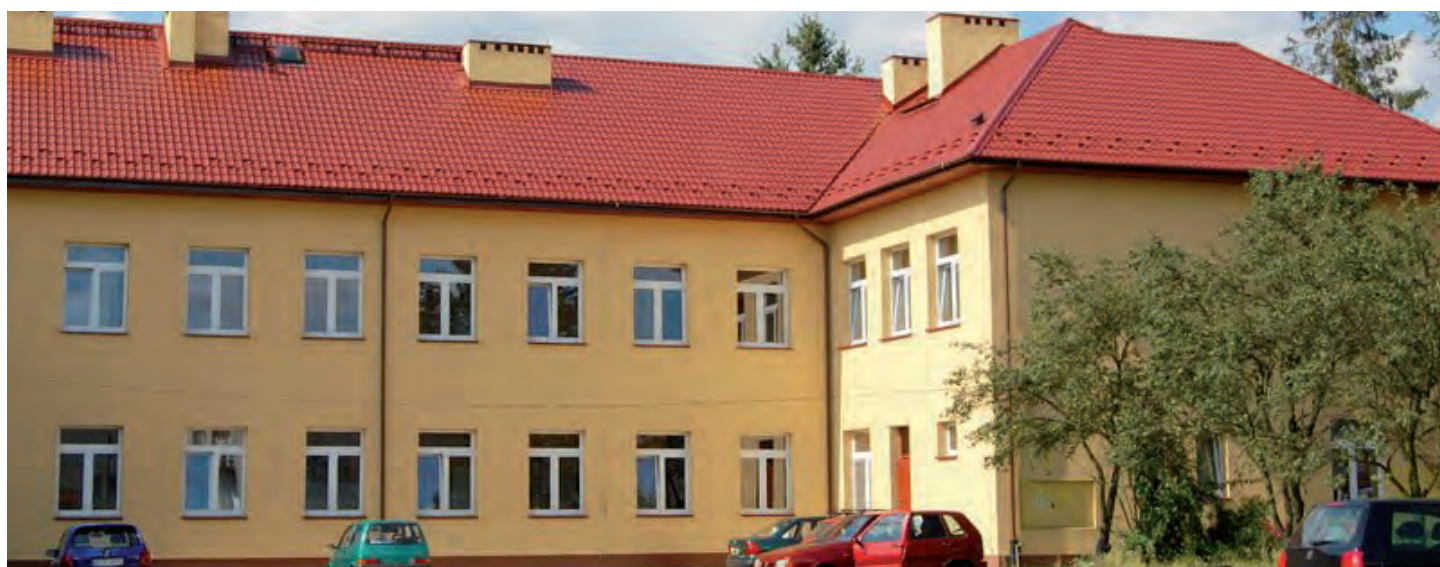
Odremonowany dach na Zespole Szkół w Grodzisku Górnym. Wartość inwestycji 442 tys. zł. Wykonawca: Firma budowlana Krzysztof Pytel