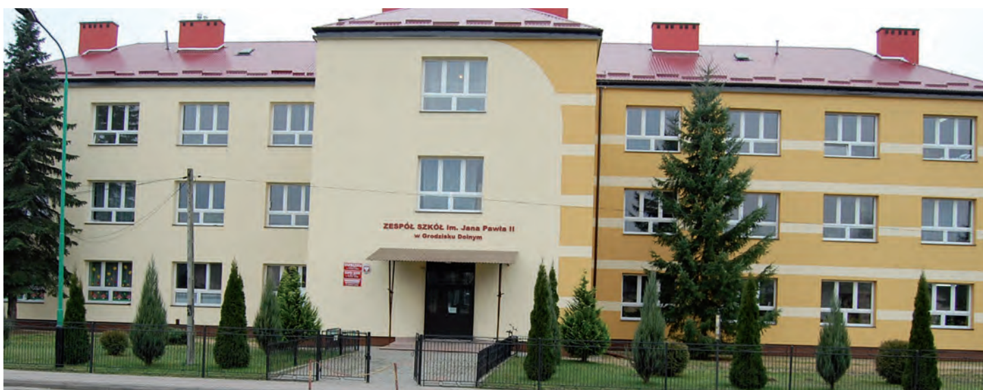
Nowa elewacja na Zespole Szkół w Grodzisku Dolnym. Wartość inwestycji 235 347 tys. zł. Wykonawca: Firma APEX z Leżajska