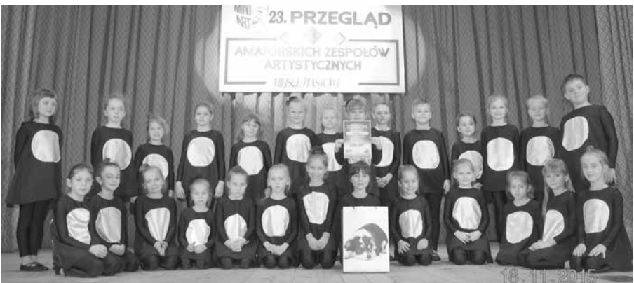
Zespół Kleks, gr. V

Na 23 Przeglądzie MINI-ART w Miejscu Piastowym grupa V Dziecięco - Młodzieżowego Zespołu Tanecznego Kleks otrzymała nagrodę główną w kategorii wiekowej 7-14 lat za choreografię „Ostre cięcie”.