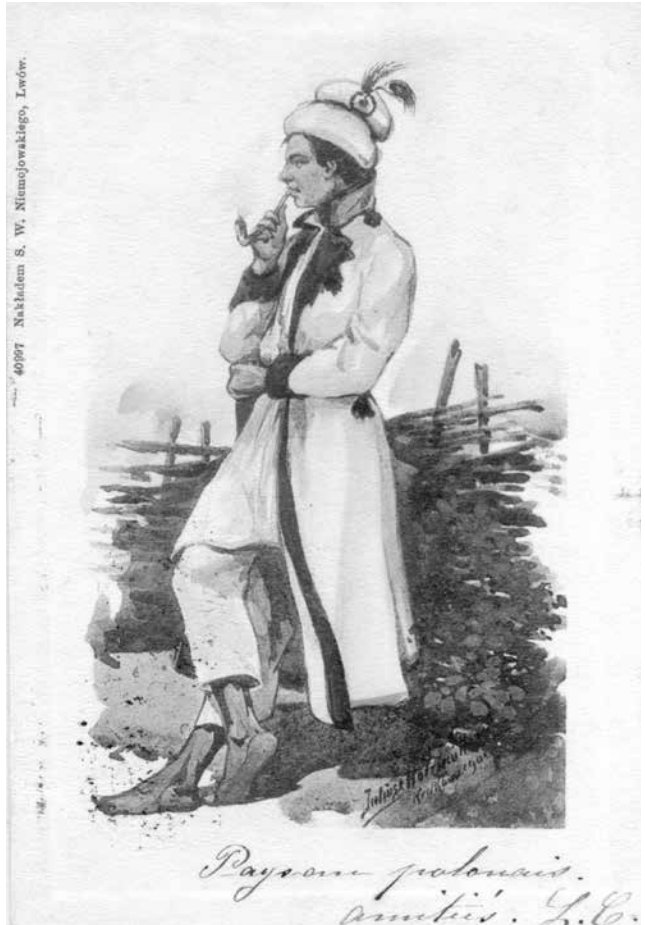
Seria: FOLKLOR, akwarela z roku 1901. Mężczyzna w stroju ludowym, autor nie podaje z jakiej miejscowości był model. Nakładem S.W. Niemojewskiego, Lwów.

Zbigniew Więcek pocztówki ze zbiorów autora