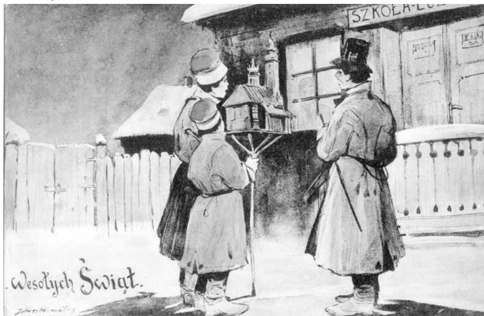
Seria: ŚWIĄTECZNE, akwarela. Kolednicy przed Szkołą Ludową. Pocztówka wydana przez sal. mal. pol. Kraków 1907.