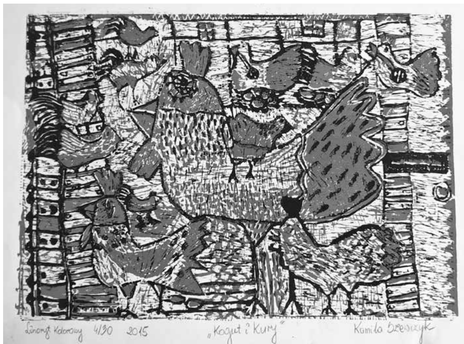
„Kogut i kury”, linoryt kolorowy, Kamila Szewczyk SP Dobkowice