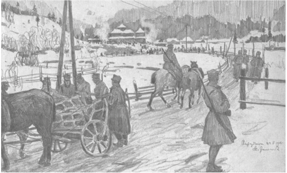
Stanisław Janowski „Podczas bitwy w Rafajłowej” - kartka pocztowa, reprodukcja rysunku z 1915 r.

czą Legionów. Nazwa ta utrwaliła się, weszła do nazewnictwa kartograficznego i zachowała się do dnia dzisiejszego. Nazwę „Rafajłowa” można odnaleźć jedynie w dawnych publikacjach historycznych oraz krajoznawczych, na przedwojennych mapach czy w pamięci nielicznych już osób. Pierwsi legionowi żołnierze dotarli tam 11 października 1914 r., by w dniu następnym stoczyć zwycięską potyczkę ze stacjonującym we wsi rosyjskim oddziałem. Dzień później do Rafajłowej przybył kpt. Józef Haller, dowódca 3. Pułku Legionów w sile dwóch kompanii, a niedługo potem inne, podległe mu oddziały. Po bitwie stoczonej 29 października 1914 r. pod Mołotkowem znalazły się tam także inne bataliony Legionu Polskiego (jak wtedy często określano Legiony Polskie). Po odejściu części oddziałów z Rafajłowej w listopadzie 1914 r. na Huculszczyznę pozostało w niej niespełna