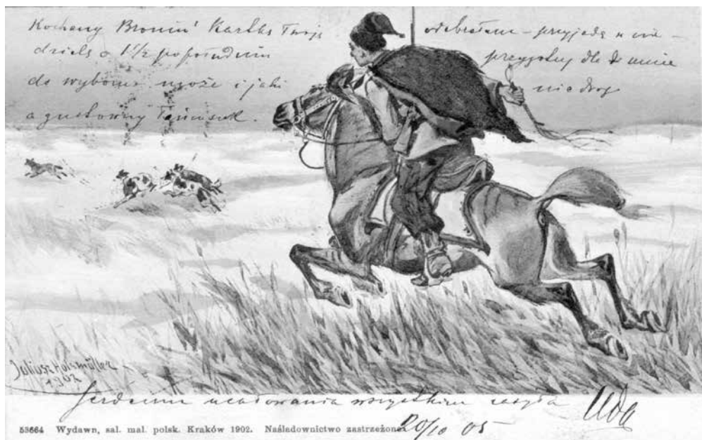
Seria: POLOWANIE, akwarela z roku 1902. Myśliwy na koniu i psy gończe. Pocztówka wydana przez sal. mal. pol. Kraków 1902.