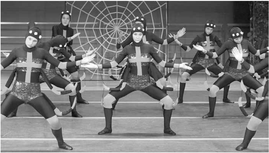
ZTW Strecz

obydwie grupy ZTW Strecz zdobyły wyróżnienia I stopnia - grupa II w kategorii teatr tańca pow. 15 lat, a grupa I w kategorii etiuda taneczna pow. 15 lat.