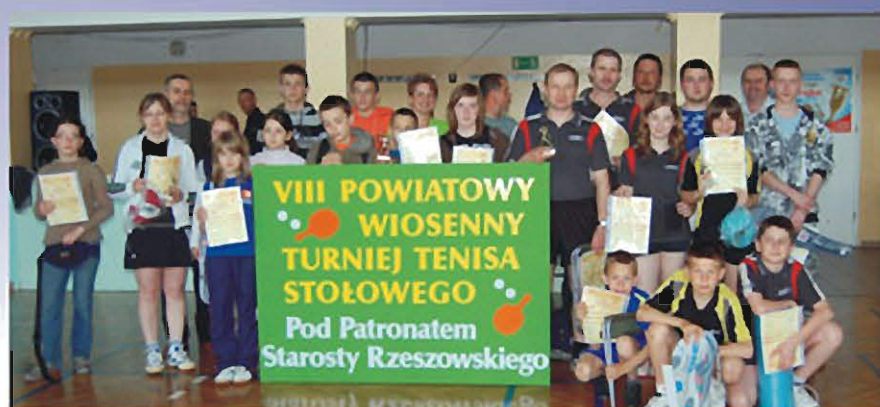
SOKOŁÓW MŁP., 26 KWIETNIA 2009 r. Powiatowy Turniej Tenisa Stołowego.