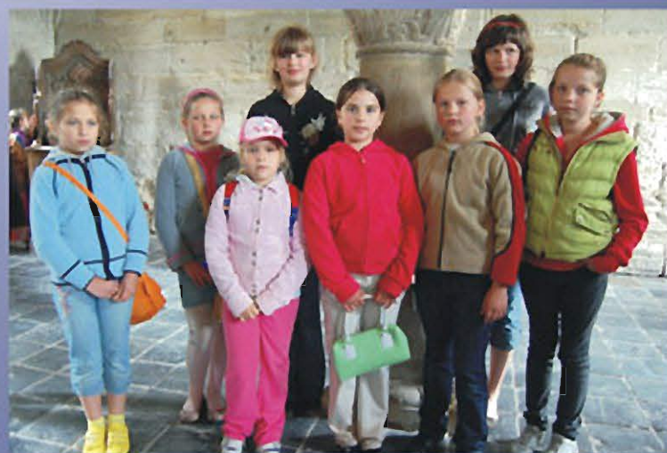
SOKOŁÓW MŁP., 13 CZERWCA 2009 r. Plener Malarski „WIATRAKI 2009” - „U Cystersów w Koprzywnicy”.