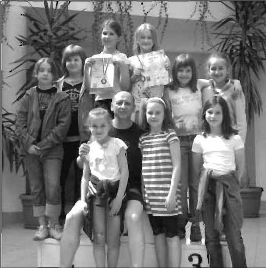
Pamiątkowe zdjęcie uczestników zawodów.

W dniu 30 kwietnia 2009 roku na pływalni krytej w Łańcutie rozegrano zawody w pływaniu. Wśród zaproszonych sekcji pływackich m.in. z Nowej Sarzyny, również sekcja pływacka