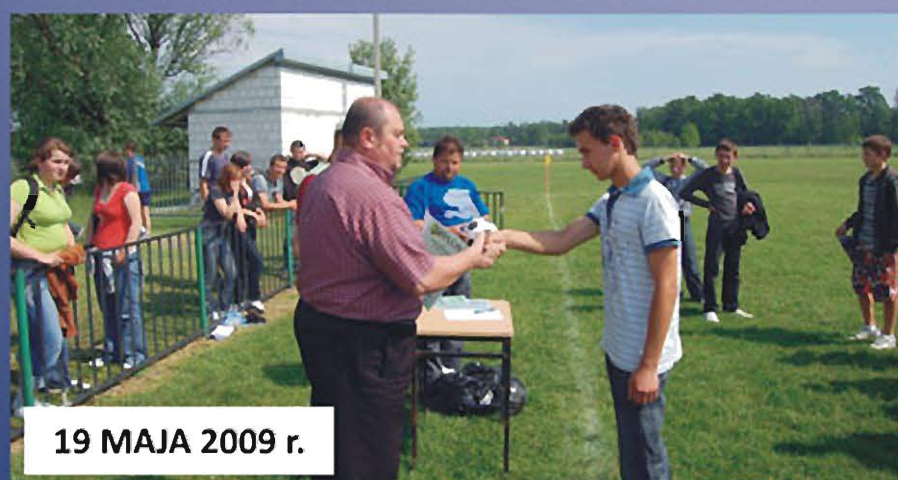
19 MAJA 2009 r.