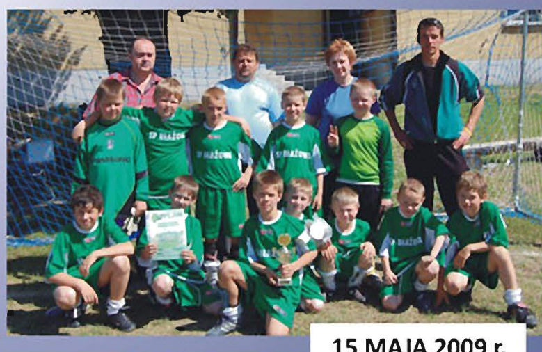
15 MAJA 2009 r.