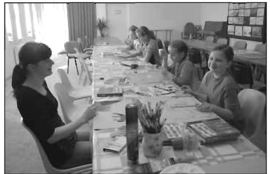
Podczas zajęć plastycznych w Sokołowie.