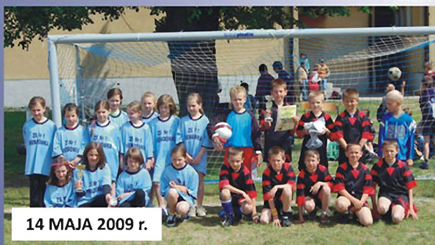
14 MAJA 2009 r.