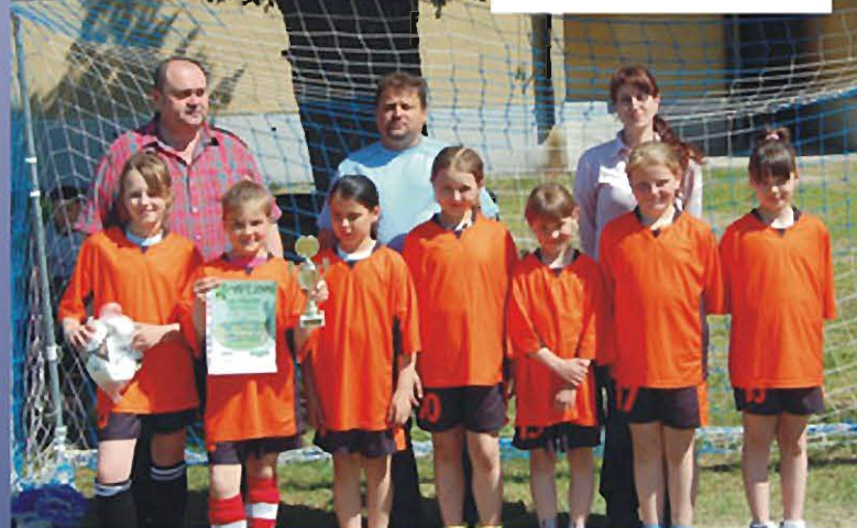
PIŁKA NOŻNA DZIEWCZĄT I CHŁOPCÓW „Z PODWÓRKA NA STADION”