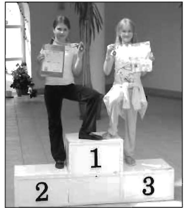
Medalistki zawodów pływackich.