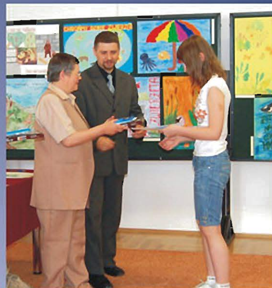
SOKOŁÓW MŁP., 30 KWIETNIA 2009 r. Podsumowanie IX Powiatowego Konkursu Twórczości Plastycznej Dzieci i Młodzieży „ZIEMIA - NASZ DOM”.