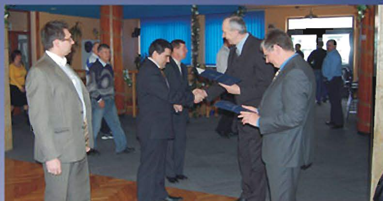
SOKOŁÓW MŁP., 20 KWIETNIA 2009 r. Podsumowanie XI Edycji Współzawodnictwa Gmin Wiejskich w Sporcie Młodzieżowym.