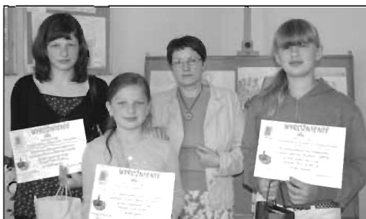
Na wystawie poplenerowej.

Zabytkowy kościół i plebania w Koprzywnicy.