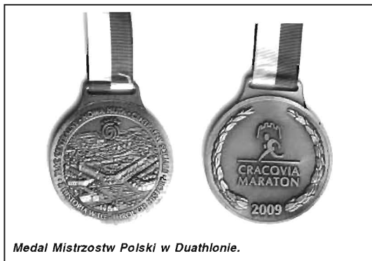
Medal Mistrzostw Polski w Duathlonie.