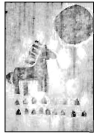
„Księżyc i koń” – Marta Nykiel.