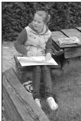
Młodzi artyści przy pracy.