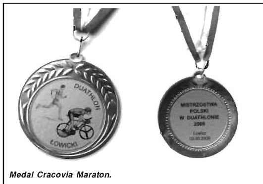
Medal Cracovia Maraton.