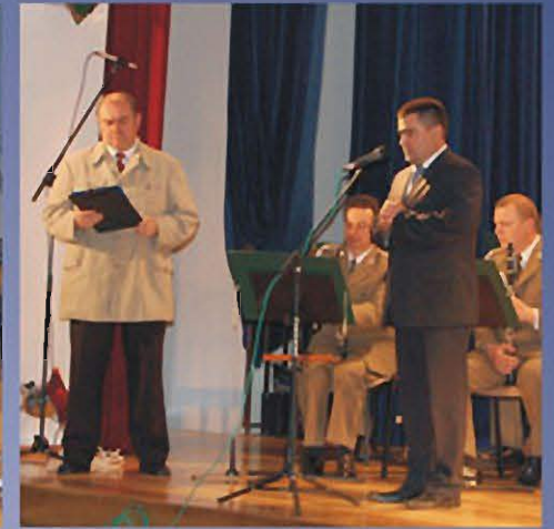
SOKOŁÓW MŁP., 10 MAJA 2009 r. Koncert Orkiestry Garnizonowej w MGOKSiR.