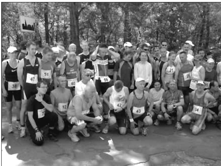
Pamiętkowe zdjęcie wszystkich uczestników duathlonu.