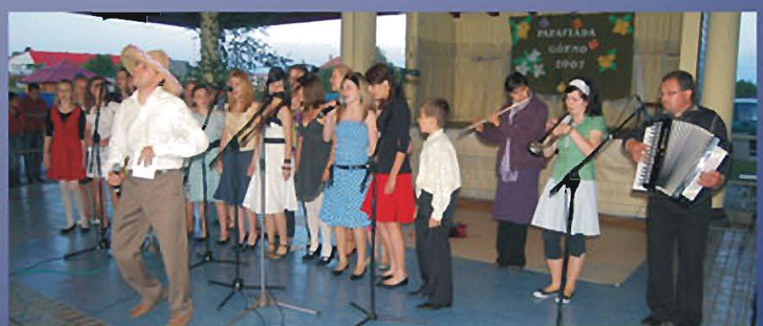
GÓRNO, 31 MAJA 2009 r. IX Parafiada.