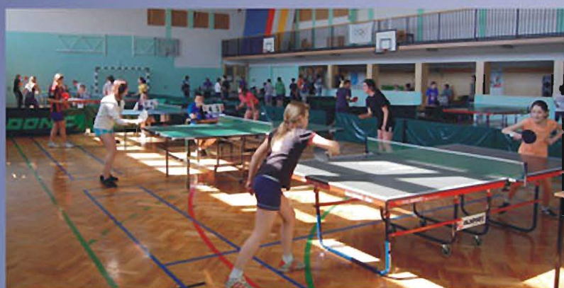
SOKOŁÓW MŁP., 25 KWIETNIA 2009 r. Miejsko-Gminny Turniej Tenisa Stołowego.