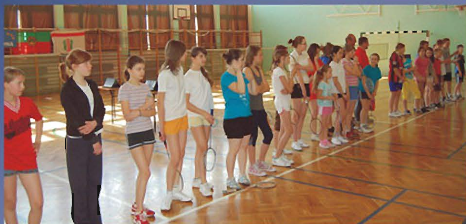
SOKOŁÓW MŁP., 18 KWIETNIA 2009 r. I Powiatowy Turniej Badmintonu.