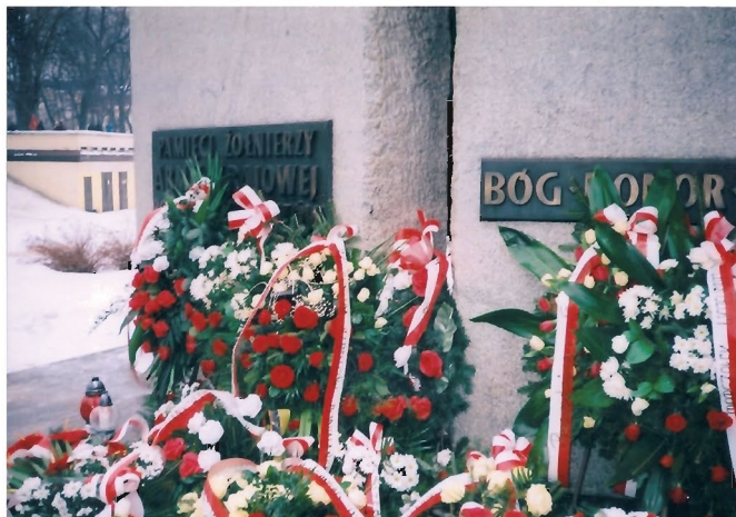
(Ciąg dalszy na str. 16)

z Centrum Sztuki Wokalnej w Rzeszowie. Następnie po ciepłym posiłku, członkowie Kół AK zostali przewiezieni do kościoła św. Krzyża na ul. 3 Maja. Reszta uczestników spotkania udała się pieszo, grupa młodzieży (ponad 30 osób) niesła w ręku biało-czerwone chorągiewki. Głównym celebrazem msz. św. był ksiądz biskup Kazimierz Górny , który wygłosił płomienne religijno-patriotyczne kazanie nagrodzone długimi brawami. Po mszy wszyscy udali się pod pomnik na ulicę Szopena. Tu wywieszono flagę, następnie przy dźwiękach orkiestry wojskowej odśpiewano hymn narodowy. Po apelu i salwie