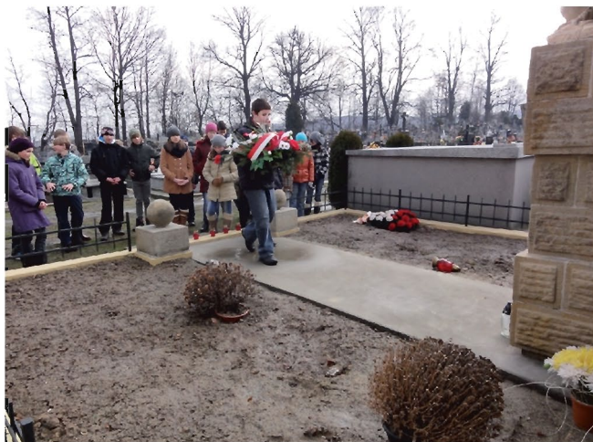
Uroczyste złożenie kwiatów.

W 1995 roku z inicjatywy Światowego Związku Żołnierzy