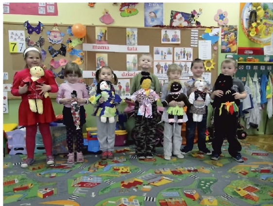
Dzieci prezentują własnoręcznie wykonane laleczki

Dzięki zaangażowaniu uczniów i ich rodziców powstało 65 pięknych, niepowtarzalnych laleczek . Każda miała swoje imię, kraj z którego pochodzi i jakieś hobby. Laleczki zostały zlicytowane 22 stycznia 2012 r. w Domu Ludowym