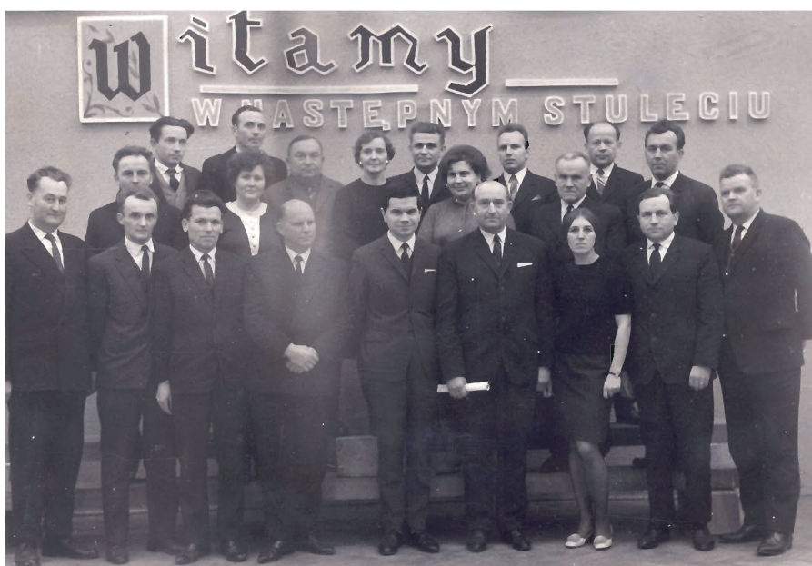
Organizatorzy Jubileuszowych Obchodów