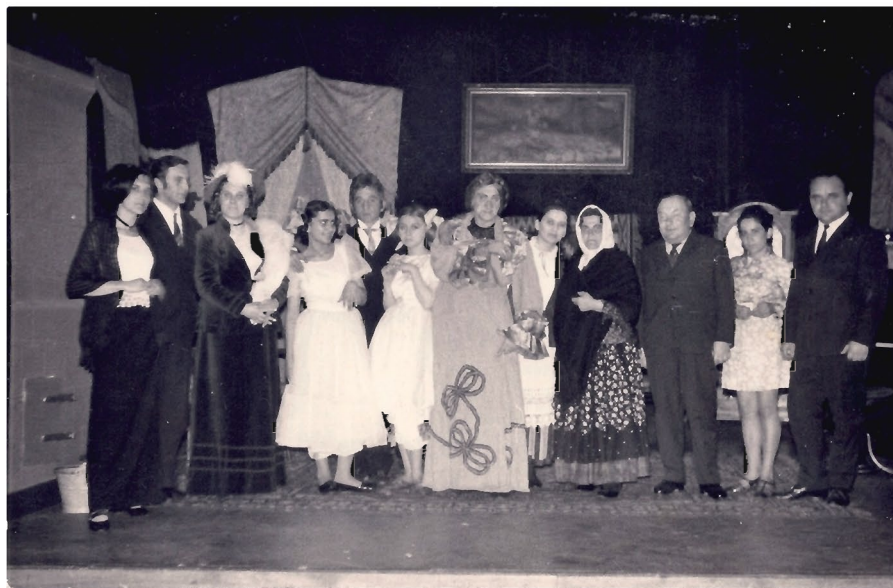
Wykonawcy i reżyser przedstawienia Moralność Pani Dulskiej