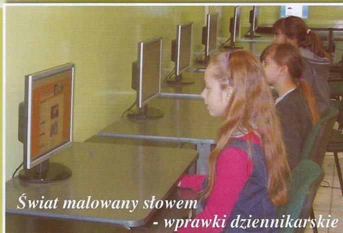
Świat malowany słowem - wprawki dziennikarskie