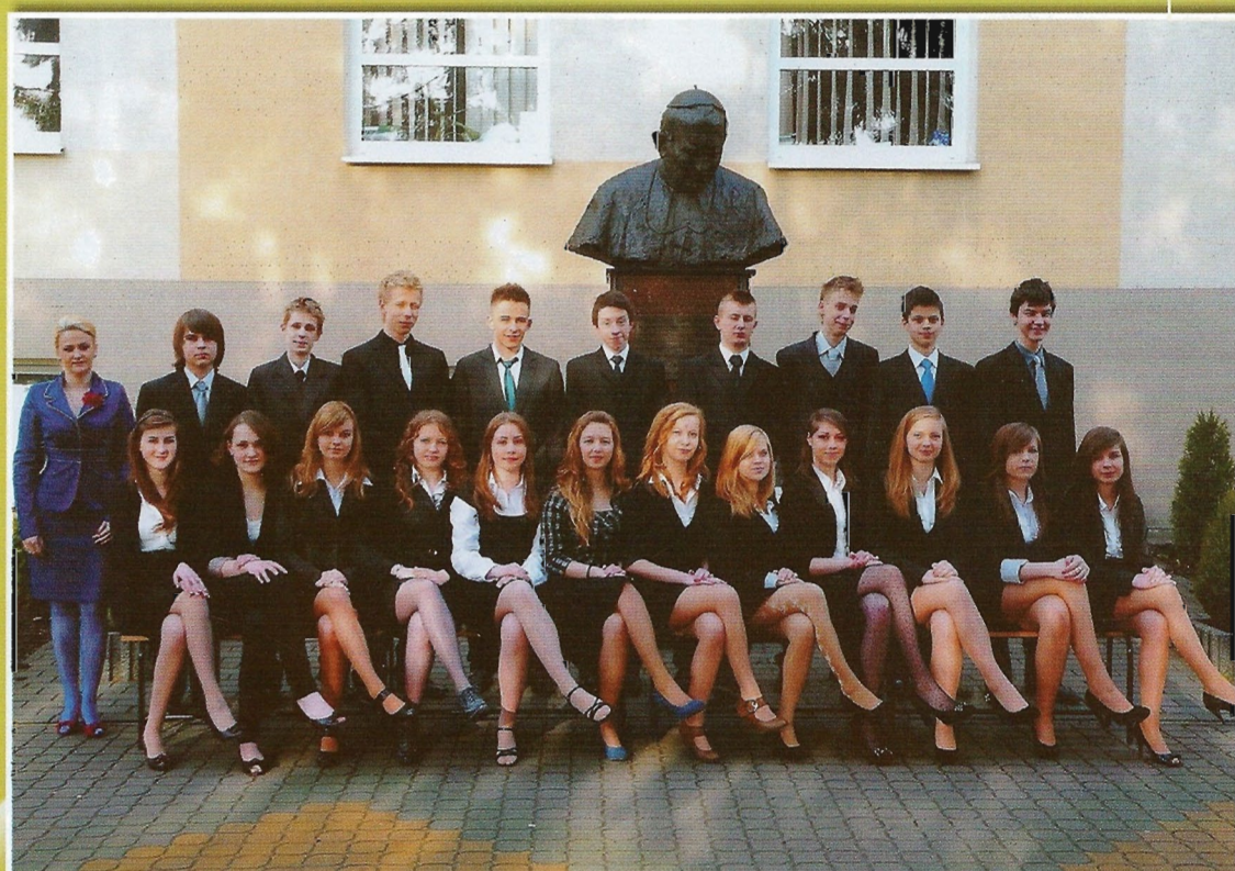
Klasa III F