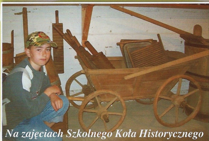
Na zajęciach Szkolnego Koła Historycznego