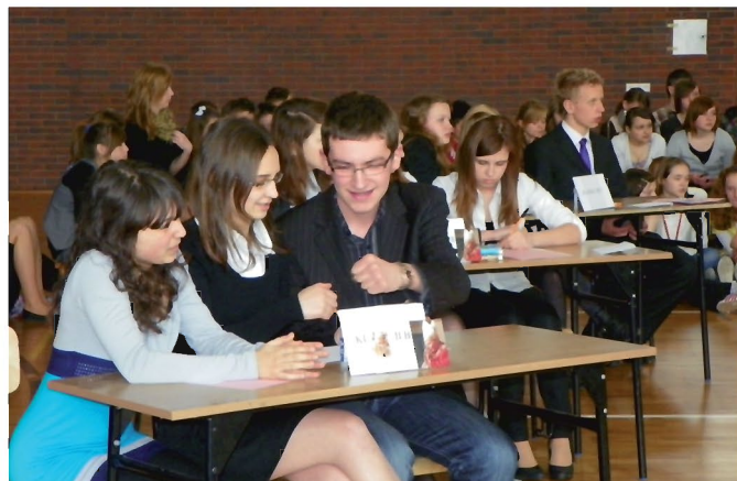
Uczniowie kl. II b - zwycięzcy konkursu

Wszystkim uczestnikom serdecznie gratuluję wiedzy, jaką zaprezentowali w tegorocznym konkursie.