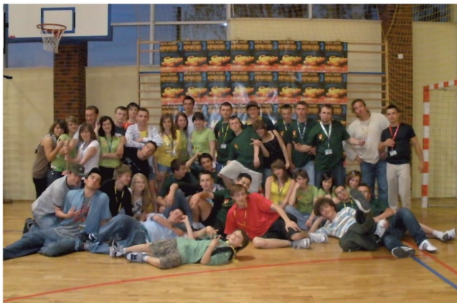
Organizatorzy turnieju tańca break dance EPIZOD III

Spotykamy się w każdy piątek o godzinie 19:00 w biurze ZMW, ul. Św. Krzyża 4/203 w Tyczynie.