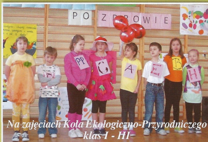
Na zajęciach Koła Ekologiczno-Przyrodniczego klas I - III