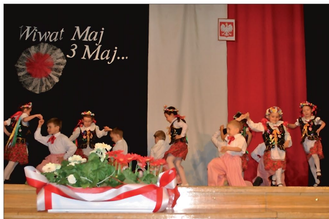
Krakowiak w wykonaniu dzieci z Przedszkola Sióstr Św. Dominika