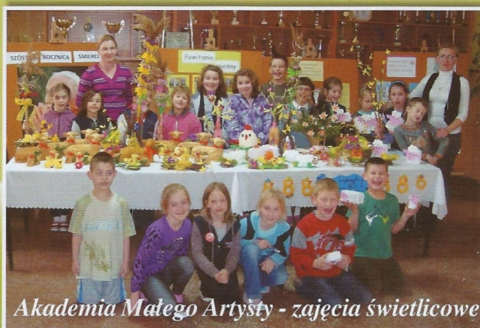
Akademia Małego Artysty - zajęcia świetlicowe