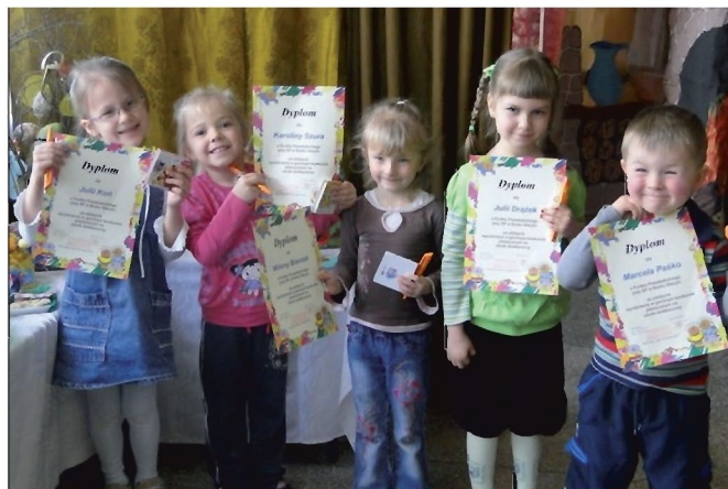
Dzieci z przedszkola SP w Borku St. prezentują pamiątkowe dyplomy