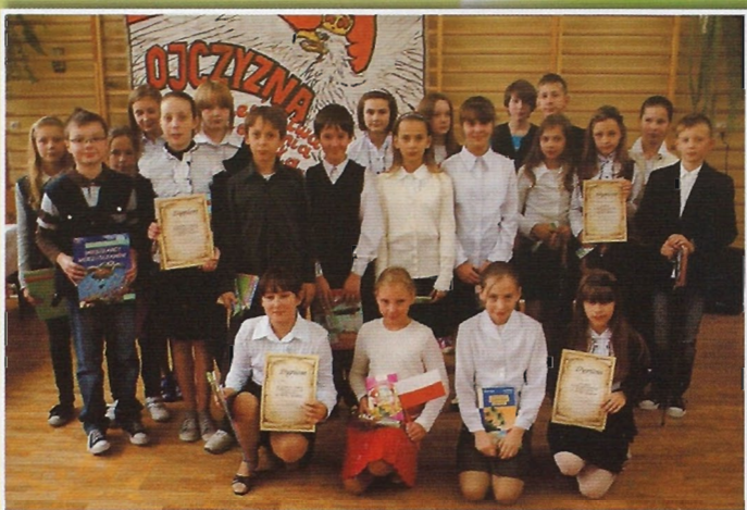
Uczestnicy konkursu recytatorskiego „Strofy o Ojczyźnie” zorganizowanego przez Samorząd Uczniowski