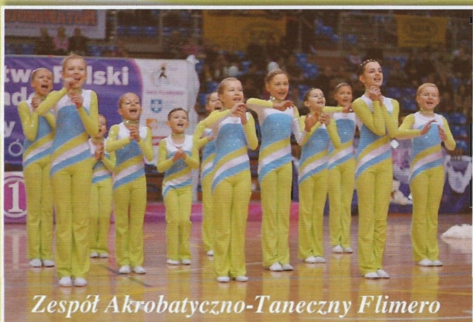
Zespół Akrobatyczno-Taneczny Flimero