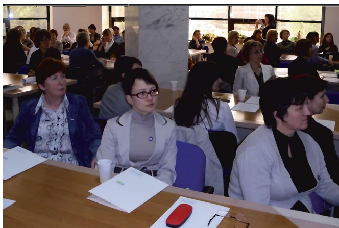
Bibliotekarze MiGBP w Tyczynie oraz Filii w Kielnarowej, uczestniczący w konferencji podsumowującej PRB

Dzięki grantowi (1 tys. zł.) Podaj dalej , finansowanemu przez Akademię Rozwoju Filantropii w Polsce, MiGBP w Tyczynie zorganizowała cztery szkolenia dla swoich bibliotek partnerskich (Chmielnik, Boguchwała, Lubenia). Dzięki nim mogłyśmy podzielić się z koleżankami wiedzą zdobytą na szkoleniach podstawowych.