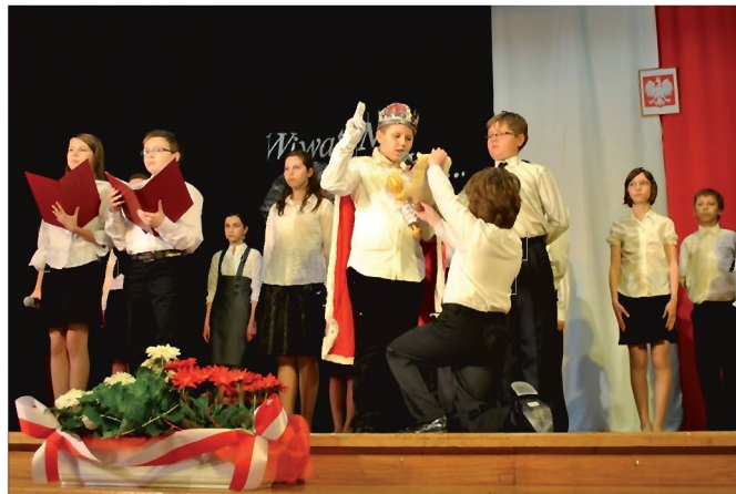
Montaż słowno-muzyczny w wykonaniu uczniów Szkoły Podstawowej w Tyczynie