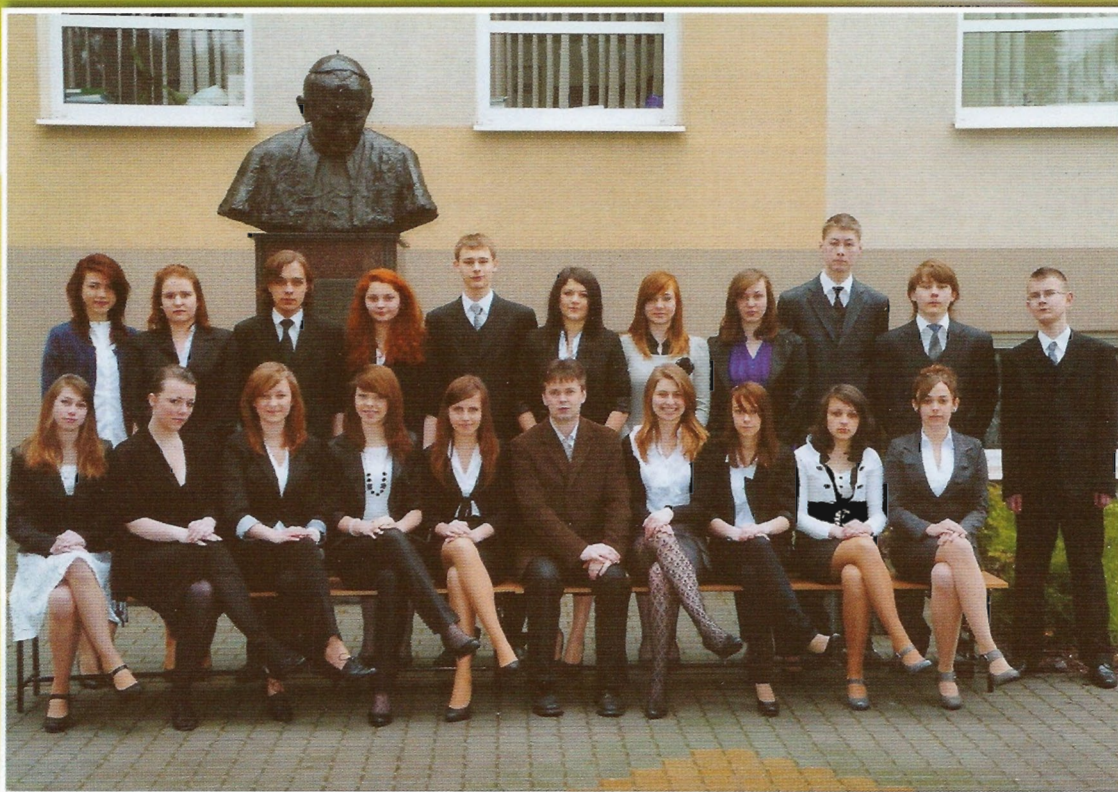
Klasa III E