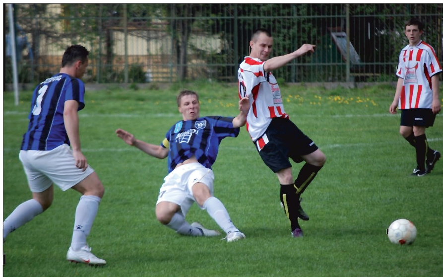
3:2 z Górnovią, to jak na razie jedyne wiosenne zwycięstwo Strugu

stał zabrany przez pogotowie. Wstępna diagnoza: zerwanie więzadeł kolanych. Z tego powodu mecz został przedłużony o 20 minut. Dziesięć minut później po raz kolejny przed szansą stanął Brocki, ale ubiegł go obrońca. Chwilę później w doskonałej sytuacji znalazł się Ciupak, ale zbyt długo zwlekał z oddaniem strzału. W końcówce spotkania lider stworzył optyczną przewagę na placu gry. 5 minut przed końcem do wyrównania doprowadził .Bąk, a 2 minuty później zwycięstwo Resovii dał Krawczyk. Strug SZiK Tyczyn 1-2 Resovia II Rzeszów.