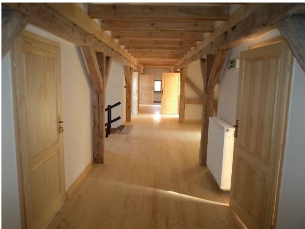
Wnętrze odrestaurowanego budynku dawnego Spichlerza