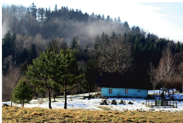
Jeden z pięknych widoków

Haczów - drewniany kościół zbudowany pod koniec XIV w. pw. Wniebowzięcia NMP. Świątynia ta jest największym kościołem drewnianym w stylu gotyckim w Europie,