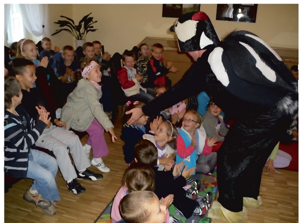
Oto jak bawiły się dzieci w Bibliotece w Tyczynie

W poniedziałkowy ranek 3 października br., Miejska i Gminna Biblioteka Publiczna w Tyczynie gościła aktorów ze Studia Art-Re z Krakowa . Na spotkanie z nimi zaproszone zostały dzieci z dwóch klas 0 z SP w Tyczynie. Podczas zajęć mali czytelnicy mieli okazję występować na scenie i razem z aktorami współtworzyć przedstawienie pt. Żabka i Bocian . Co było jego treścią? Hanusia, główna bohaterka spektaklu, poszukując przygód, oddała się od domu. W swej wędrówce spotyka przyjaciół: Biedronkę, Bociana i Dzięcioła. Bohaterka w ferworze zabawy gubi drogę do domu. Do poszukiwań lekomyślną Hanusi włączają się leśne ptaki i odwieczny wróg żab - Bocian. Okazuje się, że nawet najwięksi wrogowie mogą zostać przyjaciółmi. Każde z przedstawień w wykonaniu aktorów ze Studia Art-Re ma jakieś ważne przesłanie. Spektakl Żabka i Bocian uświadamia małym dzieciom konieczność niesienia pomocy słabszym i młodszym, a także uczy posłuszeństwa i szacunku względem rodziców. Nie jest to ostatnie spo-