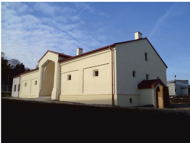
Budynek dawnego Spichlerza po remoncie

W związku z zaleceniami Wojewódzkiego Konserwatora Zabytków wynikła potrzeba opracowania projektu budowlanego zamiennego i ekspertyzy przeciwpożarowej. Należało