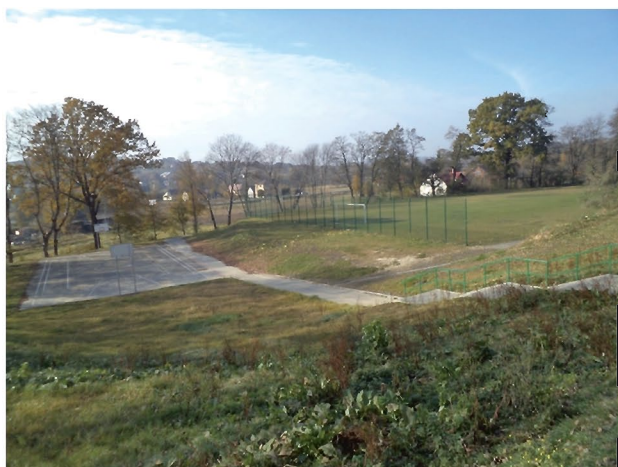
Jedno z boisk przy Szkole Podstawowej w Borku Starym