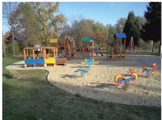
Fragment placu zabaw przy Szkole Podstawowej w Tyczynie

3. Przy Szkole Podstawowej w Tyczynie wykonany został plac zabaw dla dzieci za kwotę 109.298,09 zł , przez firmę PDEM Sp. z o.o. z Niebylca.