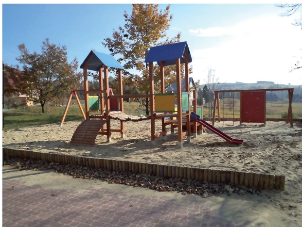
Plac zabaw w kompleksie boisk szkolnych przy SP w Borku Starym

4. Przy Szkole Podstawowej w Borku Starym wykonano kompleks boisk szkolnych, obejmujący: pełnowymiarowe bo-