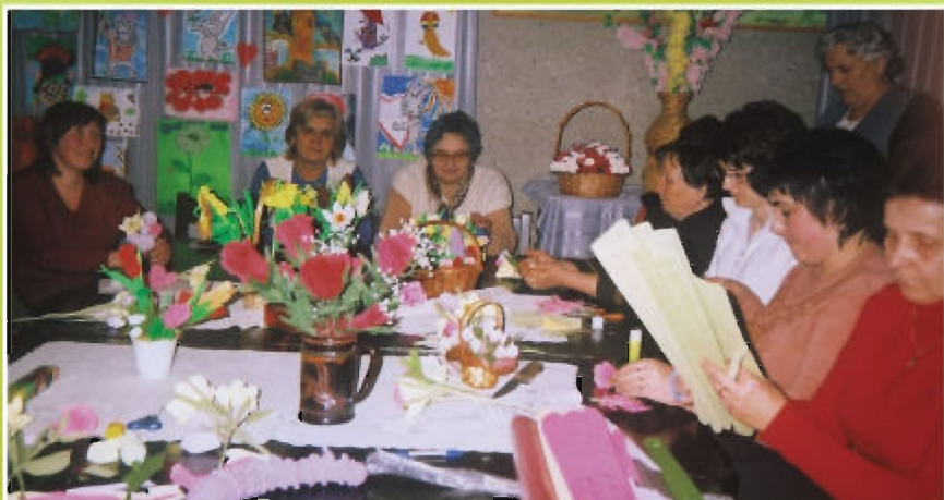
Rok 2009. Zajęcia praktyczne w klubie „Country”. Pokaz robienia sztucznych kwiatów