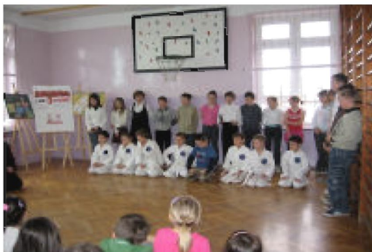
Chwila koncentracji przed pokazem sztuki samoobrony w wykonaniu najmłodszych uczestników treningów sztuk walki

Rozbudzenie zainteresowań sportowych odbywa się podczas zajęć pozalekcyjnych. Najbardziej popularne formy to m.in. gra w tenisa stołowego, piłkę nożną, treningi sztuk walki. Uświadamiamy rodzicom, że ruch jest bodźcem, bez którego rozwój fizyczny nie będzie przebiegał prawidłowo. Po-