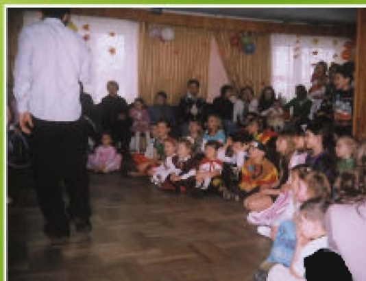
Rok 2009. Zabawa karnawałowa dla dzieci i młodzieży