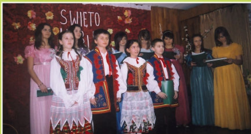
Rok 2009. Program artystyczny z okazji Dnia Kobiet w wykonaniu dzieci i młodzieży z klubu „Country”