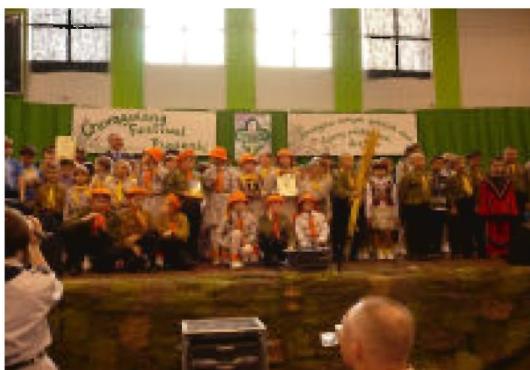
Zuchy odbierają nagrody

tym jedną z czasów okupacji. Laureaci wzięli udział w Chorągwiowym Festiwalu Piosenki, który odbył się w sobotę 18 kwietnia w Ropcycach. Wszystkie drużyny otrzymały pamiątkowe dyplomy i nagrody. Nasza 48 DH „Jerzyki” zajęła III miejsce. Wielkie brawa!