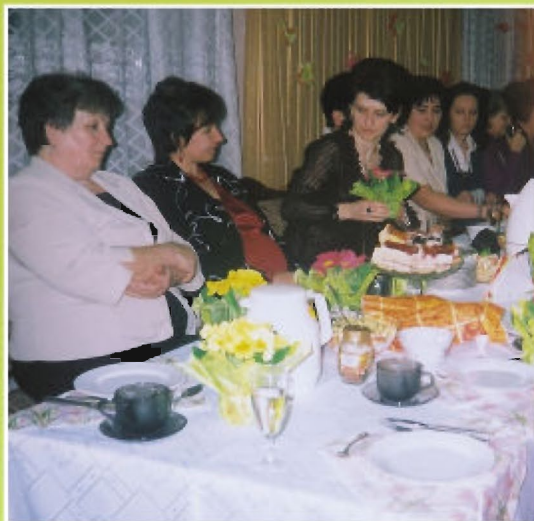
Rok 2009. Święto Kobiet w klubie „Country”