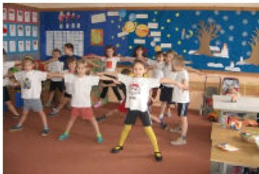
Gimnastyka w rytm wierszyka - pokaz ćwiczeń w wykonaniu dzieci z oddziału przedszkolnego

Współczesna bariatria, czyli dział medycyny, który zajmuje się leczeniem otyłości, zwraca uwagę, że jest to schorzenie złożone. Jego przyczyną mogą być czynniki hormonalne lub metaboliczne, jednak najważniejsze są: niewłaściwe odżywianie i zbyt mała aktywność ruchowa.