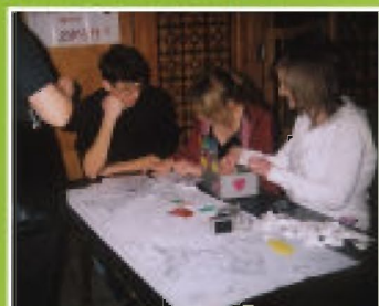
Rok 2009. Wystawa prac plastycznych wykonanych przez dzieci i młodzież w czasie ferii zimowych w klubie "Country"