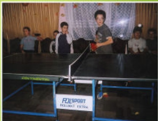
Rok 2009. Dzieci i młodzież podczas ferii zimowych