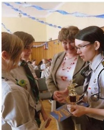
„Jerzyki” odbierają nagrody

Zuchy prezentowały pios. i piosenkę zuchową, pozostali uczestnicy dwie piosenki harcerskie, w