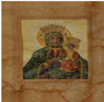
Sztandar przed renowacją