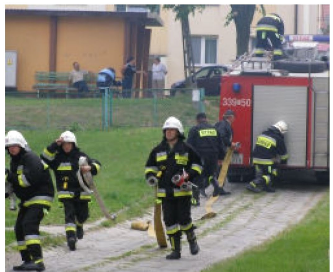
Przyjazd straży pożarnej był ciekawym wydarzeniem nie tylko dla dzieci. Również okoliczni mieszkańcy chętnie oglądali akcje prowadzone przez strażaków.