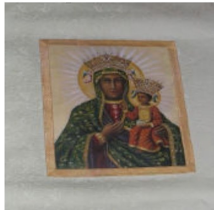
i po renowacji