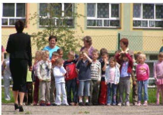
Jedną z akcji w ramach ćwiczeń obronnych, była ewakuacja SP w Tyczynie.