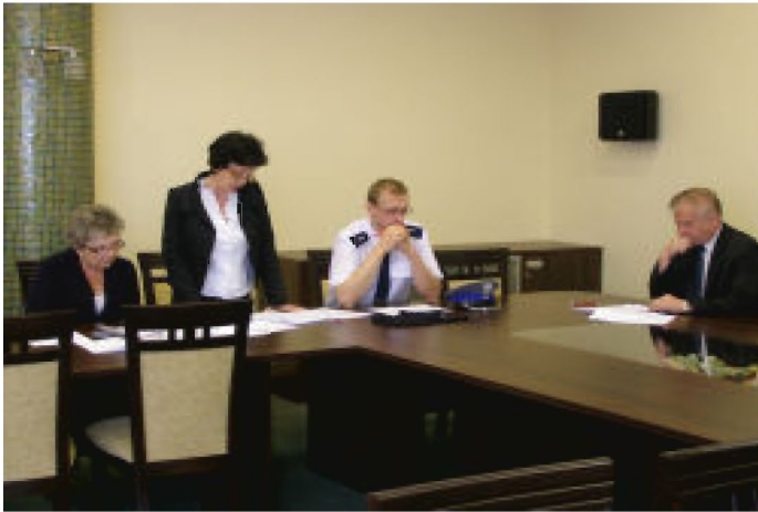
Członkowie sztabu kryzysowego przedstawiają sposoby reagowania na zagrożenia i możliwe plany działania.