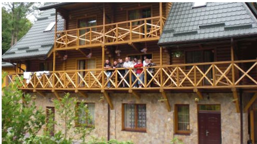
Hotel „Koliba” w Truskawcu