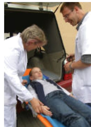
Pomocy medycznej po wydostaniu dziewczynki z pożaru udzieliłi jej pielęgniarki i lekarze z tyczyńskiego Ośrodka Zdrowia