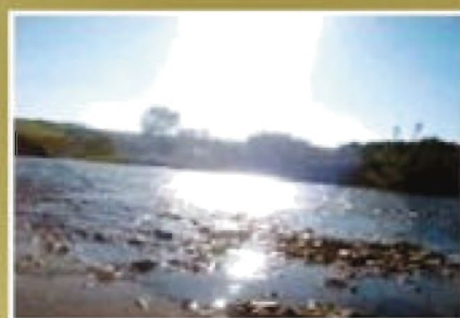
Fotografie Justyny Kocyło z kl. IIIId