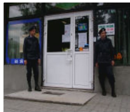
Drużyna porządkowo-ochronna pilnuje napadniętego sklepu.