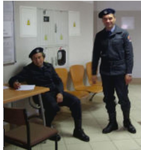
Panowie, którzy pełnili funkcje porządkowo-ochronne legitymowali wszystkie osoby wchodzące na teren Urzędu Miejskiego.