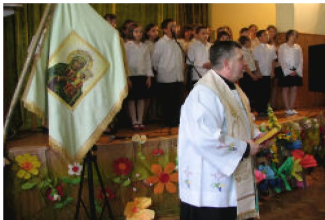
Poświęcenie odnowionego sztandaru