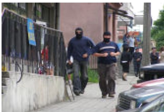
Napad na sklep „GS” przez nieznaną grupę migrantów wymagał interwencji policji.