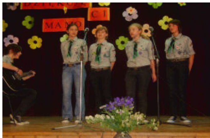
Występ harcerek z 48 Drużyny Harcerskiej „Jerzyki” im. św. Jerzego z Budziwoja

W podziękę za trud włożony w wychowanie, 24 maja br. w Domu Ludowym w Budziwoju, dzieci i młodzież przygotowali program artystyczny pt. „Dziękuję ci Mamo”. Mamy