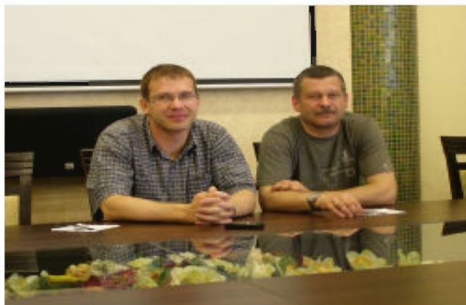
W ćwiczeniach obronnych wzięły udział także służby medyczne z Ośrodka Zdrowia w Tyczynie

O godz. 12.10 dyżurny Stałego Dyżuru podał informację o rozwinięciu akcji kurierskiej doręczania dokumentów powołania żołnierzom rezerwy. Prowadzący i wykonawcy otrzymali i rozdysponowali 100 kart powołania dla żołnierzy rezerwy w celu ich doręczenia przez kurierów. Wezwani kurierzy otrzymali karty powołania i wyruszyli w trasy doręczeń. Po powrocie dokonali rozliczenia z doręczalności tych kart, a następnie sporządzony został meldunek z wyników i przebiegu akcji kurierskiej.