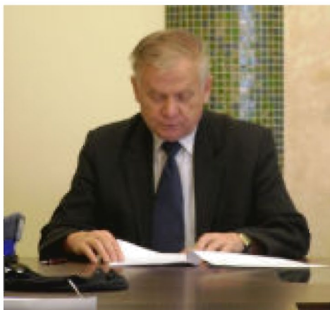
Szef Gminnego Zespołu Reagowania zebrał informacje o sytuacji w gminie i wydał członkom sztabu polecenia.