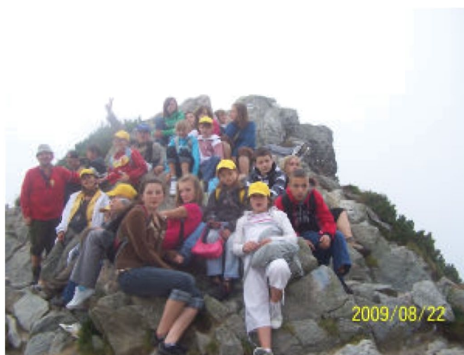
Wychodzimy na Kościelec Mały

Doliny Gąsienicowej, której nazwa pochodzi od nazwiska dawnych właścicieli. Dotarliśmy do schroniska Murowaniec położonego na wysokości 1500 m n.p.m. w Dolinie Suchej Wody Gąsienicowej. Zostało ono zbudowane w latach 1921 - 1925, a następnie przebudowywane do obecnego okazałego kształtu. W nim zrobiliśmy przerwę, dla zebrania energii na dalszą trasę. Naszym celem było zdobycie szczytu Kościelec Mały 1863 m n.p.m. oraz obejrzenie jezior w Kotle Gąsienicowym. W drodze ze schroniska podziwialiśmy cuda natury i piękno gór. Nasz szlak przeciął niedźwiedź, co zostało utrwalone fotograficznie. Ciągłe wspinanie się pod górę było dla niektórych uciążliwe, lecz nie ma niczego bez wysiłku. Tak więc wszelka słabość została przełamana dla osiągnięcia szczytu. Kiedy weszliśmy na szczyt, widok na panoramę gór i jezior zachwyił swym urokiem i majestatem. Po krótkim odpoczynku na górze przystąpiliśmy do zejścia ku Czarnemu Stawowi Gąsienicowemu znajdującemu się na wysokości 1624 m n.p.m. Sam staw ma powierzchnię 17,94 ha oraz głębokość 51 m, znajduje się na nim wysepka porośnięta kosodrzewiną o powierzchni 310 m 2 . Kolor wody ma barwę szafirową. Po odpoczynku przy Czarnym Stawie udaliśmy się w drogę powrotną, pochwyteni przez zmianę pogody na desz-