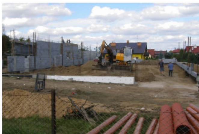
Budowa supermarketu „Biedronka”

Zdarzenie nie zakłóciło prac przy budowie nowego supermarketu. Jak powiedział nam kierownik budowy - Grzegorz Fialek - zakończenie prac planowane jest na listopad, a prawdopodobne otwarcie „Biedronki” nastąpi już w grudniu.