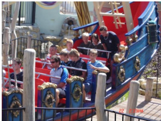
Po meczu z Autriakami, przyszedł czas na odpoczynek

Na tym jednak nie koniec, bowiem początkiem sierpnia nasza reprezentacja juniorów młodszych wyjechała na obóz sportowy do Gersheim (Kraj Saary) nieopodal granicy niemiecko-francuskiej. Nieco starsze nadzieje piłkarskie Strugu, wspólnie