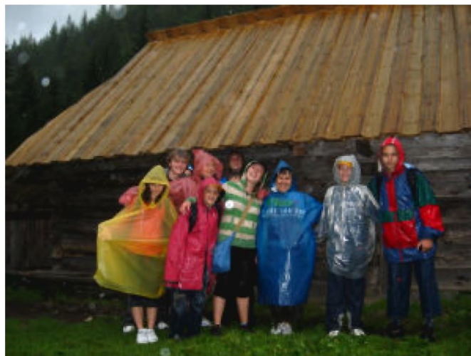
Zmoknięci ale szczęśliwi

w gorących wodach oddawaliśmy się wodnemu szaleństwu. Nasza grupa okazała się zgranym zespołem mogącym na sobie polegać. Należy też podkreślić, iż najmniejszym należy się pochwała za wytrwałość oraz niezłomność w górskim wędrowaniu.