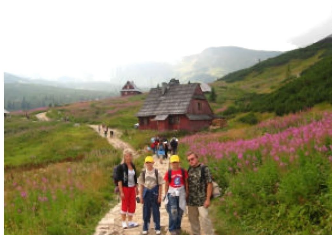
Idziemy w stronę Kasprowego Wierchu

Drugiego dnia wyjechaliśmy do Zakopanego, skąd spod kolejki na Kasprowy Wierch wyruszyliśmy w Tatry szlakiem do