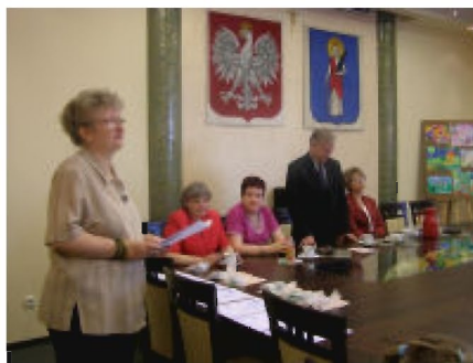
Oficjalne ogłoszenie wyników i wręczenie nagród w sali narad UM w Tyczynie