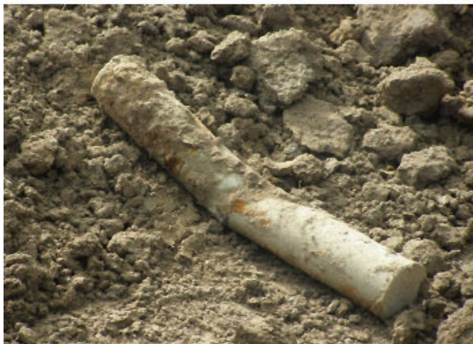
Niewypał znaleziony na budowie to pocisk artyleryjski o długości 50 cm, pochodzący z czasów II wojny światowej

Na placu budowy supermarketu „Biedronka” w Tyczynie odkryto pozostałości po II wojnie światowej.