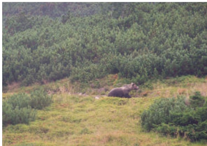
Na górskim szlaku spotkaliśmy niedźwiedzia

W niedzielę po śniadaniu i pożegnaniu się z gospodarzami, udaliśmy się na Mszę Świętą w kaplicy w Białym Dunajcu. Następne w naszym programie były Termy Podhalańskie, gdzie