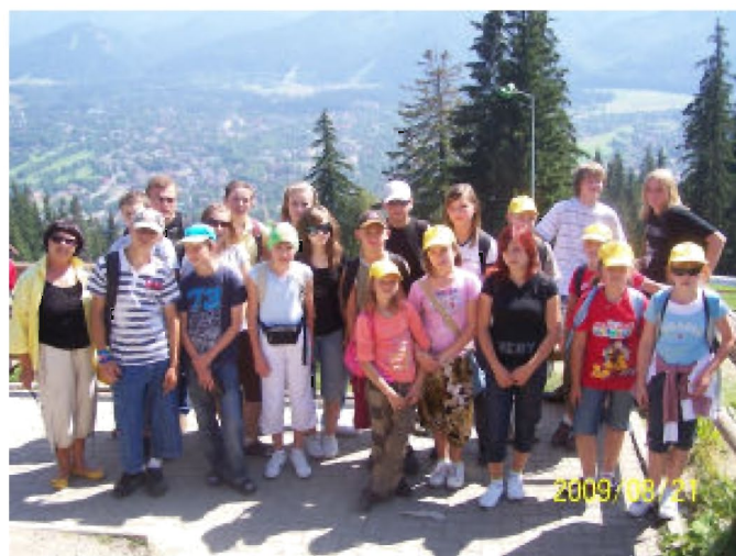
Uczestnicy wycieczki na Gubałówce

Pierwszego dnia dotarliśmy do Zakopanego, gdzie kolejką wyjechaliśmy na Gubałówkę, a po powrocie, udaliśmy się pieszo do Sanktuarium Matki Bożej Fatimskiej na Krzeptówkach.