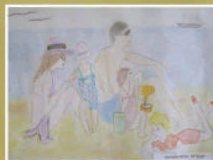
Weronika Brzęk - SP w Tyczynie