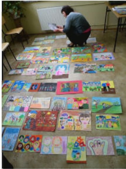
Nad wyborem najlepszych prac komisja spędziła kilka godzin