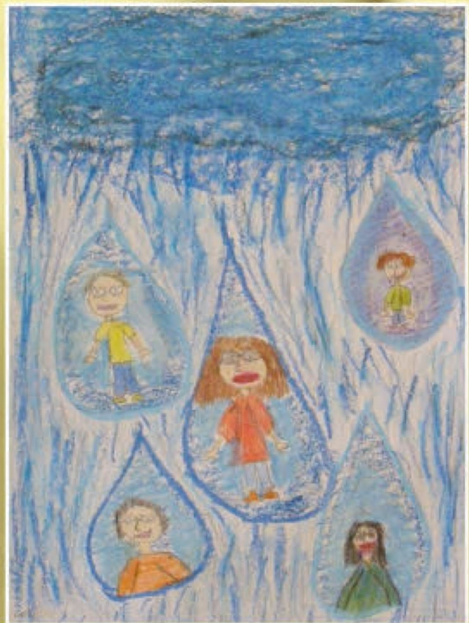
Klaudia Kozicka - SP w Kielnarowej