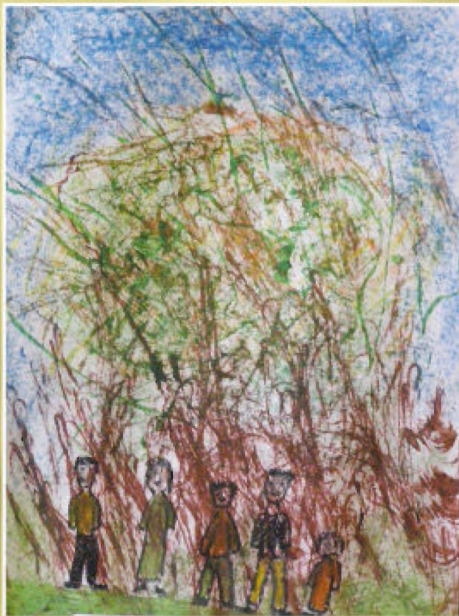
Szymon Ziarnik - SP w Budziwoju