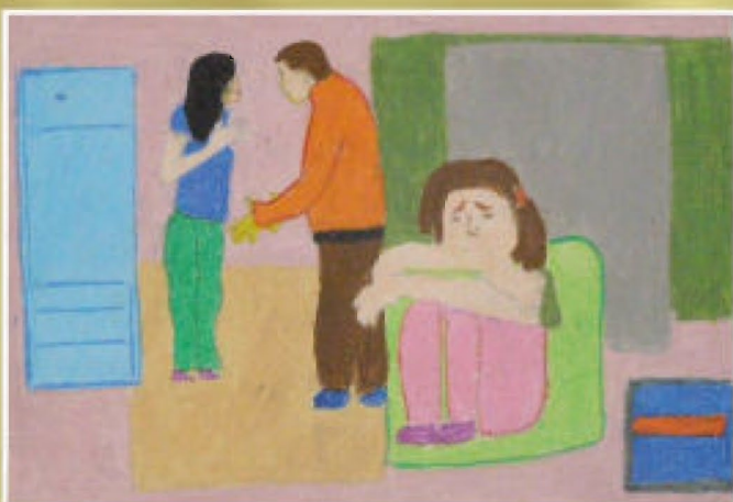
Iwona Baran - PG Tyczyn