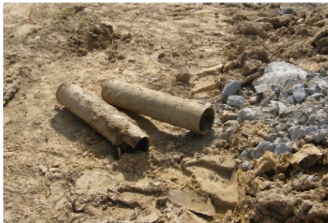
Luski po pociskach

Tuż po godzinie 15 na teren budowy przyjechała jednostka saperów, która wywozła niebezpieczne materiały. W sobotę saperzy przyjechali ponownie do Tyczyna. Przy pomocy specjalistycznych urządzeń, sprawdzili czy na placu budowy nie znajduje się więcej niebezpiecznych pocisków.