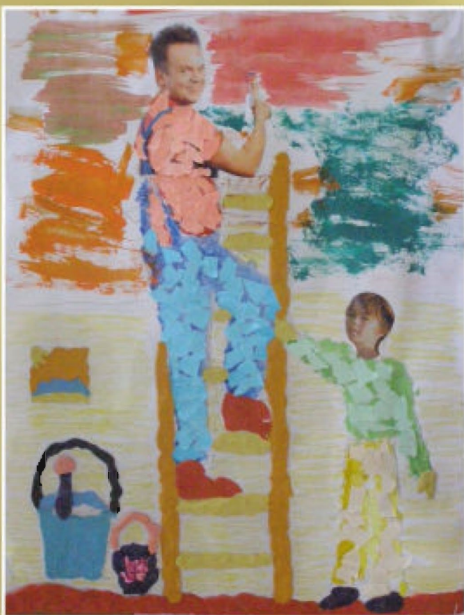
„Remont” - Arkadiusz Krztoń SP w Hermanowej