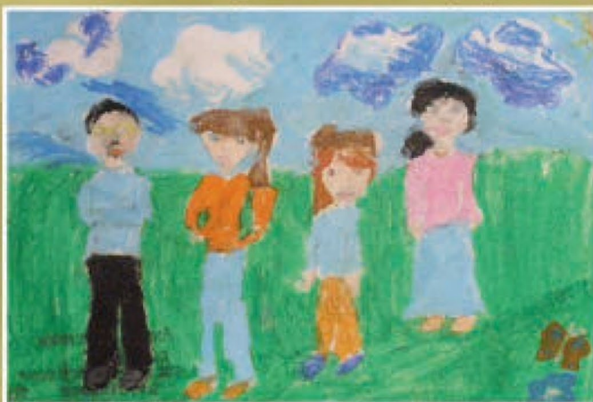
Aneta Pomianek - SP w Matysówce