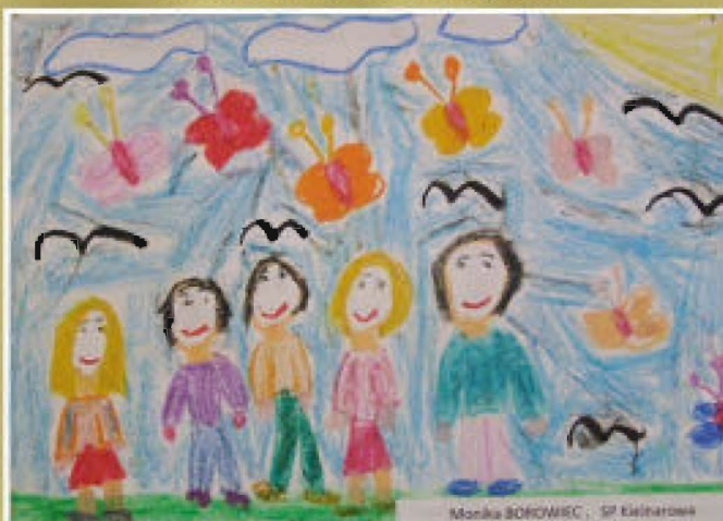
Monika BOROWIEC - SP w Kielnarowej