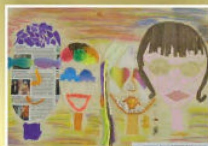
Paulina Wojtowicz - SP w Budziwoju