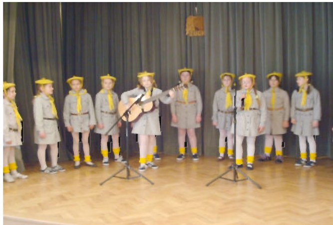
Zdobywcy I miejsca wśród gromad zuchowych - 23 GZ „Wesołe Krasnoludki” z Tyczyna

I miejsce wśród gromad zuchowych zajęła 23 GZ „Wesołe Krasnoludki” z Tyczyna , a II miejsce 21 GZ „Ekołudki” z Budziwoja