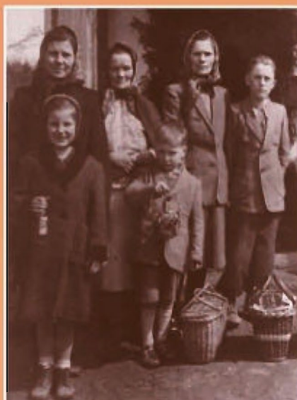
Studzianka, rok 1948. Rodzina Wilków podczas święcenia wielkanocnych pokarmów