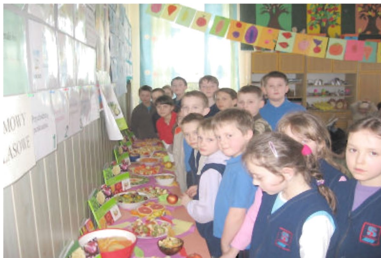
Prezentacja - Owocowo-warzywny mix dla ucznia

owocowych oraz zgromadziły różnego rodzaju soki. Barwne plakaty i opisy wykonanych smakołyków oraz estetyka ekspozycji na pewno spowodowały wzrost apetytu na owoce i warzywa nawet u niejadków. Miłą niespodzianką były rozdawane w tym dniu wszystkim uczniom i pracownikom szkoły jabłka, подарowane przez Radę Rodziców (w pozostałych dniach tygodnia zdrowia każdy mógł je też nabyć w sklepiku szkolnym).