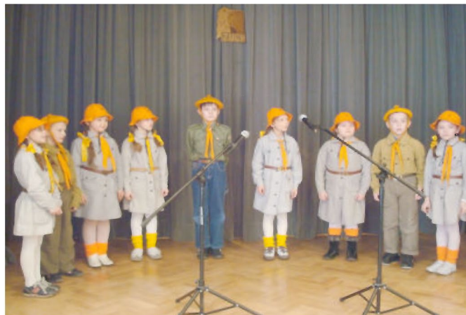
II miejsce zajęła 21 GZ „Ekołudki” z Budziwoja

z Budziwoja. W kategorii harcerzy młodszych I miejsce przypadło 48 DH „Jerzyki” z Budziwoja. Jednym słowem - „nasi” z ZDDS Tyczyn znów wypadli śpiewająco!