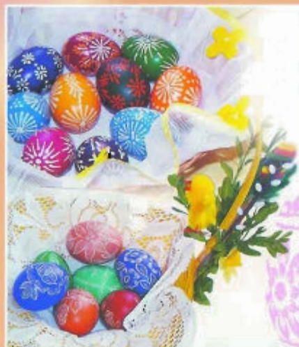
Pisanki wykonane techniką batikową