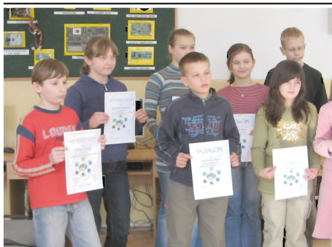
Finaliści konkursu nagrodzeni zostali dyplomami