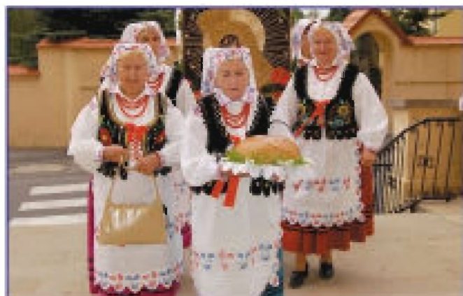
Delegacja z Matysówki