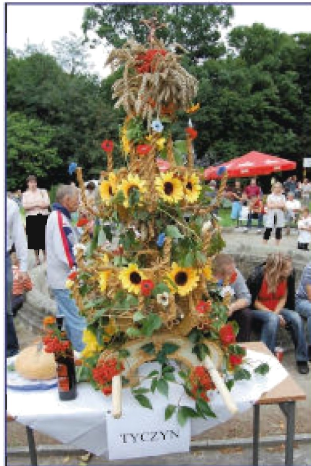
Wieniec dożynkowy z Tycczyzna