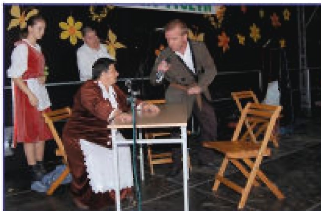
Widowisko „Walki chłopskie” w wykonaniu „Nockowian”