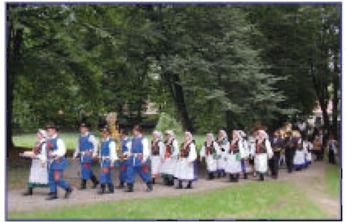
Korwód dożynkowy w parku