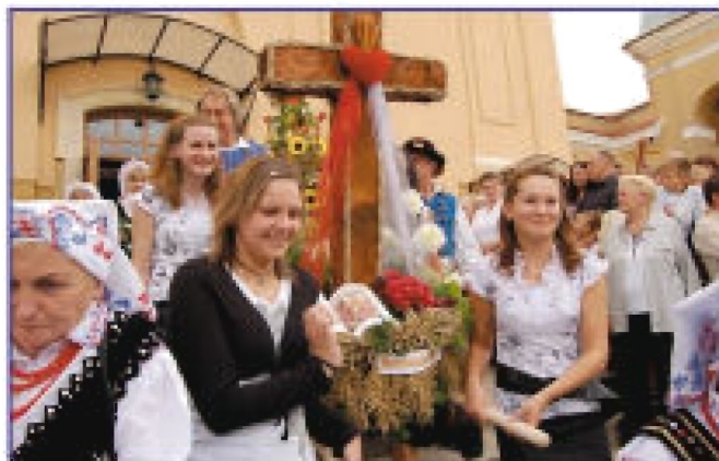
Delegacja z Hermanowej