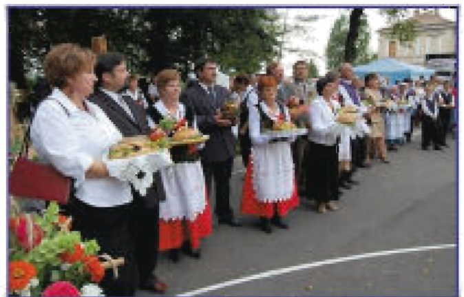
Delegacje dożynkowe z darami do burmistrza