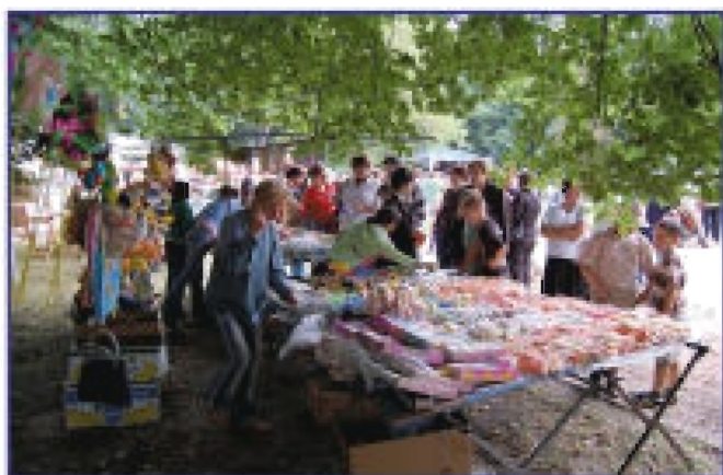
Stoisko handlowe tzw. kramy