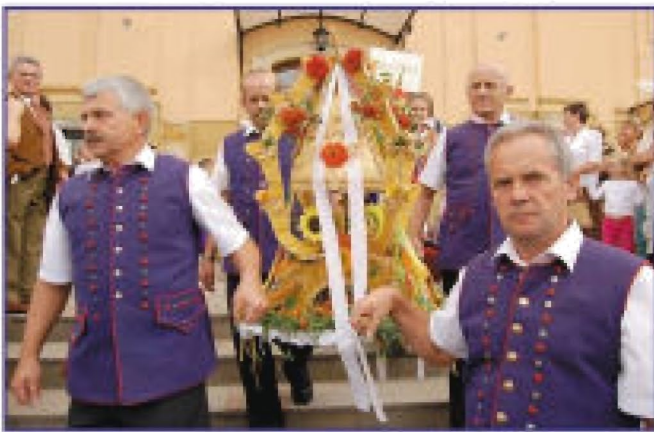
Delegacja z Białej