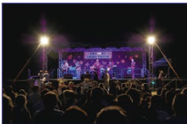
Gwiazda wieczoru zespół „RATATAM”