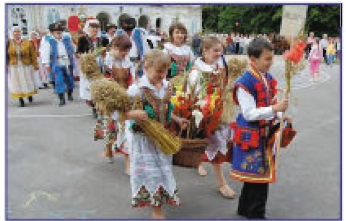
Dzieci z zespołem Budziwojce