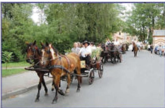
Barwny korwód dożynkowy ulicami Tyczyńa