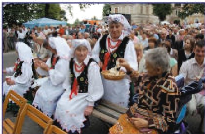
Częstowanie chlebem gości dożynkowych