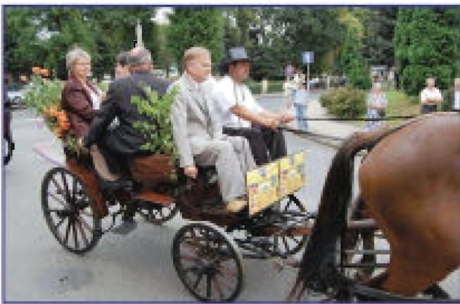
Burmistrz, Przewod. Rady, Dyr. M-GOK, w czasie przejazdu do parku