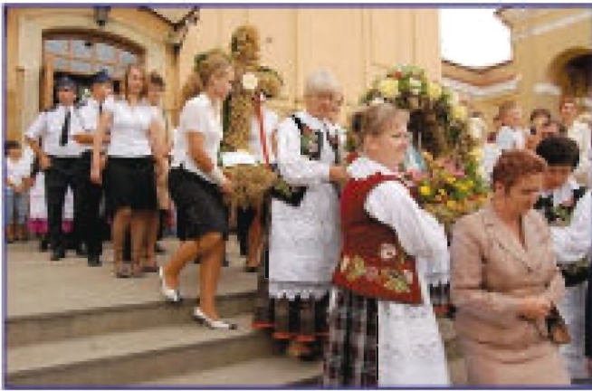
Delegacje z wieńcami po Mszy Świętej