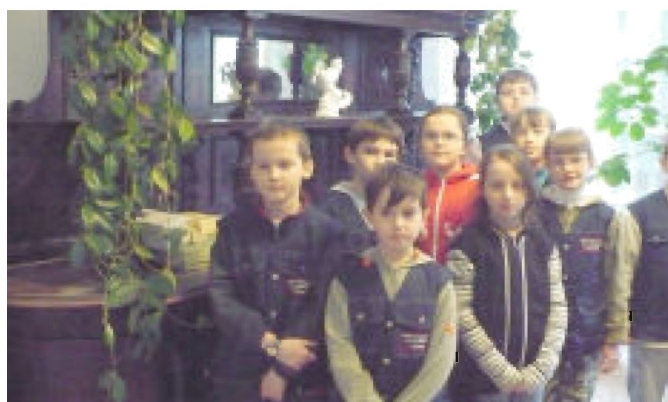
Gabinet z zachowanymi meblami w pałacu Wodzickich

Zaintrygowani tym, jak dawniej wyglądało codzienne życie tyczynian, wybraliśmy się do miejscowego muzeum. Oprócz sprzętów gospodarskich, oglądaliśmy kroniki pełne wycinków prasowych i zapisków pochodzących z ubiegłego wieku. Obejrzeliliśmy również stare księgi parafialnych oraz pozółkłe zdjęcia znajdujące się w zbiorach Miejsko-Gminnej Biblioteki Publicznej.