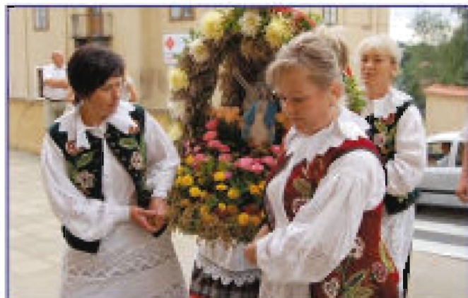
Delegacja z Borku Starego