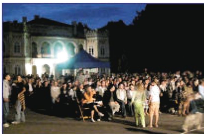
Publiczność w trakcie koncertu