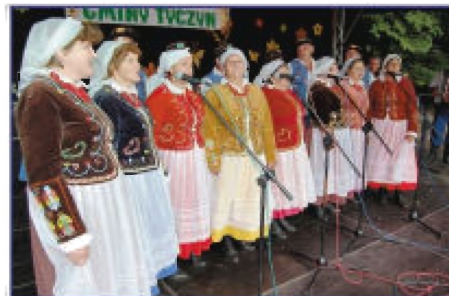
Występ zespołu ludowego „Budziwojce”