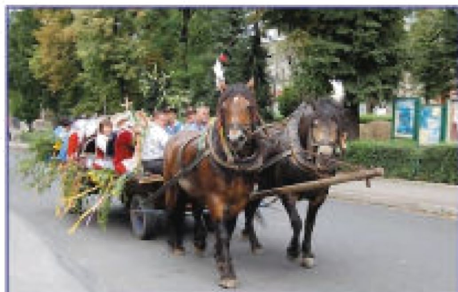
Barwnie przystrojonymi wozami przyjechały do Tyczyna m.in. Budziwojce