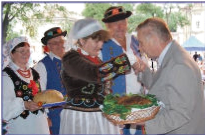
Składanie darów na ręce Burmistrza Tycczyzna