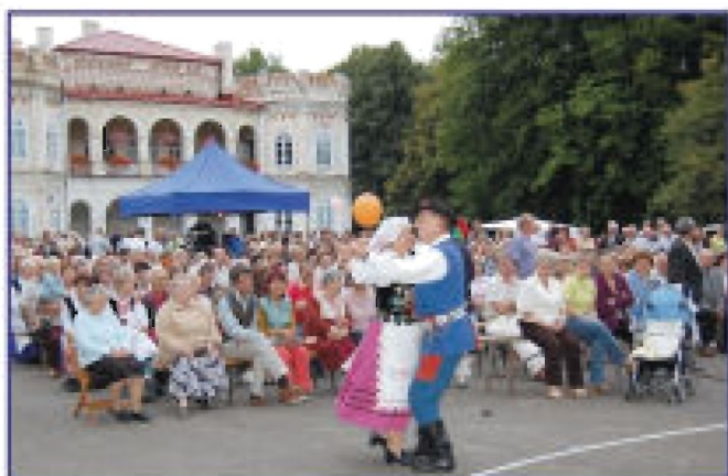
Publiczność oglądająca występy zespołów ludowych