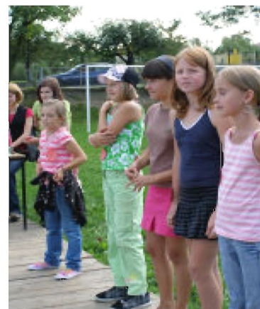
Kandydatki na Mini Miss Tyczyna

Wszyscy, którzy przybyli na piknik mieli okazję postrzelać do tarczy z paintball'a (pistoletu na kulki z farbą), a także kupić coś słodkiego na specjalnie przygotowanym stoisku handlowym.