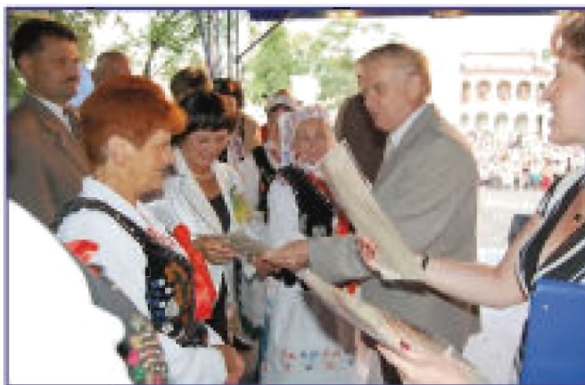
Wręczenie podziękowań dla delegacji dożynkowych