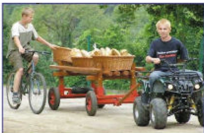
Transport pieczywa z piekarni „Misia Jani”