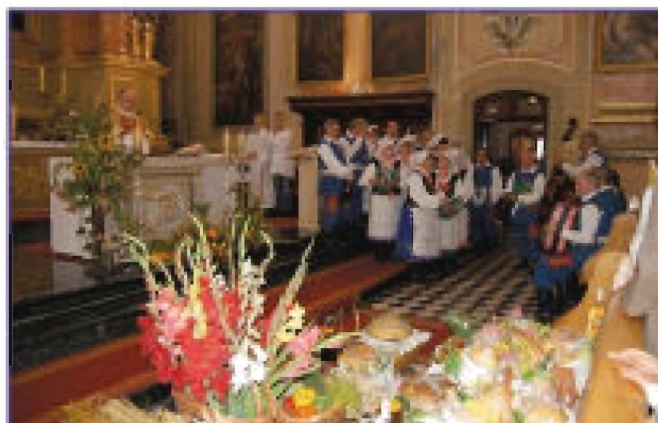
Uroczysta Msza Dożynkowa w kościele pw. Świętej Trójcy i św. Katarzyny w Tyczynie