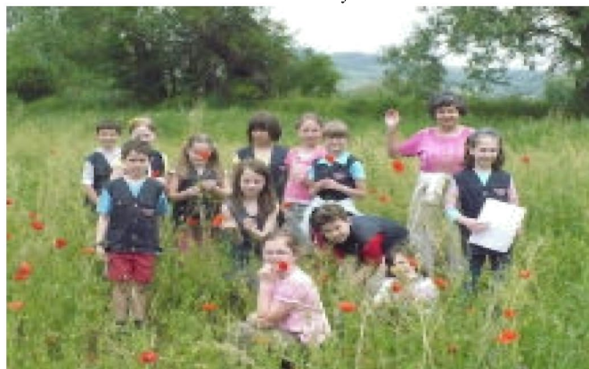
Wyprawa na tzw. „Księżę łąki”

Równie piękne jak samo miasto są okolice Tyczyna. Przekonaliśmy się o tym wędrując polnymi drózkami biegnącymi wzdłuż łąk kwitnących rumianków i pól pełnych maków. Szliśmy trasą wyznaczoną przez przydrożne kapliczki. Wyszliśmy nawet na najwyższe wzniesienie w okolicy, Dalnicę. Byliśmy w miejscu skąd wypływa cudowne źródelko, a na koniec doszliśmy aż na Królkę.