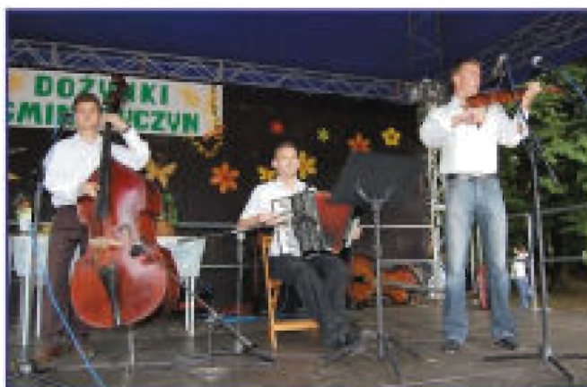
Występ zespołu folkowego „Karczmarze”