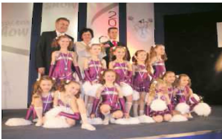
Sosnowiec 2007. Ogólnopolski Turniej Cheer Dance Show

Dziękuję władzom miasta, dyrekcji SP, sponsorom i współorganizatorom imprez oraz Rodzicom pomagającym przy organizacji turnieju, dowożącym dzieci na zawody, oferującym swój czas, trud i dobre serce.