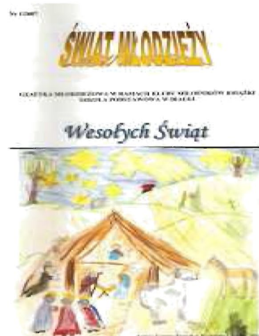
Numer „Świata Młodzieży”

Wszystkie nasze publikacje cieszą się dużym zainteresowaniem wśród uczniów, cennym doświadczeniem dla nich jest również to, że są oni nie tylko odbiorcami, ale przede wszystkim twórcami i mają wpływ na to, co potem mogą