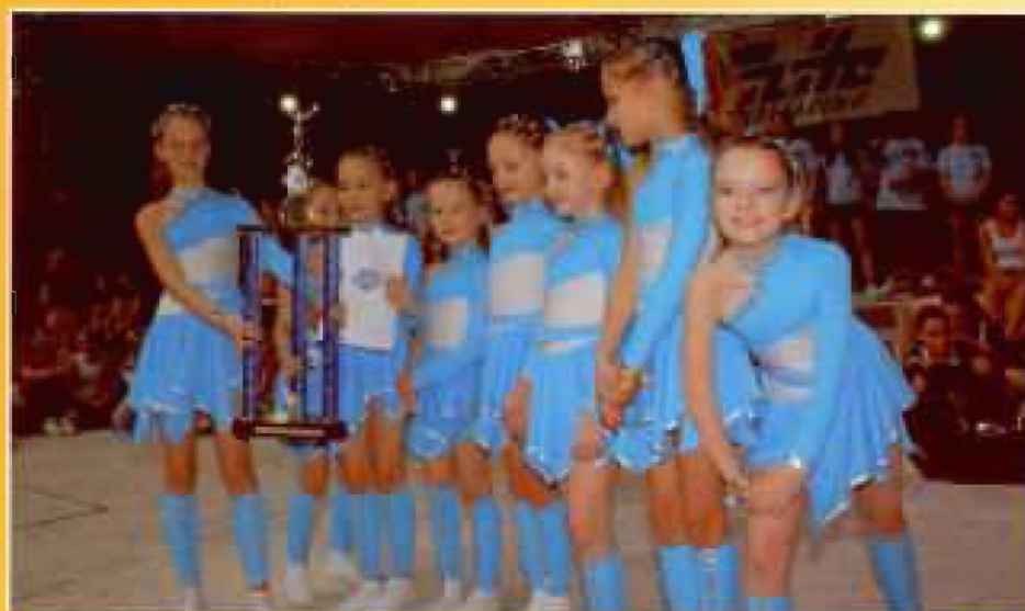
Niemcy 2008. Timnej Międzynarodowy III Elite Beach Cup zdobyływiecznie II miejsca w kat. Pee Woc (młodzież)