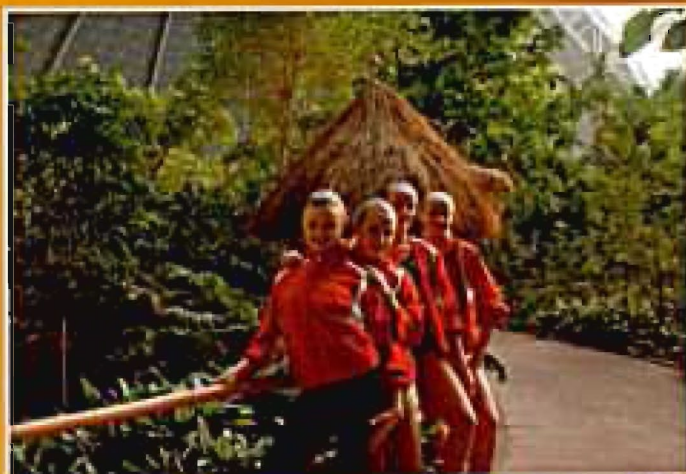
Niemcy 2008, Dziewczęta w Tropical Islands po zawodach