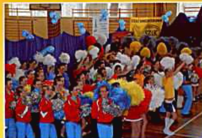
Tyczyn 2008, Rozpoczęcie zawodów