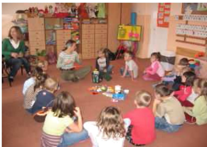
Zajęcia ekologiczne w „zerówce”

Zespołowo największym zaangażowaniem wykazała się klasa III b . Łącznie zebrano: 1671,20 kg makulatury, 1613 sztuk plastikowych butelek typu PET, 929 aluminiowych puszek oraz 2199 baterii.