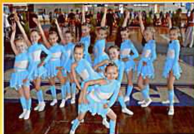
Tarnów 2008, Wdzięczne maluchy na Mistrzostwach Polski lubią być widoczne

Stroje, w których występują dziewczynki na zawodach i pokazach są szyte przez panie Marię Plutę i Marię Sikorę, za co im serdecznie dziękujemy.