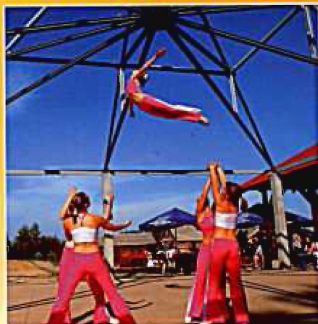
„Flimero” w trakcie pokazu