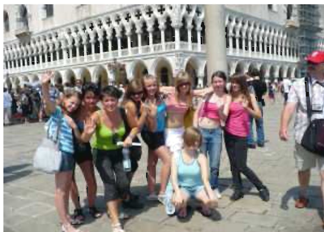
Po zawodach był czas na zwiedzanie Wenecji ...