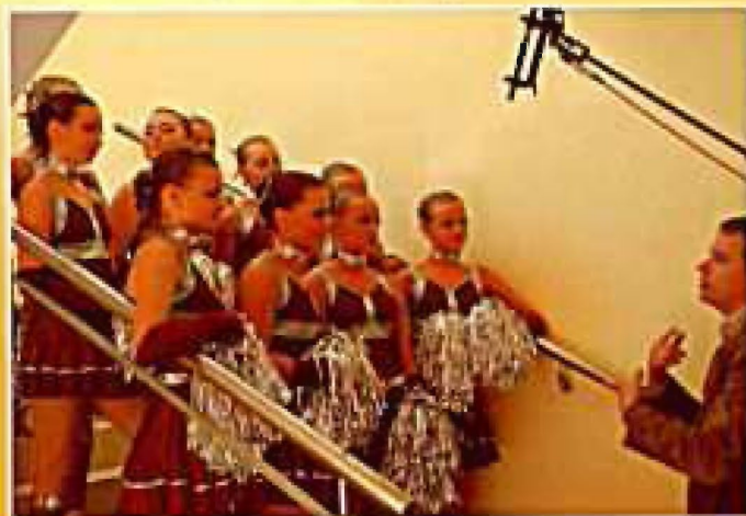
Tyczyn 2007, I Mistrzostwa Województwa Podkarpackiego - wywiad dla TVP Rzeszów