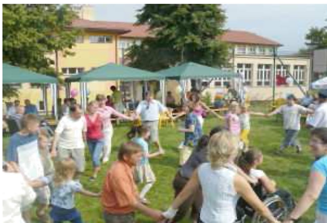
Uczestnicy imprezy podczas gier i zabaw

Impreza miała charakter otwarty, pozwoliła osobom uczestniczącym aktywizować swoje zdolności muzyczne, plastyczne i ruchowe. Dostarczyła dużo radości i dobrej zabawy podczas licznych konkursów i gier. Wyzwoliła pozytywne relacje w grupie. Mieszkańcy Gminy Tyczyn mogli dostrzec skalę i problemy członków naszego Stowarzyszenia.