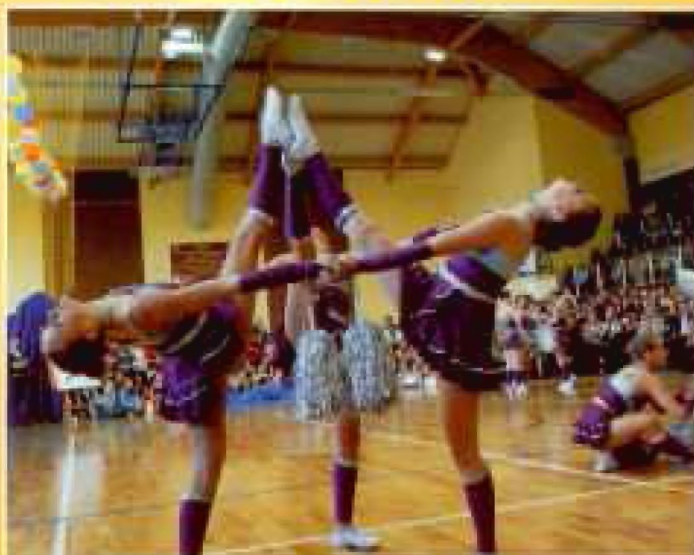
Tyczyn 2007. Występ „Flimero” na I Otwartych Mistrzostwach Cheerleaders Szkół Gimnazjalnych i Licealnych woj. podkarpackiego