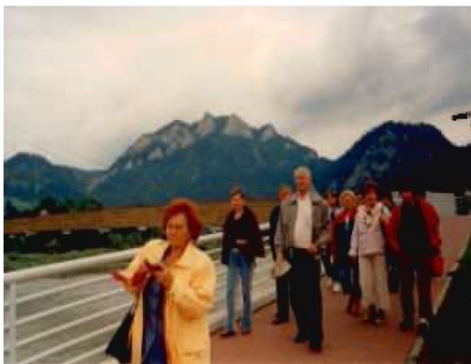
Most łączący Polskę i Słowację z widokiem na Trzy Korony

Z Ludźmierza udaliśmy się w trasę do Zakopanego. Kolejną linową wyjechaliśmy na Gubałówkę, gdzie podziwialiśmy panoramę Tatr.