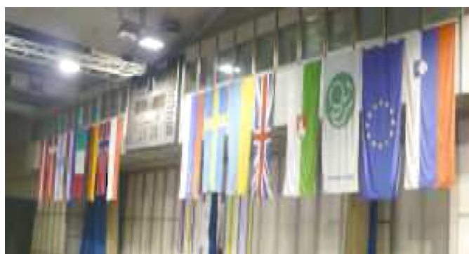
Flagi państw uczestników zawodów