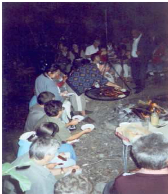
Miłym zakończeniem dnia była biesiada przy ognisku, którą przerwał niespodziewany deszcz