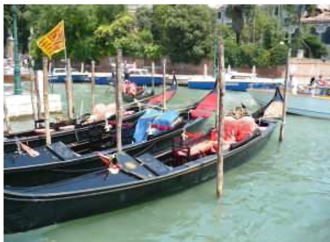
Klasyczna przejażdżka gondolą traktowana jest jako atrakcja turystyczna

Koszty wyjazdu na Mistrzostwa Europy były wysokie ale udało się dzięki ludziom dobrej woli, pomocy Pana Burmistrza, dotacji Urzędu Wojewódzkiego, własnym środkom finansowym zarobionym przez dziewczęta oraz wydatkom pokrytym przez samych rodziców.