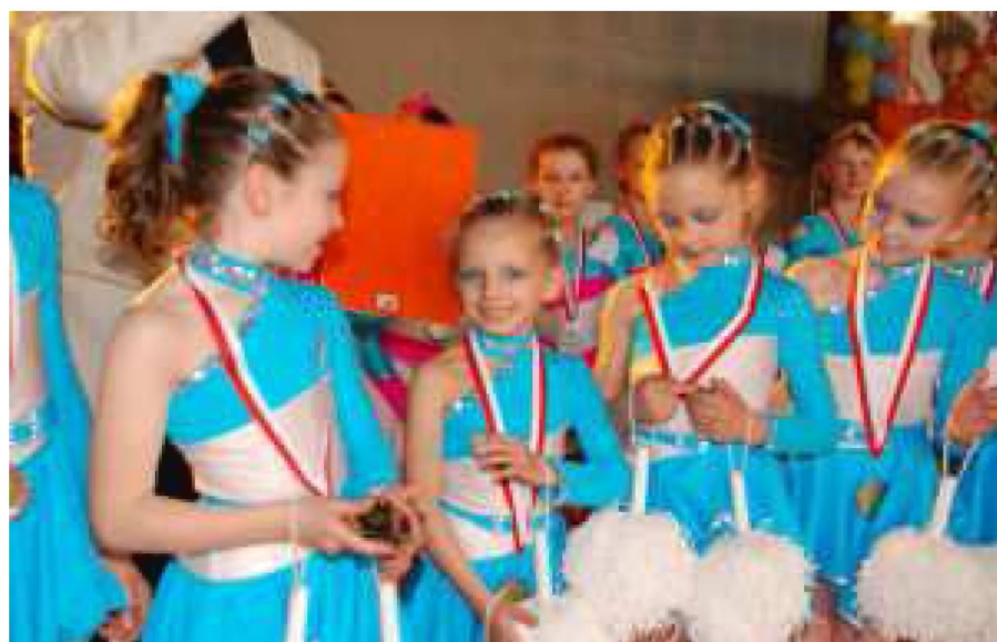
Tarnów 2008. Najmłodsze cheerleaderki w Polsce w kat. do lat 14 wywalczyły srebro

Wspólnymi siłami i dużym zaangażowaniem przyczyniliśmy się do sukcesów zespołu. Dziękuję z nadzieją, że w roku 2008/2009 nasza współpraca będzie równie udana, albo jeszcze lepsza.