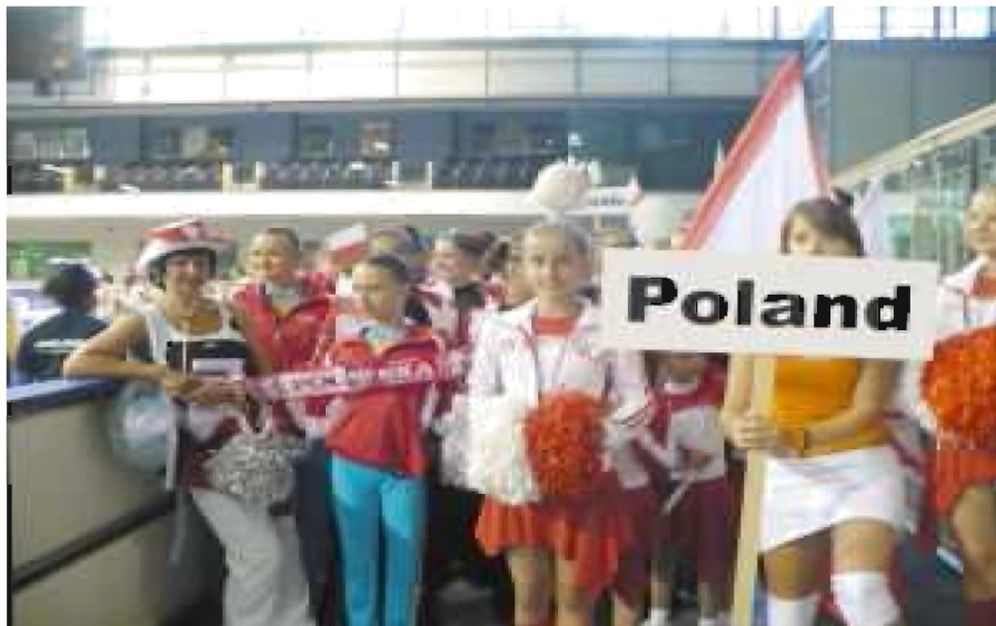
Polskę reprezentowały zespoły z Tyczyna, Tarnowa i Słupska

Udział w Mistrzostwach był dużym wyzwaniem i niezapomnianą przygodą. Zapoznaliśmy się z wieloma zespołami, podglądałyśmy najlepszych uczestników, do których niewątpliwie należą państwa skandynawskie. Ciężka, długa podróż wynagrodziło nam zwiedzanie Bratysławy, Ljubljany i miasta na wodzie - pięknej Wenecji.