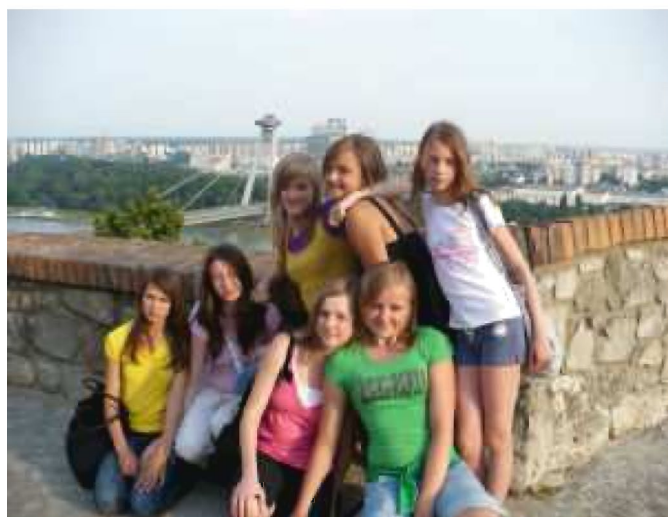
... i Bratysławy