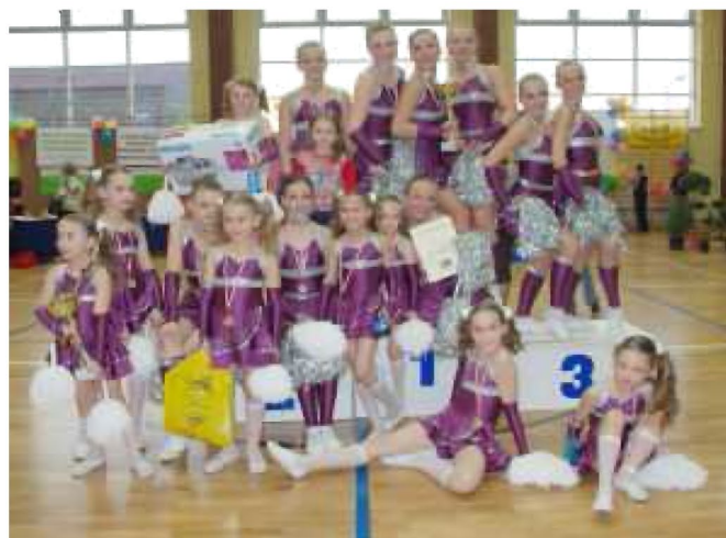
Tyczyn 2007. I Mistrzostwa Województwa Podkarpackiego I m. w kat. junior, I m. w kat. junior młodszy

4 października br. (sobota) czeka nas kolejne wyzwanie - Międzynarodowy Turniej Eurogala 2008.