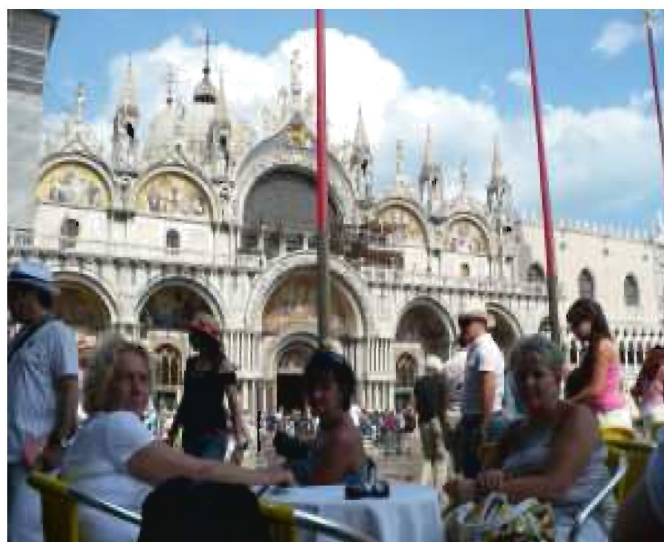
Czas na odpoczynek