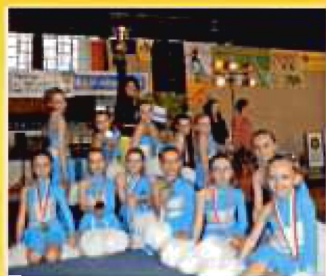
Warszawa 2007. Turniej Międzynarodowy, złote medalistki