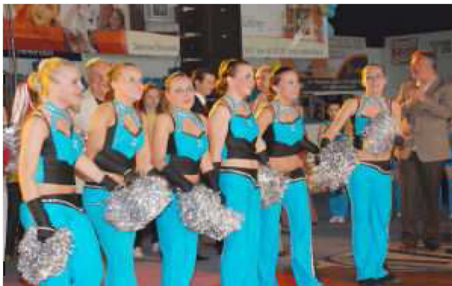
Tarnów 2008. Łzy szczęścia - mamy awans do Mistrzostw Europy 2009

Lata 2006-2008 obfitowały w ważne wydarzenia. „Flimero” aktywnie uczestniczyło w imprezach sportowych i odnosiło liczne sukcesy.