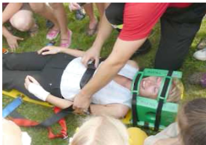
Pokazy ratownictwa medycznego w wykonaniu tyczyńskich strażaków

Uczestnicy cieszyli się zwłaszcza z wręczanych medali, których na co dzień nie otrzymują, gdyż ich status materialny i sprawność psychofizyczna wyklucza z rywalizacji ze zdrowymi rówieśnikami.