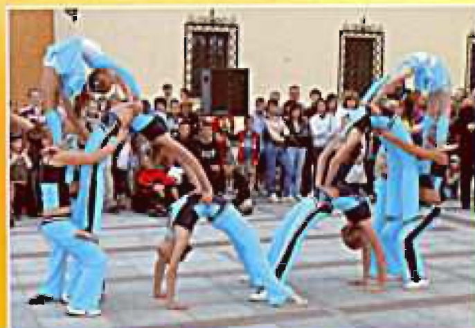
Tarnów 2008, Pokaz na Rynku