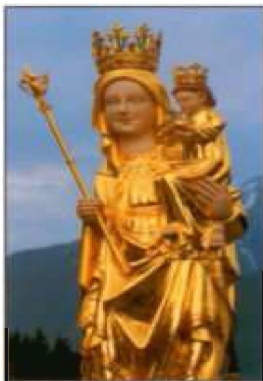
Matka Boża Ludźmierska

Wieczorem odbyło się ognisko przygotowane przez przyjaciela stowarzyszenia. W niedzielę uczestniczyliśmy we