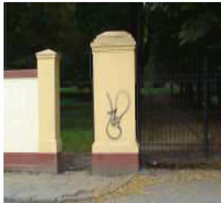
Zniszczony mur parkowy w Tyczynie

Wydaje mi się, że gdyby przyszło odrestaurować niejednemu tatusiowi jedną lub kilka elewacji zdewastowanych