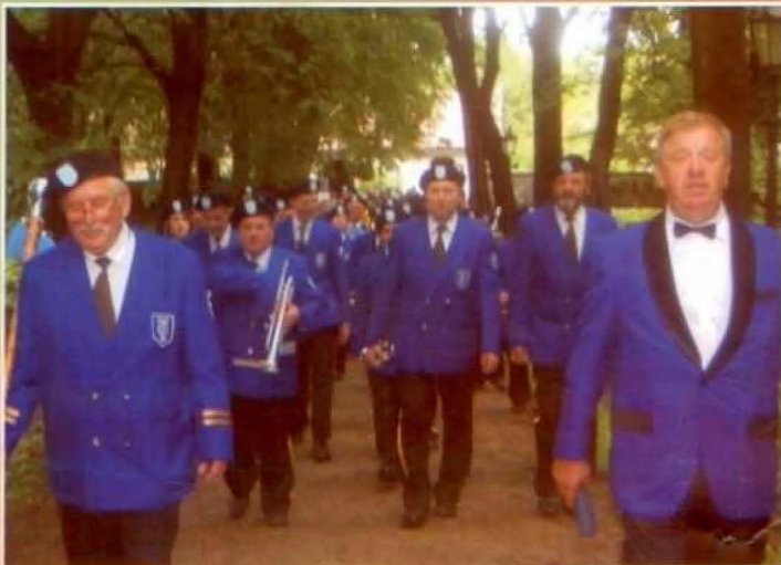
Orkiestra Dęta WSK Rzeszów