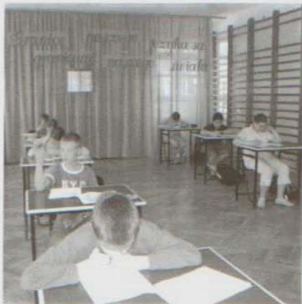
Podczas rozwiązywania testu

Organizatorami, tak jak w ubr., byli nauczyciele polonisci ze szkoły w Budziwoju i w Matysówce. Konkurs miał formę testu językowego, a głównym jego celem było upowszechnianie wiedzy na temat roli języka w zachowaniu kultury i tożsamości narodowej oraz wdrażanie do dbałości o jego poprawność.