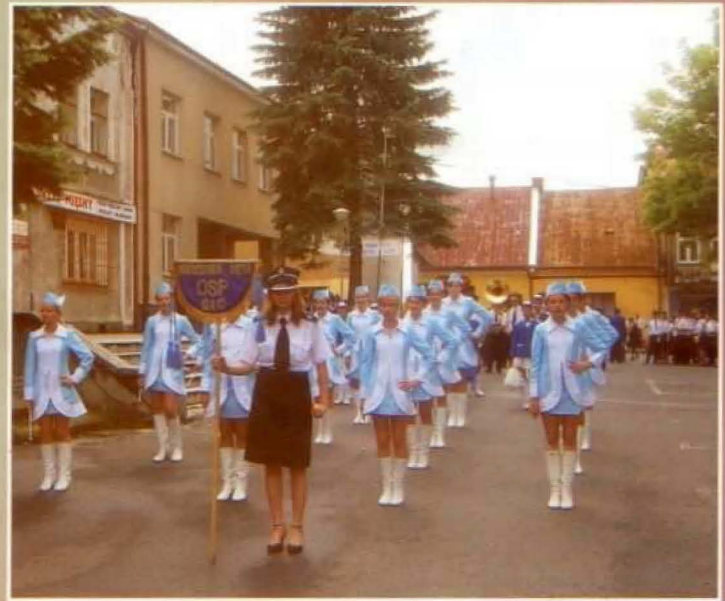
Pięknie prezentowały się mażoretki prowadzące Orkiestrę Dętą z Gaci