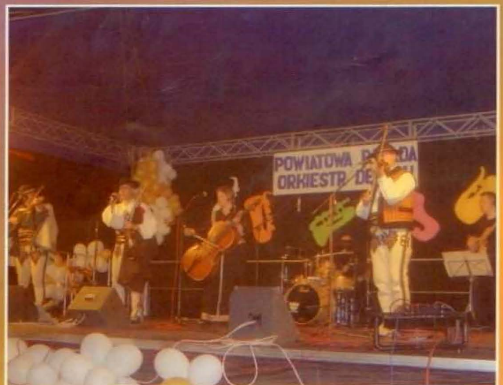
Gośćmi specjalnymi tegorocznych „Dni Tyczyna” był zespół „Trebunie Tutki”

Po koncercie Orkiestr dętych zgromadzoną publiczność zachęcał do zabawy zespół REWERS .