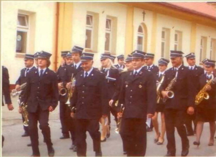
Orkiestra Dęta z Głogowa Młp.