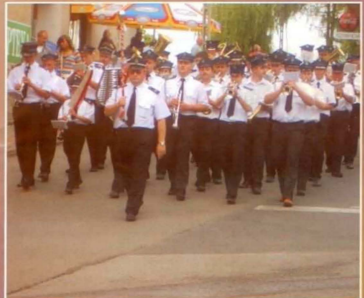
Orkiestra Dęta z Leżajska