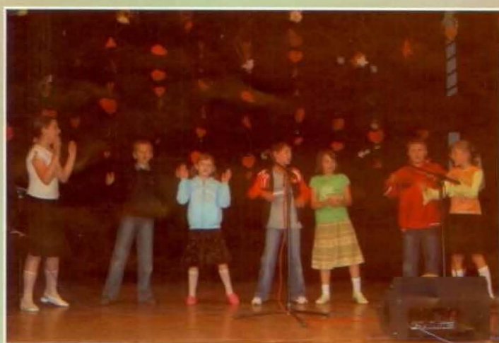
Zespół wokalny z Hermanowej (kat. młodsza)