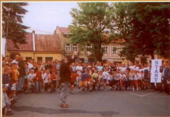
Na sygnał Burmistrza startują najmłodszy uczestnicy biegu