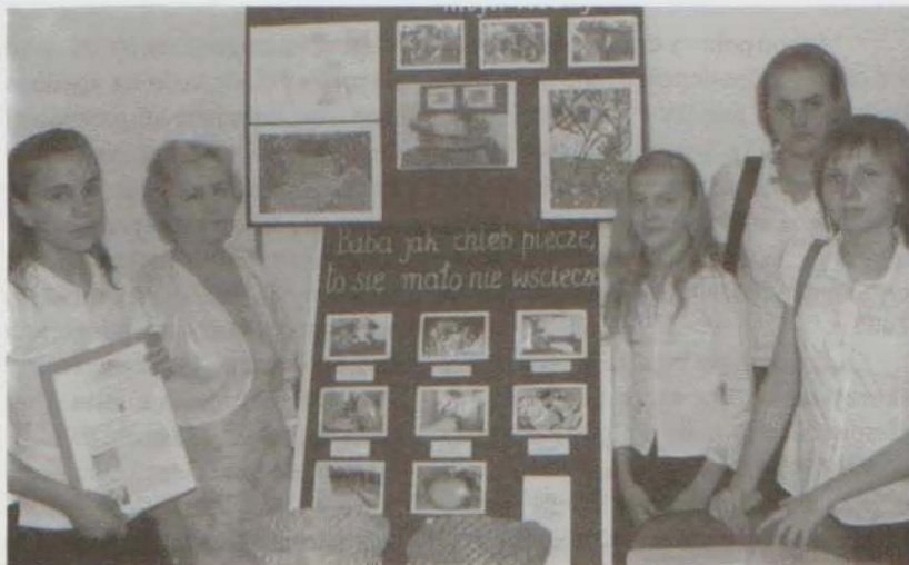
Nasze stoisko w Pałacu Kultury i Nauki