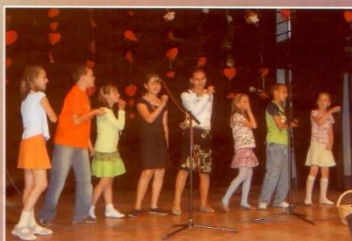
I miejsce w kat. starszej zdobył zespół wokalny z Hermanowej