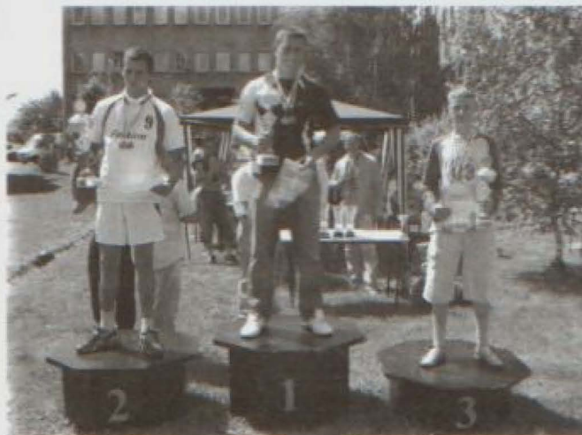
Puchary Starosty za najlepsze wyniki w wieloboju siłowym (drużynowo)

Wszyscy uczestnicy i także ich opiekunowie bardzo dobrze się bawili. W czasie przerwy można było posmakować sta-