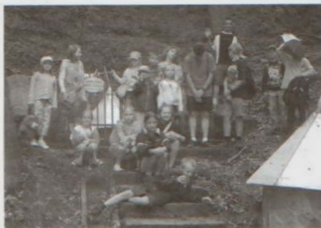
Borek Stary. Przy źródle musimy się spieszyć bo zaczyna padać