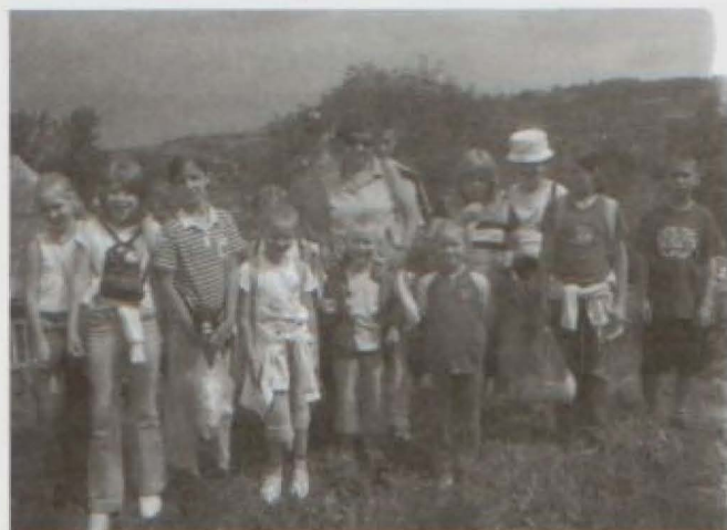
Pulanek. Wędrujemy dalej, zostawiając za sobą deszczowe chmury