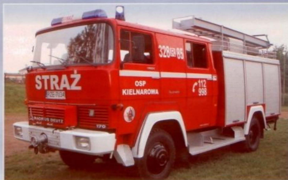
Samochód pożarniczy MAGIRUS DEUTZ FM 170 (1981), ze zbiornikiem na wodę, wyposażony w autopompę i motopompę