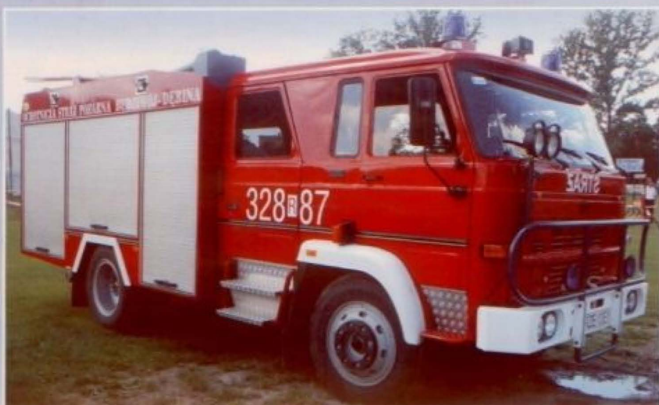
Samochód pożarniczy STAR - 200 (1986, karosaż 2003) ze zbiornikiem na wodę i autopompą

Jednostka jest w posiadaniu sprzętu: samochodu bojowego STAR-200 wyposażonego w zbiornik na wodę 2500 l i autopompę, samochodu pożarniczego ŻUK (1982), motopompy PO-5, agregatu prądowłoczy, działka, drabiny 3-częściowej (2004), agregatu