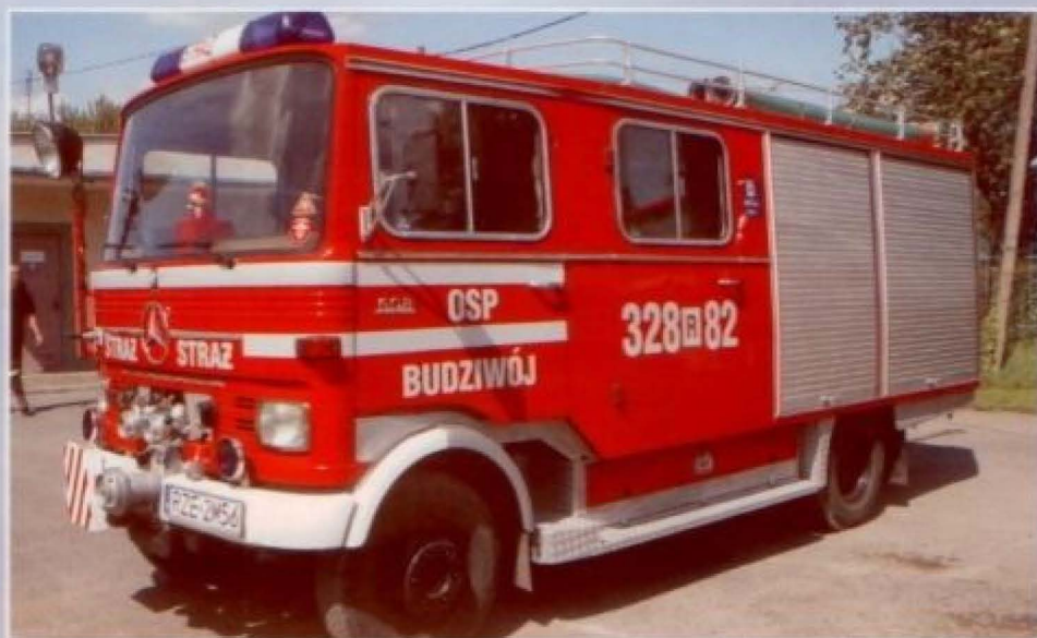
Samochód pożarniczy DAIMLER BENZ 6080 (1974) ze zbiornikiem na wodę, wyposażony w autopompę i motopompę

Jednostka dysponuje samochodem bojowym DAIMLER BENZ GBAM (1974) wyposażonym w autopompę, zbiornik na wodę o pojem-