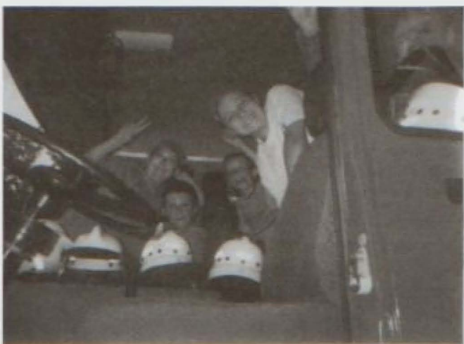
Dzieci w strażackim samochodzie