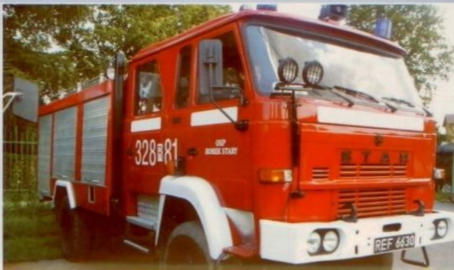
OSP Borek Stary dysponuje samochodem pożarniczym STAR 244 wyposażonym w zbiornik na wodę, autopompę i motopompę