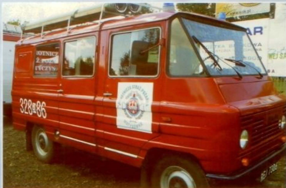
Samochód pożarniczy ŻUK - A06B (1984), lekki, wyposażony w motopompę

Jednostka wyposażona jest w następujący sprzęt: dwa specjalistyczne samochody STAR (1982), DEUTZ HONKER (1990) i samochód operacyjny POLONEZ CARO (1993). Ponadto jednostka posiada przyczepę pod motopompę, pilarkę spalinową HUSQVARNA55 (2000), agregat prądowórczy HONDA-2,2 kW, pompę szlamową PS 1800 (2001), motopompę P-05 (1983), motopompę P-03 (1983), torbę medyczną PSP R1 (2006), radiostację samochodową z anteną (2005) i radiotelefon przenośny Motorola CP160 VHF z ładowarką (2005).