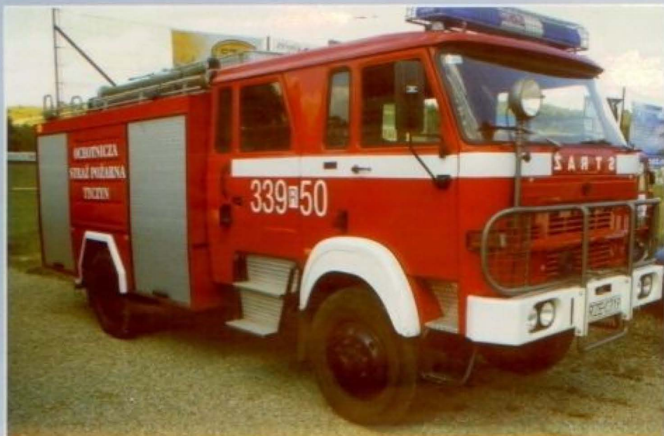
Samochód pożarniczy STAR (1982) ze zbiornikiem na wodę, wyposażony w autopompę i motopompę

Strażacy cieszą się ogólną sympatią mieszkańców: wspierają oni akcje społeczne (np. towarzyszą wolontariuszom Wielkiej Orkiestry Świątecznej Pomocy), uczestniczą w uroczystościach środowiskowych i kościelnych oraz pełnią rolę służb porządkowych podczas dużych imprez kulturalnych.