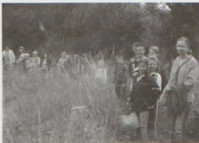
Wszyscy w komplecie, ruszamy chociaż pogoda niezbyt dopisała