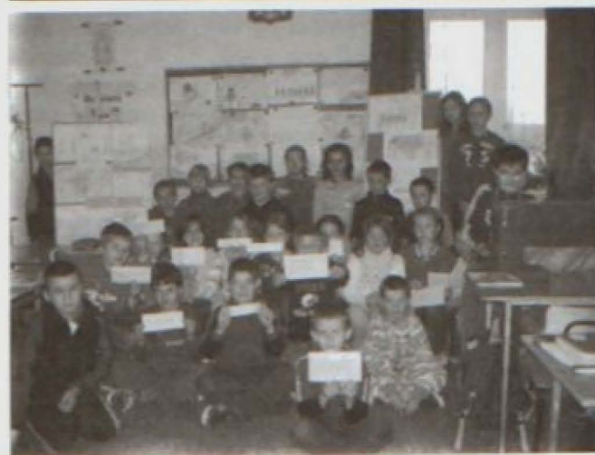
Prezentacja projektu „Niestraszna nam ortografia”

oraz część rodziców. Do efektów pracy należą m.in. tomiki wierszy, program poetycko - muzyczny „Od smutku do radości”, plakaty, zbiór ortograficznych rymowanek, rysunków i dyktand. Nauczycieli opiekunów cieszyła przede wszystkim panująca wśród uczniów atmosfera wspólnego działania i przeżywania radości z sukcesów.