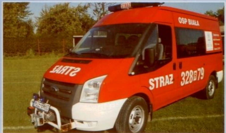
Samochód pożarniczy FORD TRANSIT (2006), lekki, wyposażony w motopompę