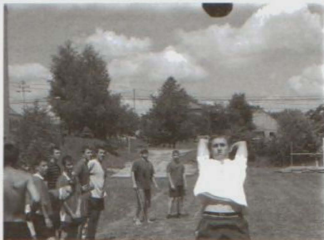
Rzut piłką lekarską

Dużym powodzeniem cieszyły się konkurencje siłowe. Nic dziwnego, skoro w spartakiadzie brali udział sami chłopcy.