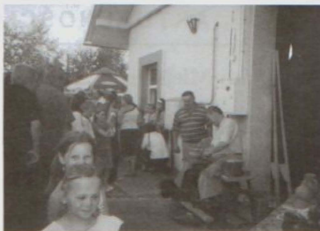
„Nie święci garnki lepią”