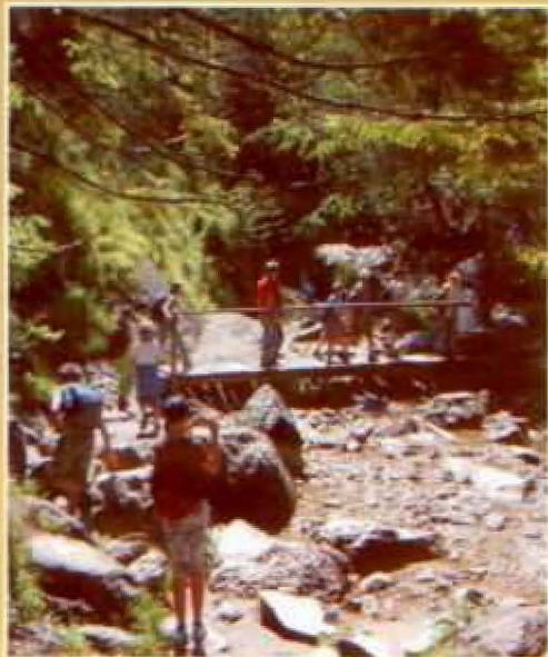
Piłnie liczyliśmy mostki nad wąskim potokiem płynącym wąwozami i podziwialiśmy skaliste zbocza