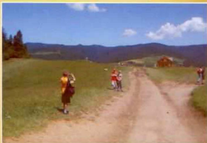
Ze szczytu Palenicy Pieniny nie są już tak wysokie