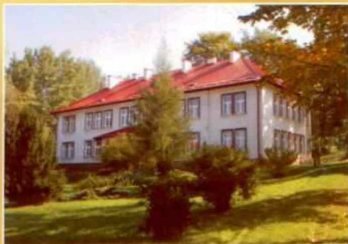
Szkoła Podstawowa w Matysówce

Szkoła Podstawowa w Matysówce jest jedną z siedmiu szkół podstawowych na terenie naszej gminy. W bieżącym roku szkolnym uczęszcza do niej 106 uczniów - 14-ro dzieci do „zerówki” i 92 uczniów do klas I-VI. Pracuje tu 15 nauczycieli, ale tylko 7 z nich na pełne etaty, pozostali realizują ich część, łącząc często pracę w kilku szkołach.