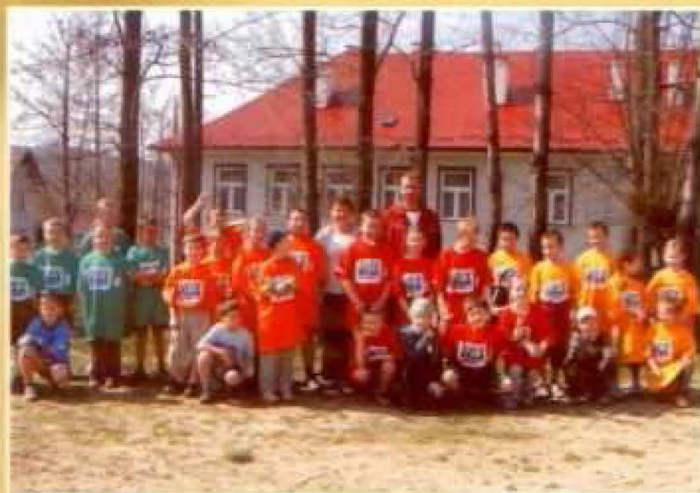
Wszyscy uczniowie uczestniczyli w akcji „Rusz się człowieku”

> Od kilku lat podejmujemy wysiłki aby stać się jedną ze „Szkół Promujących Zdrowie”. W ramach tych starań realizujemy w każdym roku szkolnym specjalne programy prozdrowotne i profilaktyczne.