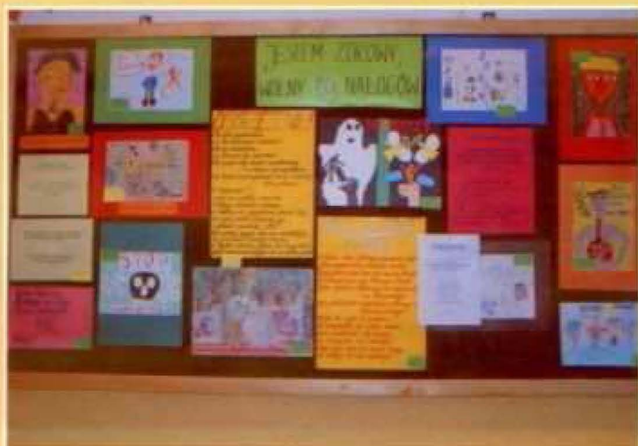
Uczestnicy konkursów prezentują swoje wiersze i prace plastyczne

Od stycznia uczniowie klasy piątej brali udział w programie profilaktyki chorób sercowo-naczyniowych „Szansa dla Młodego Serca”. Projekt ten powstał na zlecenie Ministerstwa Zdrowia, aby uświadomić młodzieży, na czym polega zdrowe żywienie, jakie znaczenie ma wysiłek fizyczny, dlaczego palenie jest szkodliwe i jak radzić sobie ze stresem. Nasza szkoła była jedną z czterech szkół na Podkarpaciu, które realizują program „Szansa dla Młodego Serca”. Na zajęciach uczniowie poznawali zagadnienia dotyczące budowy i fizjologii serca oraz układu krążenia, czynników wpływających na powstawanie chorób sercowo-naczyniowych oraz sposobów na zmniejszanie ryzyka zachorowania na te choroby, na które co roku umiera wielu mieszkańców naszego kraju. 30 stycznia nasze zajęcia z cyklu „Szansa dla Młodego Serca” filmowała ekipa regionalnego oddziału Telewizji Polskiej.