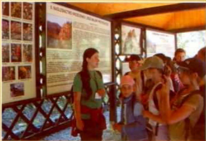
Pani przewodnik opowiada nam o cudach przyrody wąwozu Homole i Pienińskiego Parku Narodowego

Starsi uczniowie poznali malownicze Pieniny. Przeszli Wąwozem Homole podziwiając piękno przyrody, po czym zwiedzili baczówkę, gdzie mogli obserwować jak wyrabia się oscypki, a później zeszli do Jaworek by odwiedzić muzyczną owczarnię, miejsce spotkań i koncertów wielu wybitnych muzyków, nie tylko z Polski.