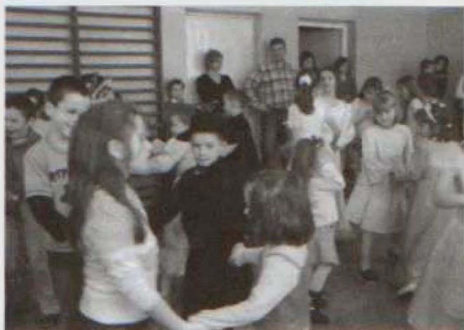
Tańce i pląsy są nieodłącznym elementem szkolnych zabaw

W ubr. realizowaliśmy też program „Żyję zdrowo, bez nalogów”. Miał on na celu propagowanie wśród uczniów zdrowego stylu życia; zwiększanie świadomości zagrożeń wynikających z picia alkoholu, palenia papierosów; kształtowanie zachowań asertywnych; rozwijanie odpowiedzialności za siebie i innych; umiejętności podejmowania „zdrowych” decyzji. Zorganizowaliśmy wówczas dla uczniów wiele konkursów, zajęć ruchowych, turniejów i rozgrywek sportowych na wolnym powietrzu. Korzystając z pięknej aury chodziliśmy na spacer i wycieczki. Dzieci ze świetlicy zaprosiły do wspólnej zabawy na Święcie Pieczonego Ziemniaka uczniów z Zespołu Szkół Muzycznych Nr 1 z Rzeszowa. Przy ognisku i wórze gitary razem śpiewali piosenki, dużych emocji dostarczyły zabawy i konkursy, a na koniec ze smakiem zjedli upieczone kielbaski i ziemniaki.