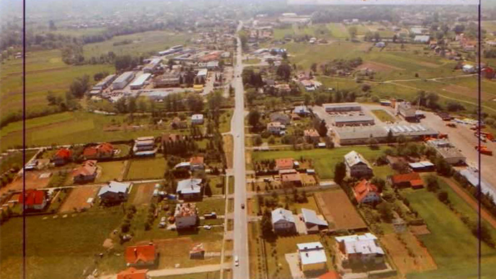
Droga wojewódzka Rzeszów-Dynów-Przemysł z widokiem na strefę przemysłową Biała-Tyczyn