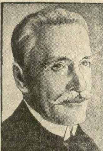
Prezydent Rzplitej Prof. Ignacy Mościcki

zatem zasługa, jeżeli mimo to Prezydent Mościcki zdołał w ciągu minionego siedmioletnia nie tylko pozyskać sobie powszechne uznanie, ale również autorytet sprawowanej przez się godności wzniesić na poziomy, do których żadna małostkowość dotrzeć nie może. Bo w tym wyjątkowym człowieku skupiły się takie właściwości, jak z jednej strony niezwykła prostota formy i przystępność — a z drugiej wielki dystans powagi i autorytetu, jaki cechować musi osobistość, symbolizującą Zwierzchnią Władzę w Republice.