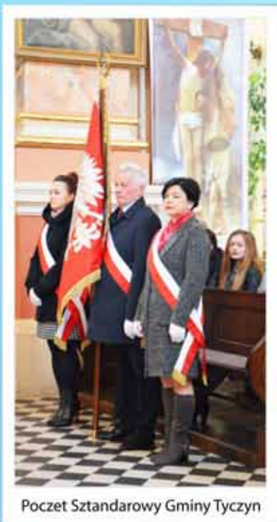
Poczet Sztandarowy Gminy Tyczyn