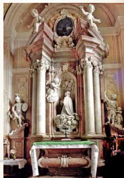
Ołtarz w kaplicy św. Stanisława