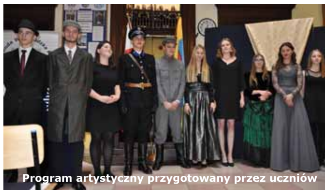
Program artystyczny przygotowany przez uczniów

Pałacowe wnętrza wypełnili goście: przedstawiciele władz samorządowych, władz województwa podkarpackiego i sejmiku wojewódzkiego, przedstawiciele władz gminnych oraz instytucji oświatowych i kulturalnych z Tyczyna, funkcjonariusze Komendy Wojewódzkiej Policji w Rzeszowie oraz wszystkich komend powiatowych Policji z Podkarpacia. Byli także obecni przedstawiciele Komendy Głównej Policji, innych służb mundurowych oraz Instytutu Pamięci Narodowej.