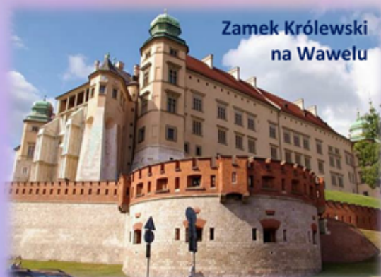
Zamek Królewski na Wawelu

Musiało upłynąć długich 31 lat, by Jagiełło (już wtedy niemłody, bo 69-letni) i Elżbieta mogli się pobrać. Pierwsza żona króla – Jadwiga – zmarła niedługo po porodzie, druga – Anna – również. Na trzecią żonę władca upatrzył sobie córkę swojej matki chrzestnej – Elżbietę , która miała za sobą trzy małżeństwa (jej mężowie szybko umierali). Elżbieta nazywała się Granowska (było to nazwisko jej trzeciego męża).