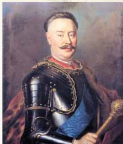
Jan Klemens Branicki - ostatni z rodu herbu Gryf, właściciel Tyczyna, z inicjatywy którego przebudowano gruntownie w II połowie XVIII w. kościół parafialny.

Według historyków tyczyński zespół kościelny (kościół, dzwonnice, ogrodzenie z bramami, wikarówka i „stara plebania”) jest najbardziej znaczącą w Małopolsce fundacją architektoniczną Jana Klemensa Branickiego.