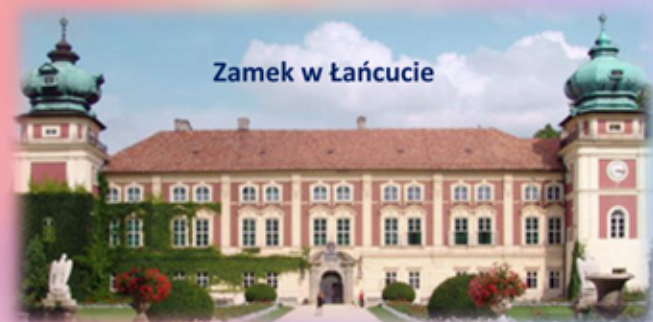
Zamek w Łańcucie

W 1417 r. król Jagiełło wybrał się w podróż do Łańcuta, by spotkać się ze swoją narzeczoną Elżbietą. W Tycynie zrobił postój, by odpocząć i odświeżyć się przed wizytą u rodziny narzeczonej. Istnieje legenda, która głosi, że władca zatrzymał się w tyczyńskim dworze, a orszak królewski liczył kilkanaście wozów i bryk oraz 50 rycerzy na koniach. Cały Rynek w naszym miasteczku zajęła służba króla.