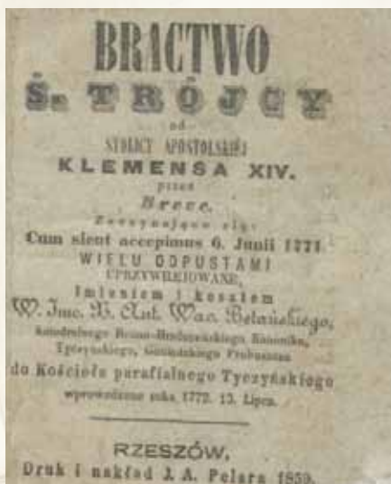
Modlitewnik Bractwa Św. Trójcy.

► 26.05.1782 – W uroczystość Św. Trójcy ks. pro-