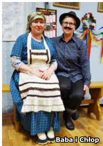
Baba i Chłop