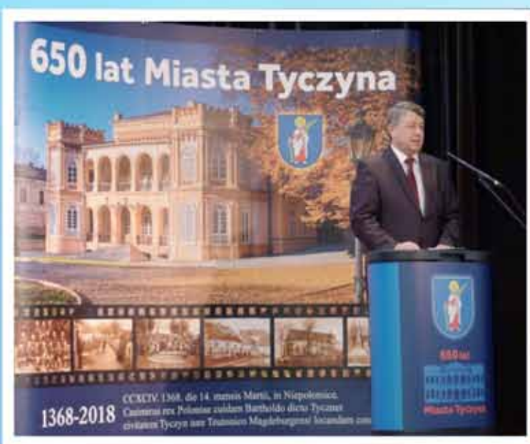
14 marca 2018 r. , Rozpoczęcie uroczystej sesji popularno-naukowej pt. „Mieszkańcy, rody, zdarzenia, czyli 650 lat Tyczyna w świetle badań historycznych”.