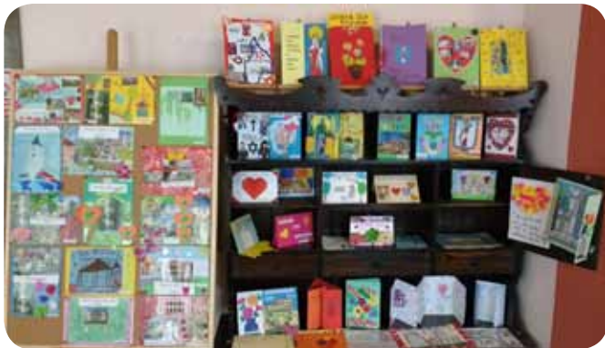
Wszystkie prace można było obejrzeć podczas sesji popularno-naukowej z okazji 650-lecia Tyczyna

W gronie uczniów z klas pierwszych SP w Tyczynie 1. miejsce otrzymała Łucja Czeranowska , 2. miejsce - Gabriela Stach , 3. miejsce - Weronika Malak . W grupie uczniów klasy drugiej SP w Tyczynie 1. miejsce zdobył Jan Pelczar , 2. miejsce - Wiktor Tłuczek ,