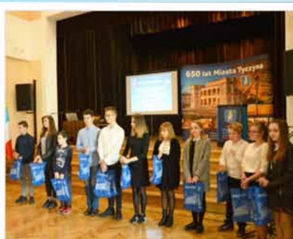
Nagrodzeni uczniowie w konkursach wiedzy: „Co wiemy o 650-letnim grodzie?” oraz „Patroni naszych ulic”