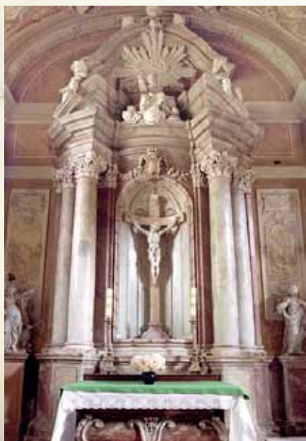
Ołtarz w kaplicy Św. Trójcy

► 1850, 1890-1911 – Odnowienie kościoła. Został