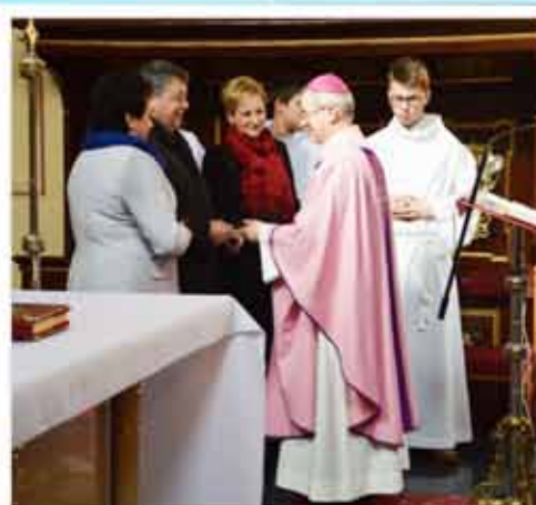
Ks. biskup Jan Wątroba otrzymał w darze od pracowników Urzędu Miejskiego pamiątkową ikonę