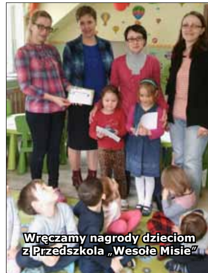
Wręczamy nagrody dzieciom z Przedszkola „Wesołe Misie”