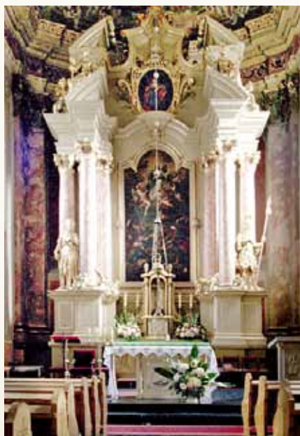
Główny ołtarz kościoła