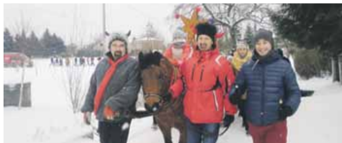
Korowód był barwny i towarzyszył mu radosny śpiew.