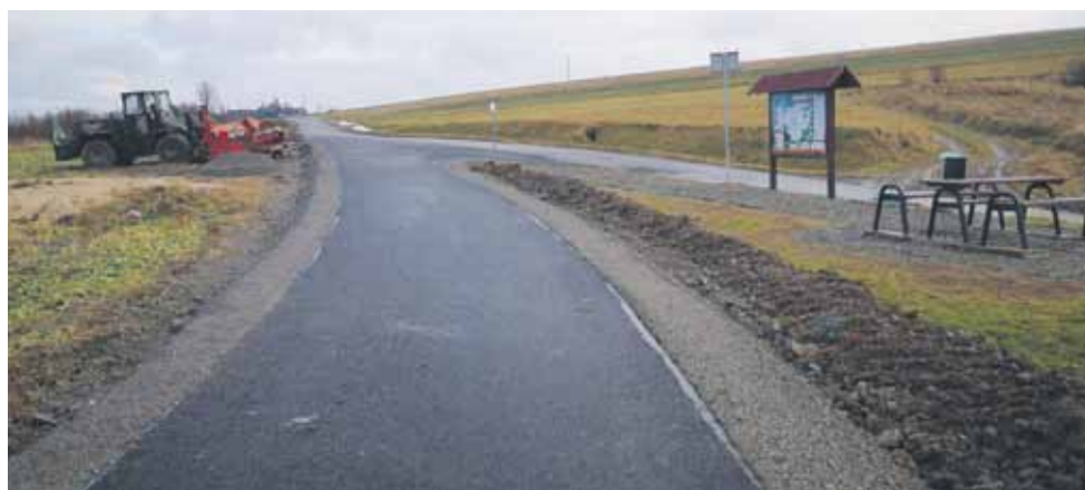
Na zdjęciu droga „Pod Gaj” w Handzlówce

Przy drodze „Pańska” w Rogóźnie na długości 990 m odmulano rowy i umacniano ich korytkami i płytami ażurowymi oraz uzupełniano pobocza – również przy dofinansowaniu z budżetu państwa.