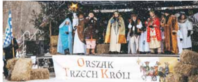
Na zakończenie aktorzy zaśpiewali pieśń „Proszę wyjdź”, dziękując tym samym wszystkim za udział.