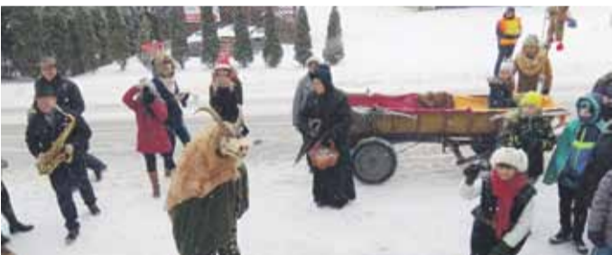
KRACZKOWSKI Orszak Trzech Króli.