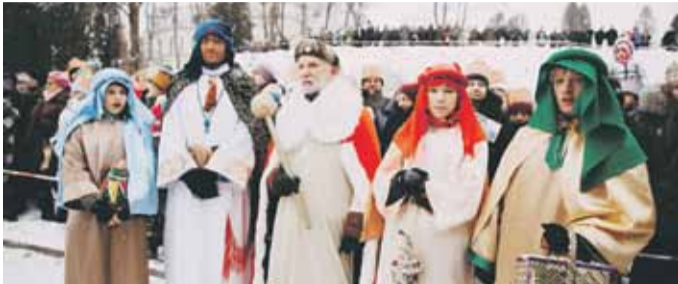
KOSINA W poszukiwaniu Dzieciątk Jezus, podczas wspólnego kolędowania, zarówno Królowie jak i uczestnicy Orszaku, podziwiali przygotowane przez aktorów inscenizacje.