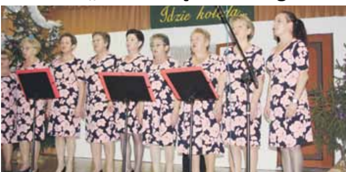
Po raz XIV w Rogóźnie 6 stycznia odbyło się spotkanie Zespołów Śpiewaczych pn. „Idzie kolęda”.