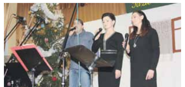
Wszyscy wykonawcy zaprezentowali na scenie po trzy piękne polskie kolędy i pastorałki. Udział w wydarzeniu wzięli przedstawiciele gminy Łańcut i Rogóżna oraz licznie zgromadzona miejscowa publiczność.