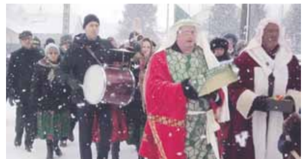
Ze śpiewem kolędy „Mędrcy świata” orszak udał się do Kościoła parafialnego, aby tam wspólnie pokłonić się Maleńkiej Dziecinie.