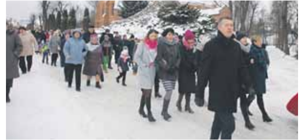
Po Mszy św. wszyscy przeszli do Ośrodka Kultury, gdzie odbyła się krótka część artystyczna.