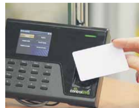
Na zdjęciu czytnik kart

Wraz z rozpoczęciem nowego roku w Urzędzie Gminy Łańcut zaczął funkcjonować elektroniczny system ewidencji czasu pracy.