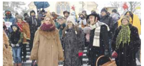
W Orszaku wzięło udział wielu mieszkańców.