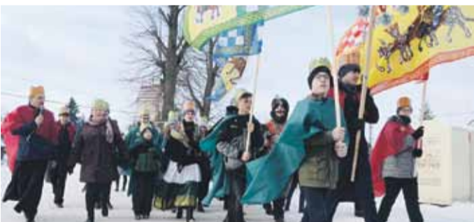
SONINA W orszaku wzięło w udział kilkaset osób ubranych w peleryny koloru: zielonego, granatowego i czerwonego z koronami na głowach.