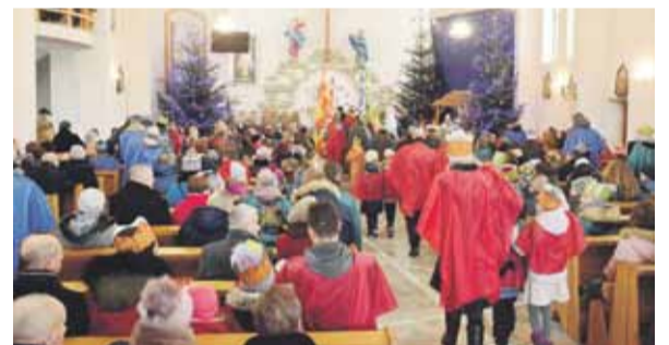
Piękne widowisko, piękny korowód, przeżycie dla każdego uczestnika.