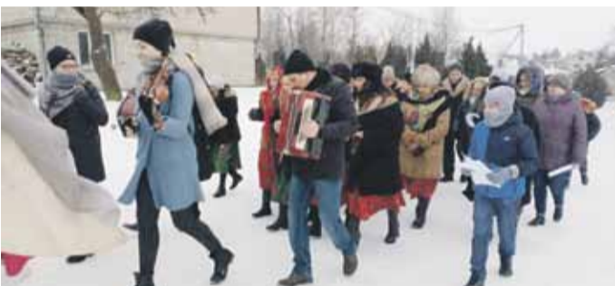
ROGÓŻNO 6 stycznia o godzinie 9.30 wyruszył od Domu Strażaka barwny Orszak Trzech Króli.