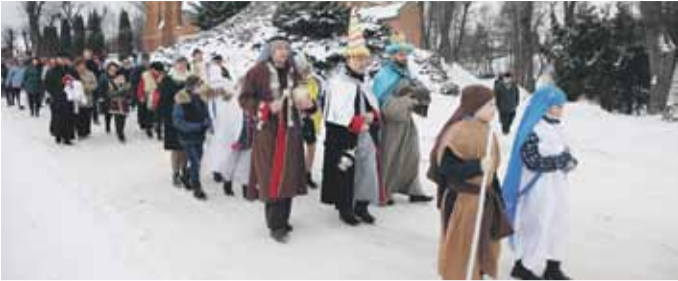
ALBIGOWA Pierwszy albigowski Orszak rozpoczął się uroczystą Mszą św.