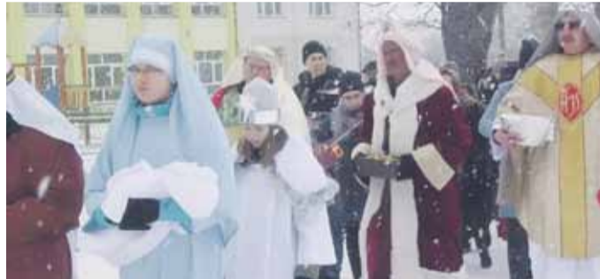
Przy muzyce i śpiewie kolęd wędrowali uczestnicy ulicami wioski.