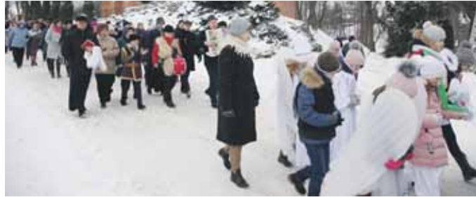
Uczestniczyli w niej – oprócz Trzech Króli i licznie zebranych parafian – również Kolędnicy Misyjni.