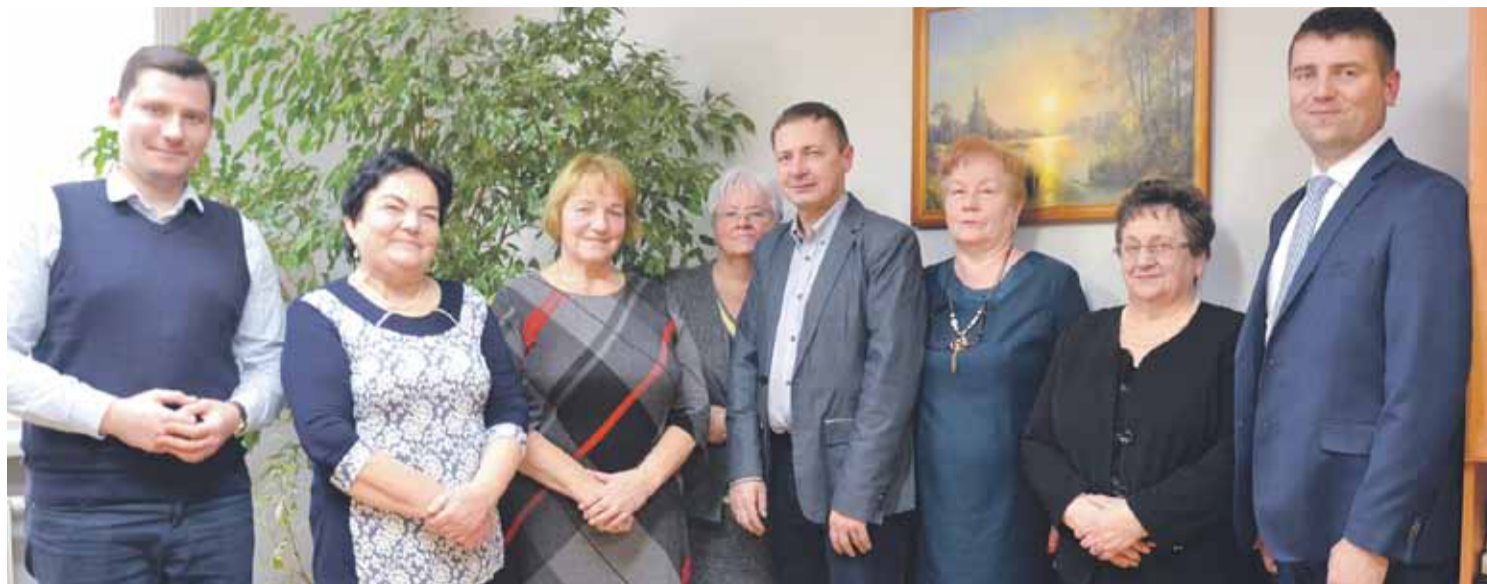
Seniorzy zawiązali Stowarzyszenia Seniorów Gminy Łańcut „Aktywny Senior”

03.01.2019 r. uzyskaliśmy swoją siedzibę pod adresem Wysoka 49. W każdy pierwszy wtorek miesiąca pod tym adresem będzie pełniony dyżur przez członków Rady w godz. 10.00-13.00 w siedzibie Centrum Kultury Gminy Łańcut.