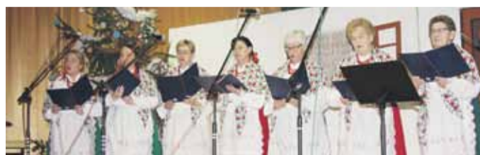
Wzięły w nim udział zespoły: wokalny ze Szkoły Podstawowej w Rogóźnie, śpiewacze „Rogóżnianki”, śpiewacze „Nasturcje” z Głuchowa, śpiewacze „Czerwone korale” z Cierpisa, śpiewacze Klubu Seniora z Wysokiej, kapela „Wysoczanie” z Wysokiej, zespół śpiewaczy z Husowa (gm. Markowa), śpiewacze z Markowej (gm. Markowa). Swój debiut sceniczny miała wokalna grupa z Rogóźna.