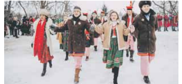
Odtańczony został także stary ojczysty taniec, jakim jest Polonez.