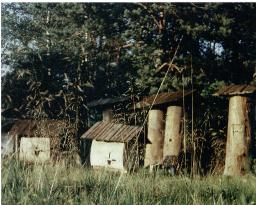
Ule kładowe w skansenie kolbuszowskim