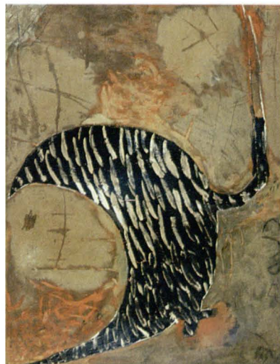
Prace Ryszarda Dudka (repr. 1) i Kacpra Dudka obejrzymy w BWA