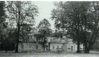
Stocina — Zespół dworsko-parkowy