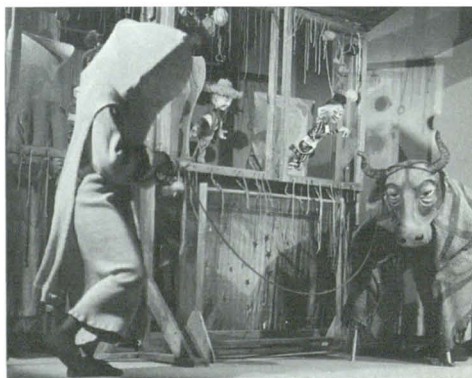
Scena ze spektaklu „ Miłość, która rozpala Gwiazdy ” w TLiA „ Kacperek ” (premiera 12.10.97)

Teatr gościł od 27–31 października w Padeborn (Niemcy), prezentując w ramach odbywających się w tym okresie Dni Kultury Polskiej przedstawienie Czar Pana Twardowskiego Macieja K. Tondery. (Padeborn jest miastem partnerskim Przemysła, na którego zaproszenie Teatr gościł w Niemczech).