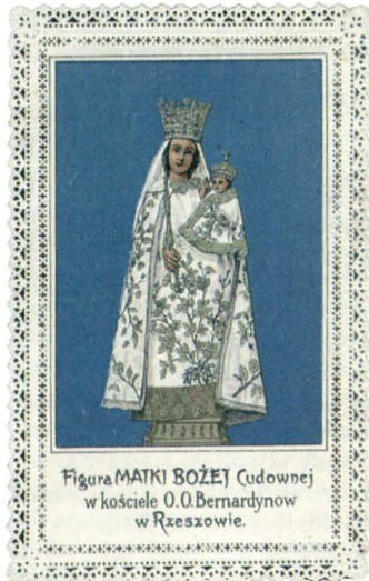
Figura MATKI BOŻEJ Cudownej w kościele O.O. Bernardynów w Rzeszowie.