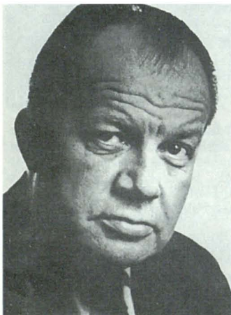
Wybitny polski dyrygent Jerzy Katlewicz poprowadzi koncert 19 grudnia

Na koncercie wystąpi wielki śpiewak ANDRZEJ HIOLSKI. W jego mistrzowskiej interpretacji posłuchamy G. Mahlera cykl pieśni Liedes eines fahrenden Gesellen . Artystę towarzyszyć będzie Orkiestra Filharmonii Rzeszowskiej p/d ADAMA NATANKA. W programie ponadto Symfonia 44 J. Haydna i Symfonia d-moll C. Francka.