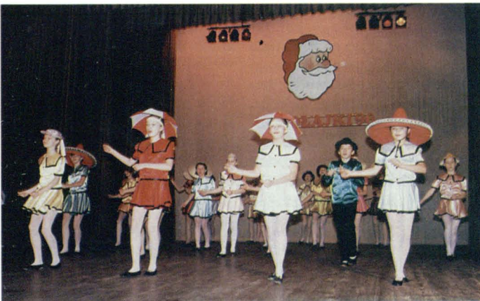
Mikołajkowy Przegląd Zespołów Tanecznych, org. corocznie przez WDK, cieszy się ogromną popularnością

Proponowany rodzaj zagospodarowania: cele mieszkalne, usługowe