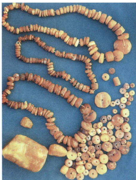
Bursztyny — IV—V wiek n.e. z osady w Swilczy koło Rzeszowa