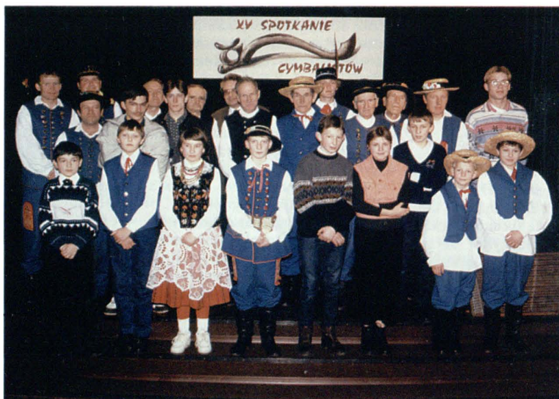
Uczestnicy Spotkań Cymbalistów w 1996 r.; tegoroczna edycja — 14 grudnia

Kolejna edycja Spotkań , gromadząca muzyków ludowych-cymbalistów z naszego regionu, służyć będzie podtrzymaniu tradycji i umiejętności muzykowania na tym oryginalnym instrumencie. Przyznawane nagrody „mistrzom i uczniom” — honorują najlepszych i najstarszych muzyków, a także promują ich uczniów.