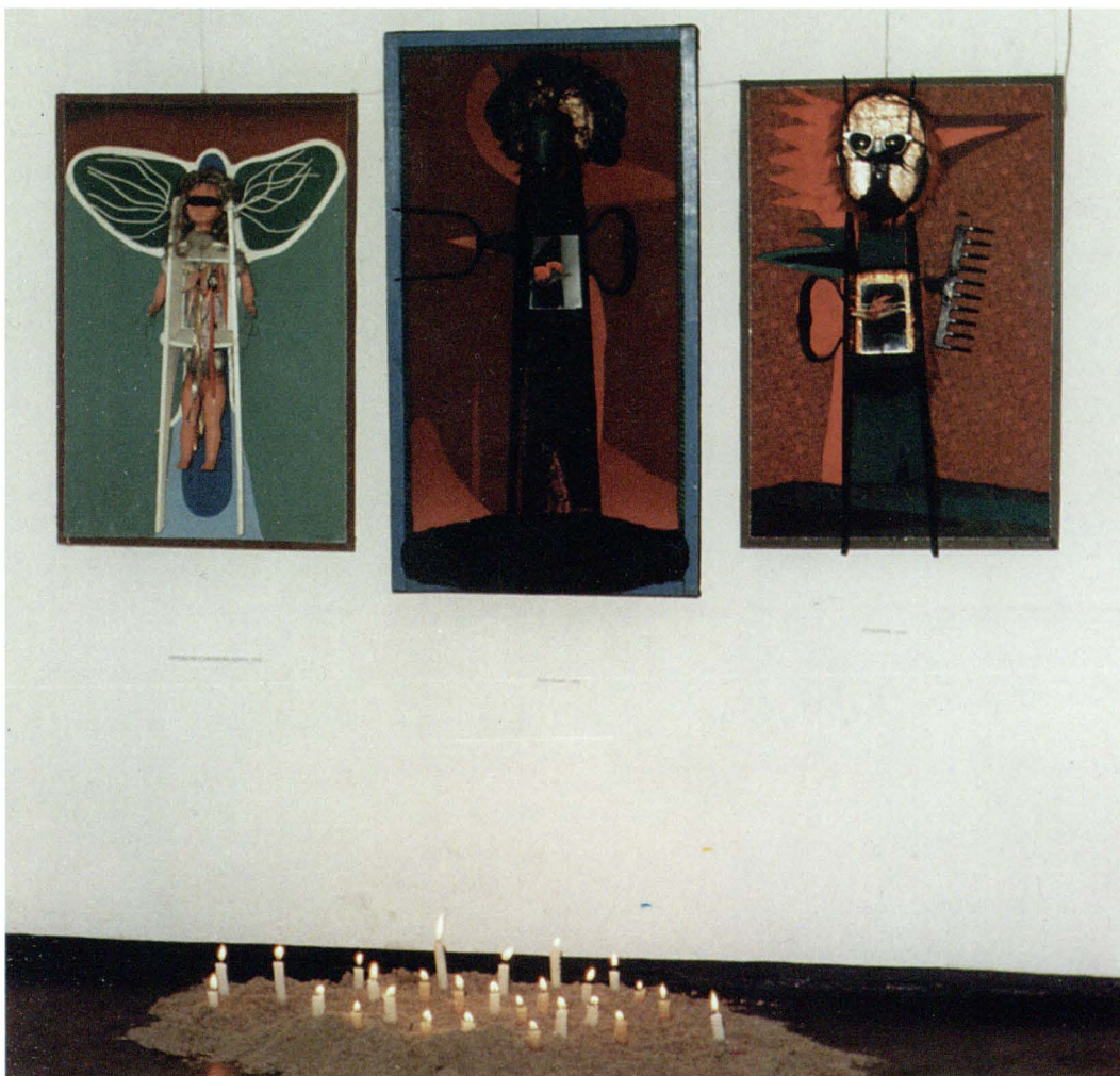
Z wystawy prac Władysława Hasióra

Czynna codziennie, z wyjątkiem poniedziałków, w godz. od 10.00—13.00 i 17.00—20.00.