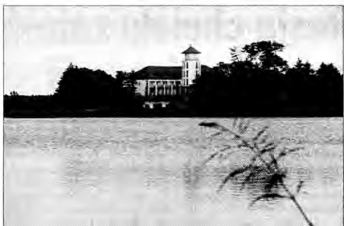
Zamek nad zalewem w Zaklikowie jest perełką turystyczną w pow. stalowowolskim.

Na wieży załopoce flaga z maltańskim krzyżem