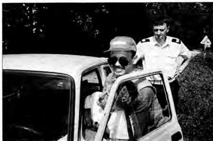
Porozowany wypadek podczas ubiegłorocznej edycji zlotu.

Patronat medialny sprawują „Nowiny” i Radio „Leliwa”. AS