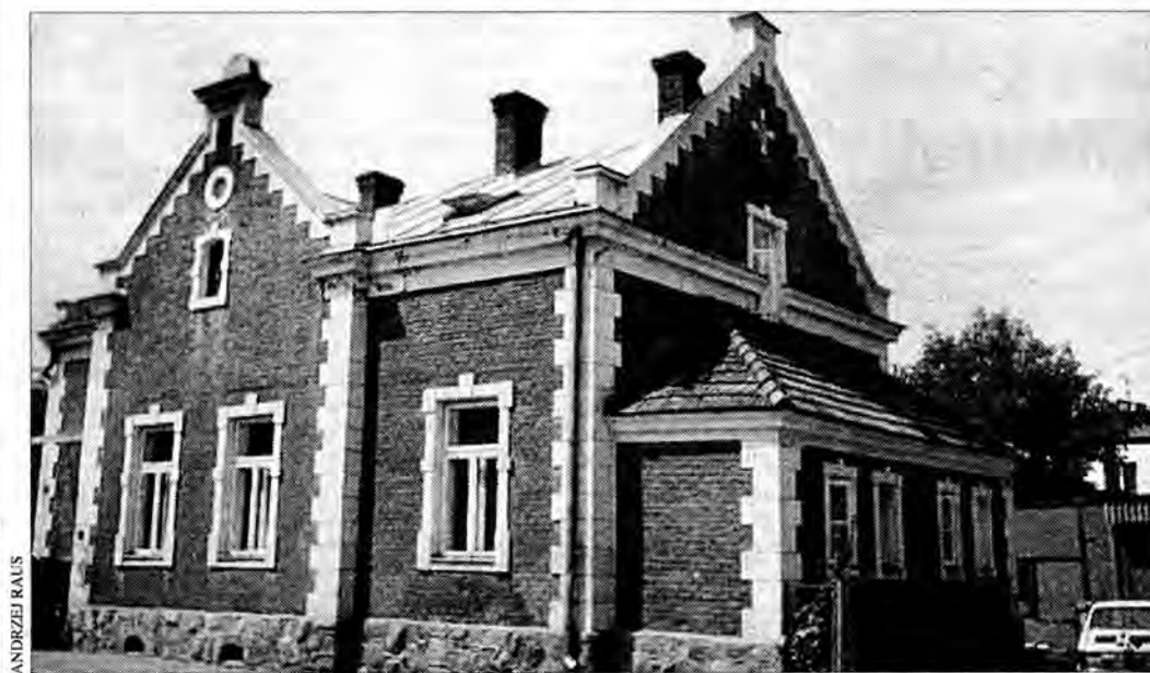
Stare krośnieńskie kamieniczki, jak chociażby ta przy ul. Lewakowskiego, mają swój niepowtarzalny urok.