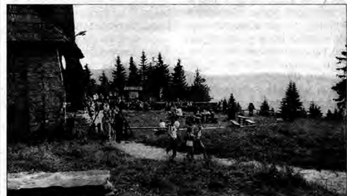
Spod schroniska PTTK na Turbacz widać Kotlinę Nowotarską, pasmo Radziejowej, Lubania, Kudłoń, czasem Tatry

„Co jest na szczycie! Dokąd droga wiedzie! Tylko błękit nieba! W nieskończoności wielkiej” – krzyż pod szczytem Turbacza.