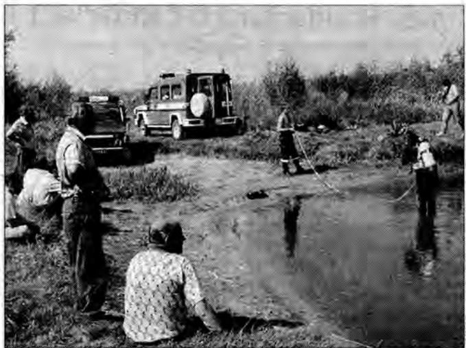
Ciała topielca poszukiwali nurkowie z przemyskiej JRG PSP