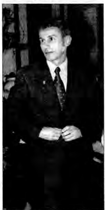
Taki rodak to powód do dumy.

O trzykrotnym złotym medalistcie – z Atlanty i ostatnich Igrzysk w Australii – nie zapomnieli także w Oleszycach. – Na najbliższej sesji Rady Miasta i Gminy,