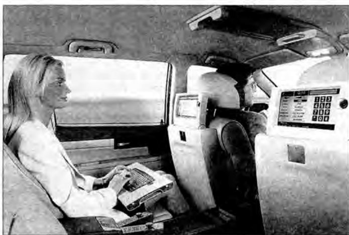
Komputer, Internet, telefon komórkowy... to wszystko musi się znaleźć na pokładzie samochodu XXI wieku.

Wraz z rozwojem konstrukcji piękniały też wnętrza samochodów. Zabudowywano je nie tylko superwygodnymi kanapami. Truszczono się o to, by dżentelmen miał pod ręką w podróży np. stolik, na którym mógł postawić butelkę szampana, a dama flakonik z bukiecikiem róż. Wnętra niektórych samochodów są w tym