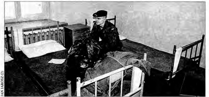
Przed nim 52 tygodnie służby w 14. BOT

Zanim wejdzie pod prysznic, trzeba zdać rzeczy osobiste, pobrać koszulkę khaki, granatowe spodnie i pantofle nocne, czyli laczki. – Każdy, bez wyjątku, musi się obmyć z cywila – zaznacza kapral Salach. – Woda ciepłutka.