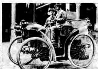
Pierwsze samochody zapewniały minimum komfortu podróżowania.

Wnętra nowoczesnych samochodów pełnią często rolę ga-