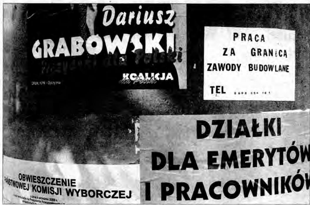
Posезonowa obniżka cen?