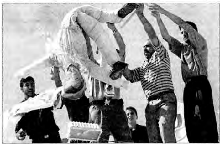
Środowe starcia na Zachodnim Brzegu wybuchły mimo usilnych starań międzynarodowych o położenie kresu fali przemocy. Na zdj.: protestujący Palestyńczycy palą kukłę Ehuda Baraka.

Prezydent Egiptu Hosni Mubarak, który też miał uczestniczyć w proponowanym przez Waszyngton nowym izraelsko-palestyńskim spotkaniu, odrzucił w środę propozycję goszczenia uczestników szczytu podkreślając, że najpierw musi zaistnieć odpowiedni klimat, jaki można osiągnąć przez wycofanie izraelskich żołnierzy z terytoriów palestyńskich. PAP, IP