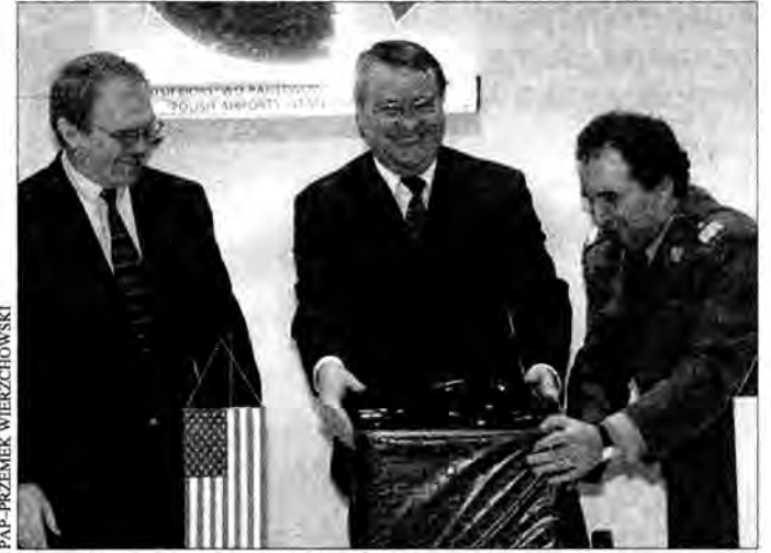
Urządzenia trafiają na granicę wschodnią i polsko-słowacką.

Jak poinformowała Straż Graniczna w Świecku, rozładowanie kolejki może zająć kilka dni. PAP, MC