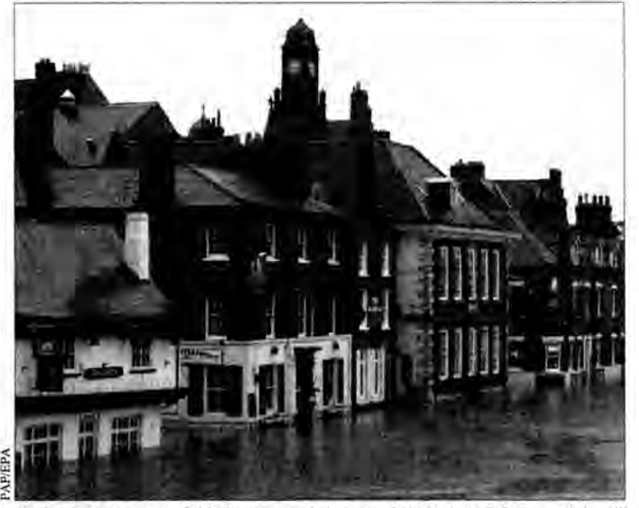
Zalane przez powódź domy w miejscowości York w północnej Anglii