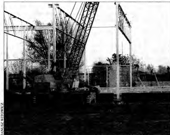
W połowie 2001 r. Leclerc przyjmie pierwszych klientów.