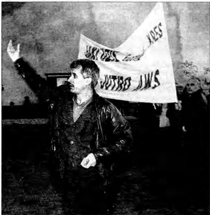
Pracownicy „Łuczniaka” protestują przed siedzibą zarządu „Solidarności” po ogłoszeniu upadłości.