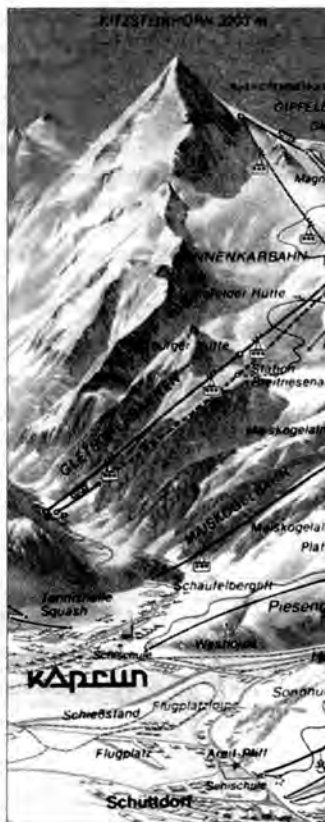
Mapka Kaprun-Zell am See. Linia przerywaną zaznaczono tunel kolejki.

Odpowiedzi na te pytania nie znają także Austriacy. Erik Wolf, szef związku pracowników kolei linowych, nie znajduje wyjaśnienia tragedii z Kitzsteinhorn. – Kolejki linowo-szynowe to najstarszy typ kolei linowych, uchodzący za najbezpieczniejszy. W Kaprun szczególną uwagę zwracano zawsze na sprawność techniczną kolejki.