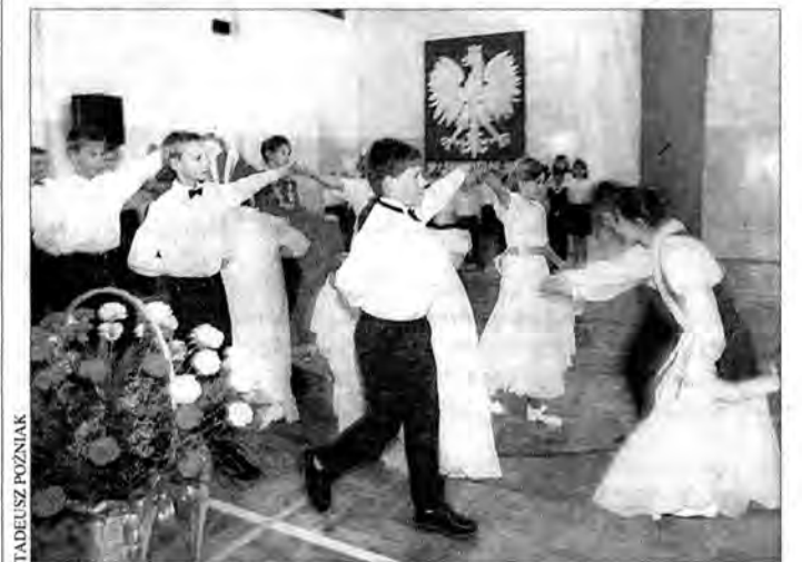
Uczniowie tańczyli poloneza z „Pana Tadeusza”.