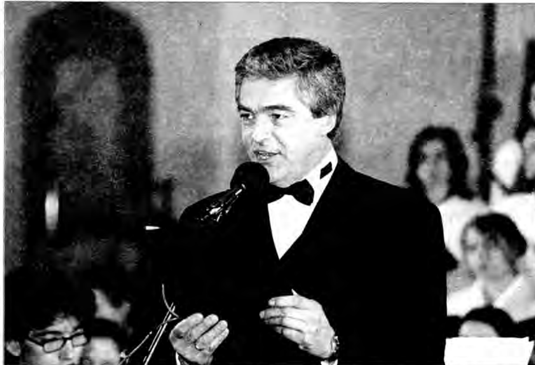
Mszą św. i programem poetycko-muzycznym w katedrze rzeszowskiej rozpoczęły się w niedzielę Dni Kultury Chrześcijańskiej. Wśród wykonawców znalazł się m.in. znany aktor Leszek Teleszyński (recytacje).

Fundusze na imprezę przekazała Wspólnota Europejska oraz Fundacja im. Stefana Batorego oraz Przedsiębiorstwo Wodociągów i Kanalizacji w Przemyślu. nz