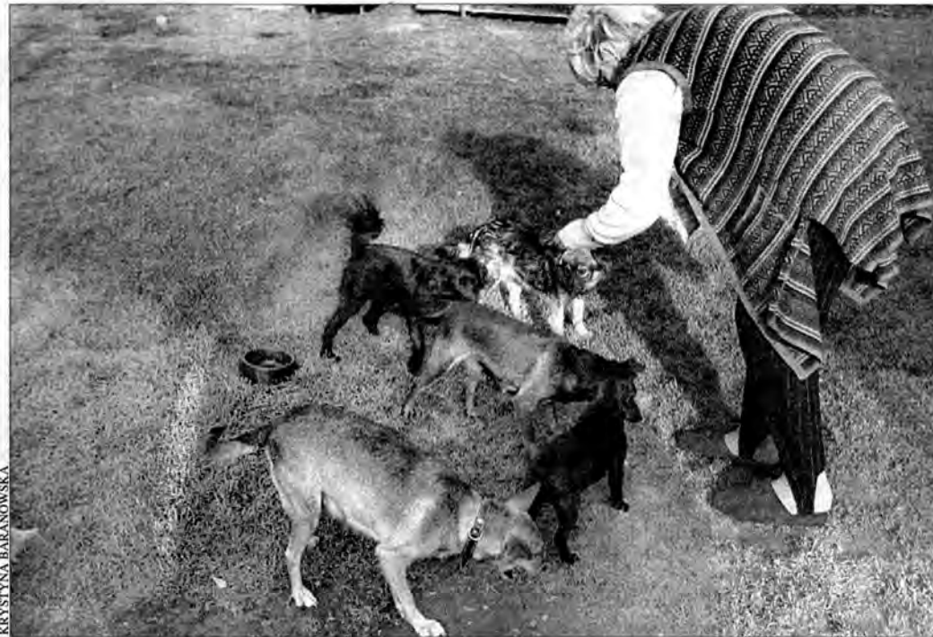
Z rzeszowskich ulic znikną bezpańskie czworonogi.