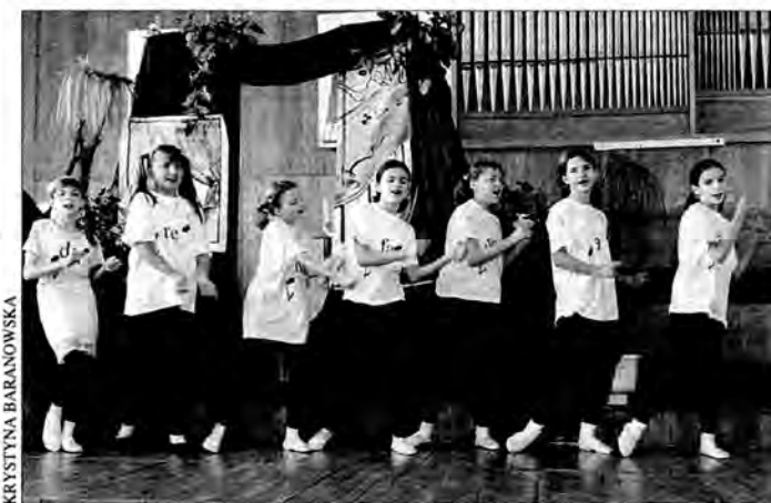
Dzieci królowej Gamy w popisowym tańcu.