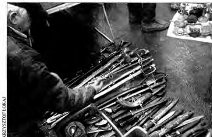
Na rzeszowskiej giełdzie staroci można znaleźć także wykopaliska archeologiczne i wydobyte spod ziemi militaria. Wszystkie te przedmioty należą do Skarbu Państwa.