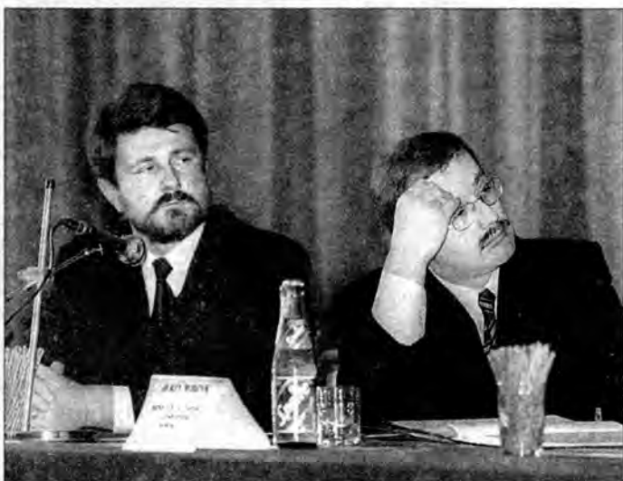
Marszałek Bogdan Rzońca i minister Jerzy Widzyk