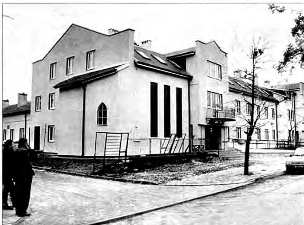
Wczoraj do świeżo oddanego budynku przy ul. Dmowskiego wprowadzili się pierwsi pensjonariusze.

Dezaprobatę wyraził m.in. Zarząd Koła Miejskiego nr 1 Polskiego Porozumienia Chrześcijańskich Demokratów. – Pragniemy zaprzeczyć opinii przedstawionej w mediach przez prezydenta Przemysła, jakoby o powołaniu członków rad nadzorczych miała decydować Rada Miejska. Z przepisu prawa wyraźnie wynika, że decyzję w tej sprawie podejmuje Zgromadzenie Wspólników, czyli Zarząd Miasta – czytamy w uchwale. wac