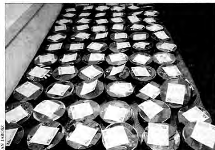
Celnicy i Straż Graniczna robią co mogą, aby skutecznie ochraniać rynek fonograficzny w Polsce przed napływem ze Wschodu pirackich płyt.

Nadleśnictwo w Birczy bada sprawę. W niedługim czasie powinno być znany wynik czynności wyjaśniających, jakie prowadzi Straż Leśna. Czynności w tej sprawie prowadzi również ustrzycka policja. Wczoraj dowiedzieliśmy się nieoficjalnie, że to nie jedyne w tej okolicy miejsce z wyciętymi w ten sposób drzewami.