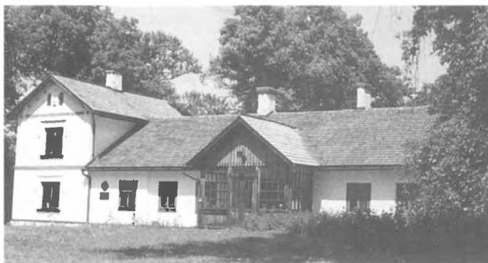
Żarnowiec – Muzeum Marii Konopnickiej

MUZEUM MARII KONOPNICKIEJ W ŻARNOWCU 38-460 Jedlicze tel. (0-13) 43-52-013