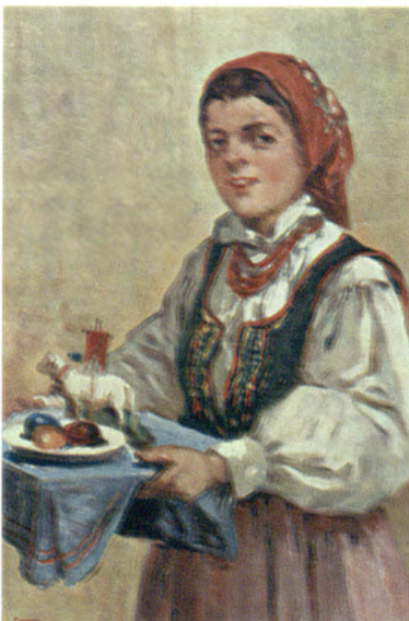
Karta wielkanocna z 1913 r.

Jako symbole życia pisanki miały zastosowanie w rozmaitych praktykach. Podczas święcenia pól zakopywano je w zagony, by ziemia rodziła; skorupki wieszano w sadzie na drzewach, by dobrze owocowały; żółtko dawano do ziarna siewnego, aby wyrosło ładne zboże. Pisankami także rewanżowały się dziewczęta chłopcom za oblanie wodą. I nie był to tylko