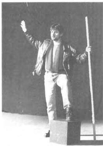
Teatr „TATA” z Brzozowa otrzymał Srebrny Róg w tegorocznej Biesiadzie Teatralnej w Horyńcu Zdroju