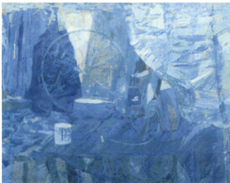
Jadwiga Szmyd-Sikora, „Utramaryna”

Wystawy czynne codziennie, oprócz poniedziałków, w godz. 10.00–17.00. W środy wstęp wolny.