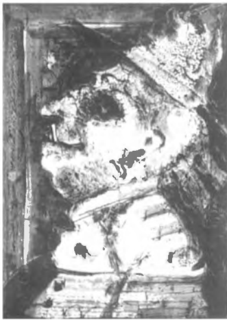
Józef Szajna: Filuś z zapalkami, Smrodek: z wystawy w „GĘBY-MASKI”

Stala wystawa prac plastycznych prof. Józefa Szajny: prezentuje collages, malarstwo i ry-