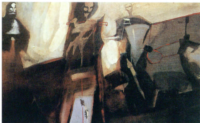
Stanisław Białogłowicz, „Pejzaż do wyczerpania” (z wystawy w rzeszowskim BWA, podobnie jak reprodukcja na sąsiedniej stronie)

Wystawa prac pedagogów Instytutu Wychowania Plastycznego Wyższej Szkoły Pedagogicznej w Rzeszowie.