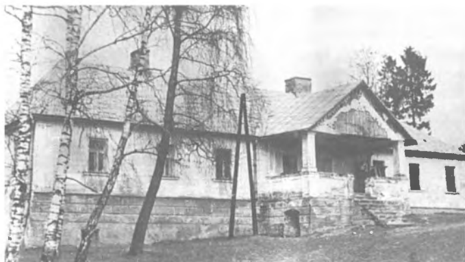
Błażowa – zespół dworsko-palacowy

Dwór wraz z parkiem zlokalizowany jest w centrum Błażowej, w kierunku wschodnim od szosy Tycczyn–Błażowa.