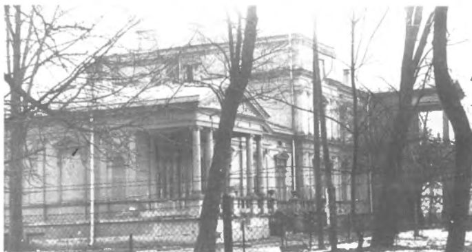
Urzejowice – dwór