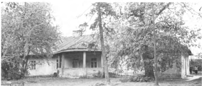
Brzyska Wola – dawna leśniczówka

Budynek wzniesiony w latach 1837-1839, parterowy, drewniano-murowany, otynkowany, założony na rzucie czworoboku, położony w parku o pow. 1,84 ha. Drzewostan parku złożony jest głównie z