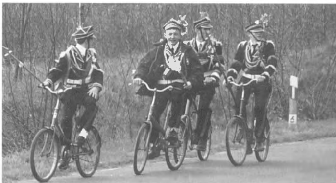
„Turki” z Jelnej k. Leżajaska w obiektywie Janusza Witowicza (z wystawy w Muzeum Etnograficznym)