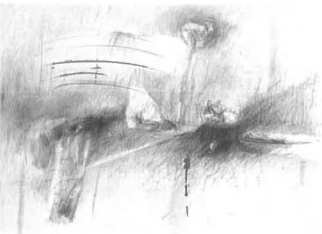
M. Makiel-Hędrzak, „Vanitas II”, z wystawy w Muzeum Okręgowym w Krośnie