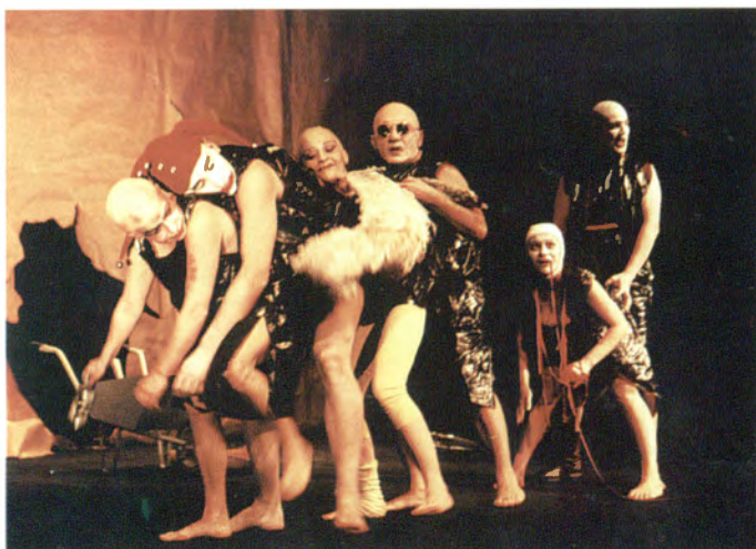
„Déballage” J. Szajny w Teatrze im. W. Siemaszkowej