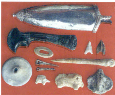
Skarby z grodziska w Trzcinicy; z wystawy w Muz. Okręgowym w Krośnie

pracy. Odkryto tam ogromne ilości zabytków, z czego najbardziej sensacyjnie to skarby przedmiotów wykonanych ze szlachetnych kruszców, brązu i żelaza. Wiele eksponatów prezentujemy po raz pierwszy szerszej publiczności.