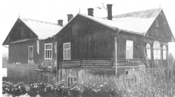
Niebylec – dwór

Dwór wzniesiony prawdopodobnie w I połowie XVI wie-