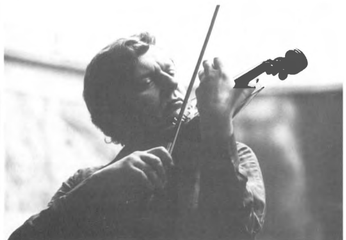
Sławny skrzypek Konstanty Andrzej Kulka wystąpi w rzeszowskiej filharmonii 12 marca

Wielki koncert jednego z najwybit- niejszych kompozytorów współ- czesnych – Witolda LUTO- SŁAWSKIEGO . Orkiestra Fil- harmonii Rzeszowskiej pod batu- tą szefa artystycznego filharmoni- ków katowickich Mirosława Jac- ka BŁASZCZYKA wykona naj- piękniejsze, najpopularniejsze w świecie utwory Lutosławskiego: Livre pour orchestre , Koncert wielonaczelowy , w którym solistą będzie wirtuoz tego instrumentu, koncertujący z wielkim powodze- niem w całej Europie – Andrzej