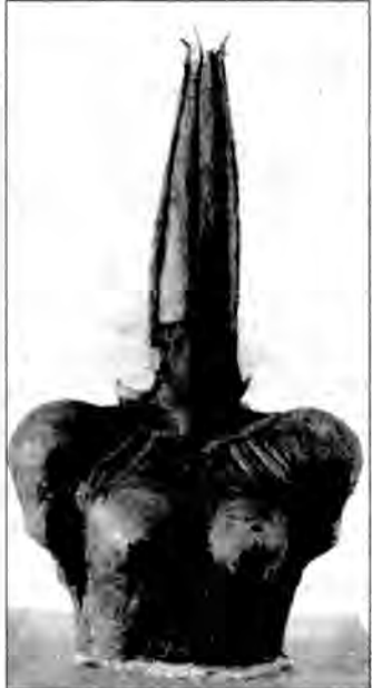
Grzegorz Tomkowicz „Gliniana bogini”, ceramika, wys. 86 cm, rok 1996

Staram się tworzyć – i to jest mój głos sprzeciwu – wobec przemijania, niemożności powrotu i śmierci. To mój krzyk i szept, aby coś przetrwało moje istnienie.