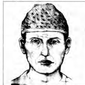
Portret pamięciowy jednego z przestępców

MIELEC. Policja mielecka, w oparciu o zeznania świadków, sporządziła portret pamięciowy jednego z uczestników napadu na sklep jubilerski.