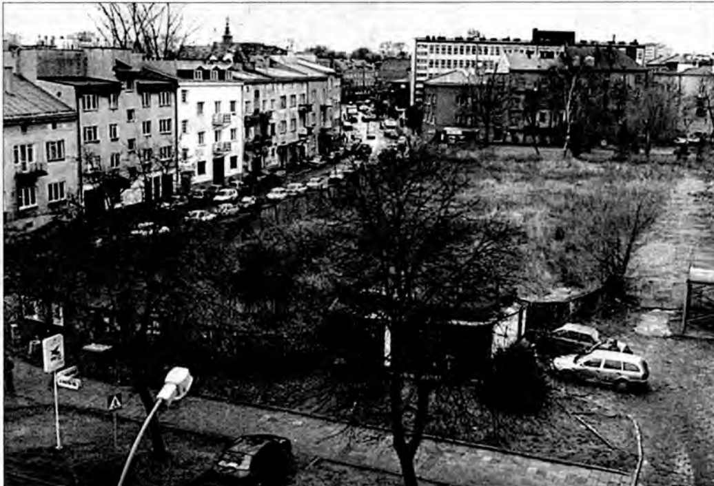
W tym miejscu ma powstać nowoczesne centrum medyczne.