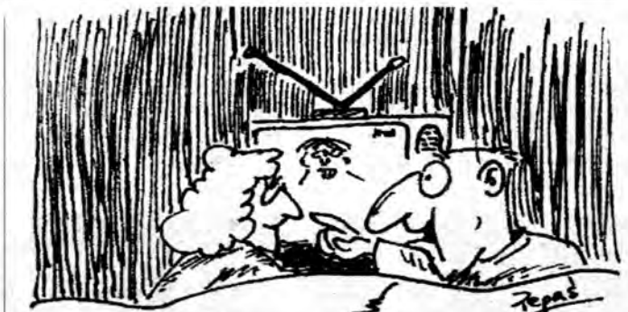
CIEKAWE JAKIE REKLAMY W ŚWIĘTA PUSZCZĄ

(O popularnych imionach czytaj na str. 6)