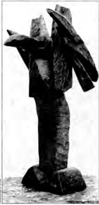
Bogdan Biernat „Uskrzydłony” – rzeźba w drewnie patynowanym (wys. 38 cm), 1997 r.

(np. „Uczony w piśmie”), postaci odgrywające role z nienapisanej sztuki, takie jak „Kolombina”, „Rycerz” czy „Luzak”. Biernat tworzy również swoje bestiarium: na wpół groteskowe, na wpół groźne. To ogromna kolorowa „Mucha” zawieszona nad salą wystawową, drewniany ptak „Myśliwiec” z długim dziobem i ostrym grzebieniem, groźny „Krab” lub nadrealistyczny „Taniec chomika” – stworza poruszającego się na kółkach. Niezwykle oszczędne w wyrazie, pełne dramatyzmu są kompozycje religijne, takie jak „Pieta” oraz „Opłakiwanie”.