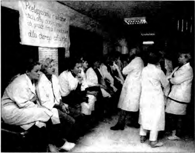
Za co zrobić święta? – zastanawiają się pielęgniarki ze Szpitala Miejskiego w Rzeszowie.

Czy pieniądź ma zastąpić miłość do bliźniego?