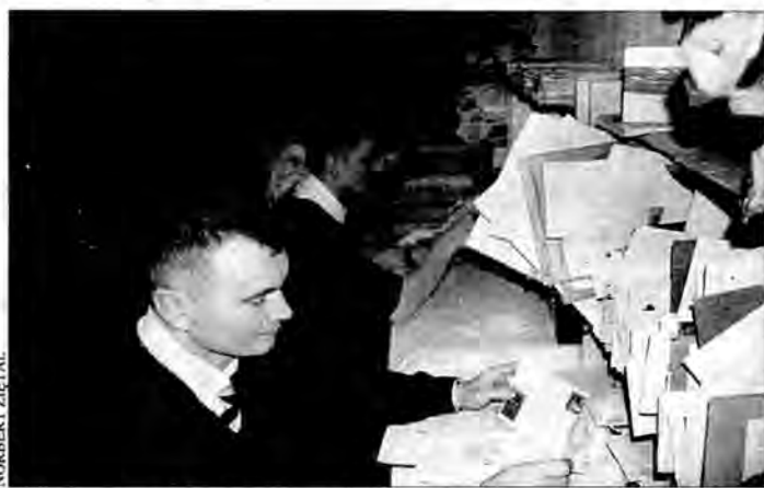
Pocztowcy dwoją się i troją, aby poradzić sobie z lawiną listów i kartek.

Wzmożony ruch zauważalny jest już na początku grudnia. Najgorętszy jest jednak ostatni, przedświąteczny tydzień. W związku z tym, w przemyskich urzędach pocztowych uruchomione zostały dodatkowe okienka, osobne stoiska tylko z kartkami i znaczkami oraz wzmocniona obsada służb rozdzielczych. W Przemysłu sortowanie przesyłek odbywa się ręcznie. Najbardziej przedświąteczny ruch daje się we znaki listonoszom, którzy wykonują więcej niż zazwyczaj „chodów doręczeń”. – Nie dopuszczamy do opóźnień.