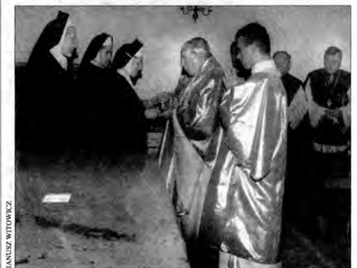
Ksiądz biskup Kazimierz Górny, ordynariusz diecezji rzeszowskiej, konsekrował w sobotę ołtarz i kościół pod wezwaniem św. Michała Archanioła w Rzeszowie. W uroczystej mszy świętej licznie uczestniczyli mieszkańcy osiedla Mieszka I oraz zaproszeni goście.

Od nowego roku może zmienić się też wysokość podatku od środków transportu. Właściciele ciężarówek o ładowności od 2 do 4 t zapłacą 582 zł rocznie. Podatek od ciągników siodłowych i balastowych to 1782 zł. Średnio o 10 proc. mają wzrosnąć opłaty targowe. Więcej możemy zapłacić za posiadanie psa – 35 zł. (Emeryci i renciści – 27 zł.) Wzrosną też opłaty za parkowanie w mieście. Za godzinę postoju zapłacimy 1,50 zł. Pół godziny na miejskim parkingu kosztować nas będzie 70 gr. iwa