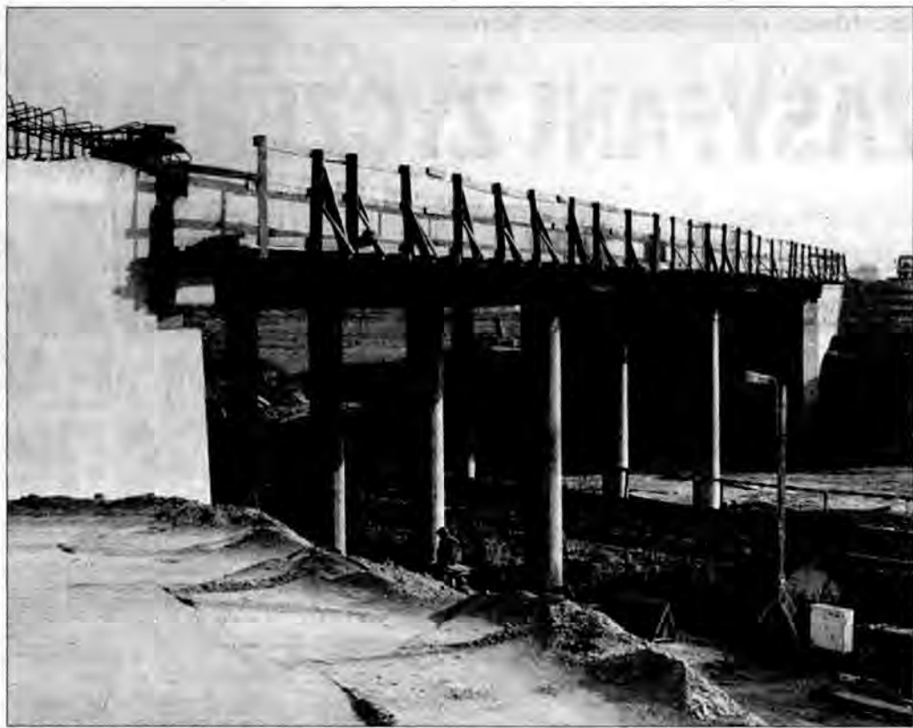
Obwodnica będzie przebiegać przez trzy wiadukty.