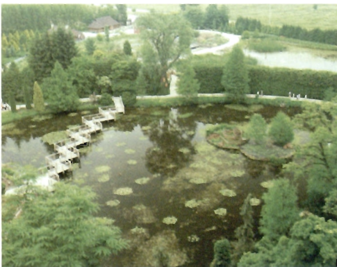
Arboretum – widok na staw średni i nowy