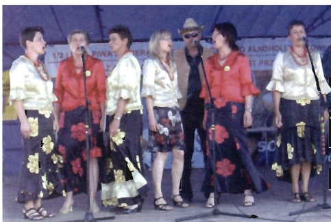
Zespół Biesiadny „Jagiellanie” z Jagielly – laureat I nagrody