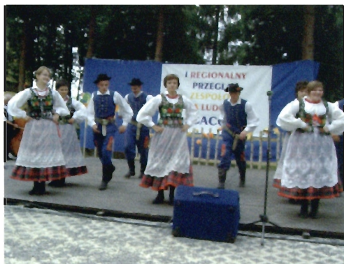
Zespół Pieśni i Tańca „Gacoki” z Gaci