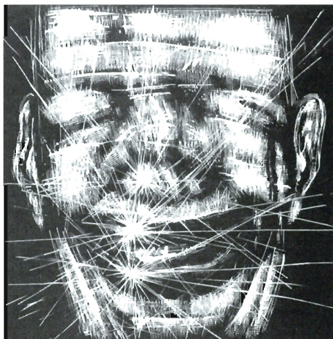
Andrzej Zalecki, „Uśmiech”, 2004, linoryt, 90×90 cm

WYSTAWY/AKCJE • KRESOWY DOM SZTUKI W DUBIECKU