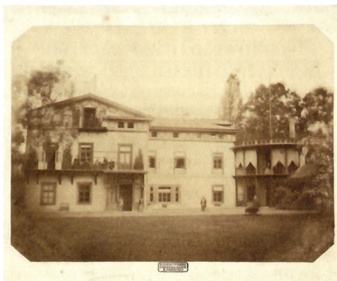
Pałac w Przeworsku, fotografia ze zbiorów Muzeum, 2. poł. XIX w.

Pałac został wybudowany w latach 1799-1807 z inicjatywy marszałkowej Izabeli Lubomirskiej, pani na Łańcucie. Przy jego budowie pracowali: Christian Piotr Aigner – architekt i Fryderyk Bauman – sztukator. Pierwszym właścicielem pałacu był Henryk Lubomirski – Kurator Li-