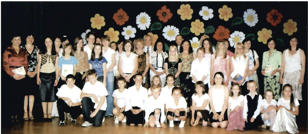
Laureaci konkursu „Moja Rodzina”