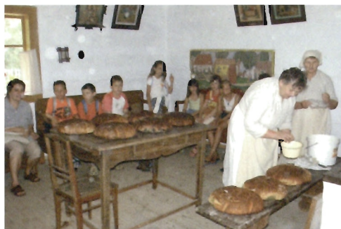
Lekcja muzealna nt. „Kipi ciasto w dzieży”