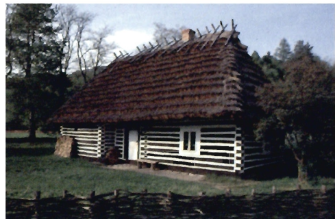
Chalupa z Ustrobniej