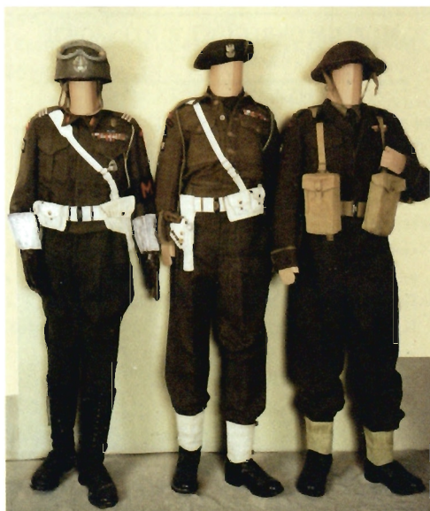
Fragn. wystawy „Czyn zbrojny żołnierza polskiego 1914–1945”