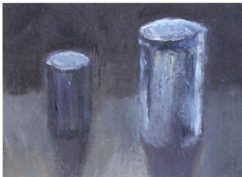
Tomasz Barszcz, „Puszki” – III nagroda w XXII Ogólnopolskiej Wystawie Twórczości Pedagogów Plastyki, WDK 2006