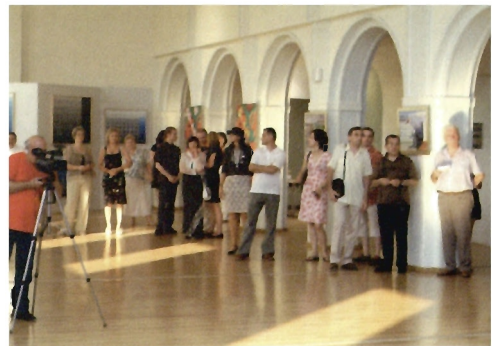
Z wernisazu wystawy