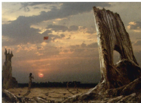
Valery Yakimchuk – jedna z prac nagrodzonych Złotym Medalem w IX Konkursie „Foto Odlot” w 2006 roku