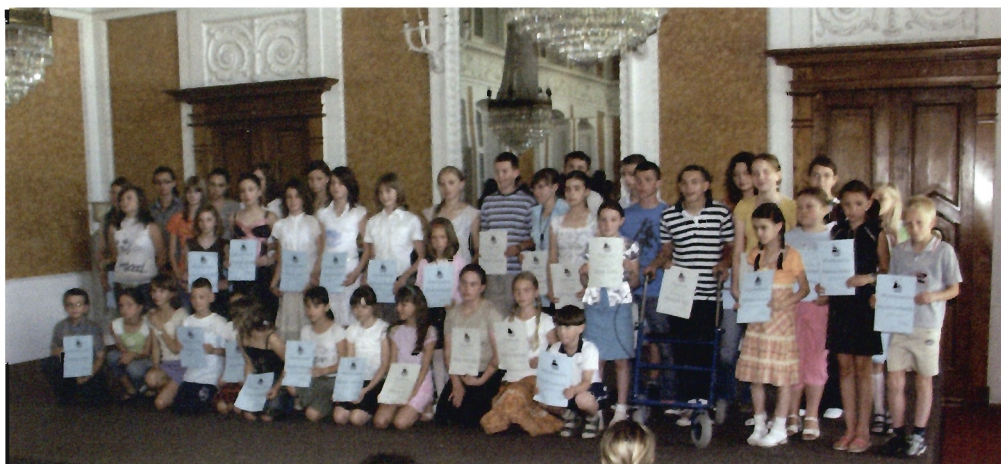
Laureaci konkursu „Na łańcuckim Zamku” w 2007 roku