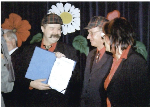
Nagrodzona Kapela „Ja Toj” z Przemyśla