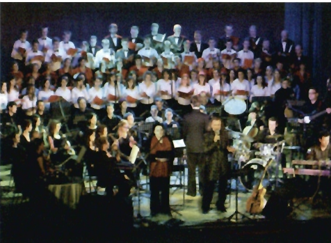
Niemen – Wspomnienie