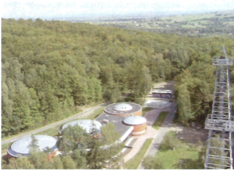
Muzeum w Bóbrce – Główny Pawilon z lotu ptaka

6 zł i 3 zł (ulgowy) przewodnik – 20 zł (do 30 osób), 30 zł (pow. 30 osób) pokaz filmu – 2 zł od osoby (maksymalna grupa 40 osób) Muzeum jest przystosowane do zwiedzania przez osoby niepełnosprawne.