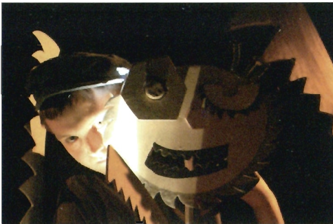
„Bajka dla bardzo niegrzecznych dzieci”