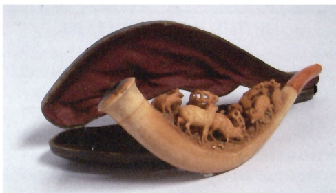
Cygarniczka z sepiolitu zdobiona dekoracją przedstawiającą grupę saren wśród drzew, w etui; Niemcy, koniec XIX w.