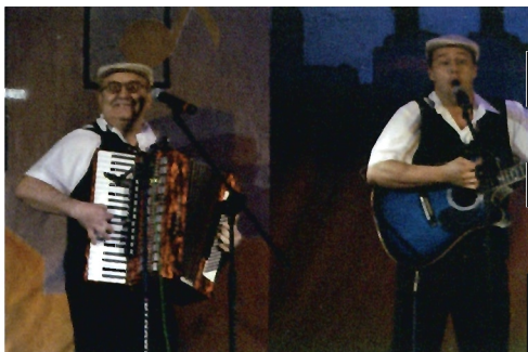
Kapela „Śląskie Bajery” z Ornontowic – laureat I nagrody

Pierwszą nagrodę, ufundowaną przez Ministra Kultury i Dziedzictwa Narodowego, otrzymała Kapela „Śląskie Bajery” z Ornontowic. Drugą nagrodę, której fundatorem był Marszałek Województwa Podkarpackiego, przyznał Przeworskiej Kapeli Podwórkowej „Beka”. Zdobywcą trzeciej nagrody, ufundowanej przez Prezydenta Miasta Przemyśla, została Kapela Podwórkowa „Eka” z Gostynia. Przyznano także cztery równorzędne wyróżnienia, które