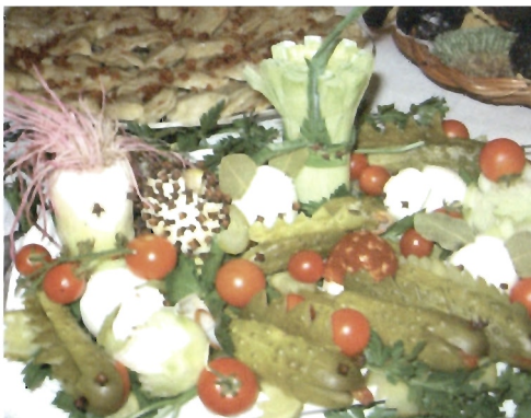
Biesiada nad Wyczwawą – nagrodzone w 2006 roku stoisko KGW z Ujeznej