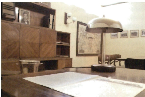
Fragment nowej ekspozycji stałej „Narodziny Stalowej Woli 1938” w pomieszczeniach hotelu „Hutnik” przy ul. Prymasa Wyszyńskiego 12 fot. arch. Muzeum