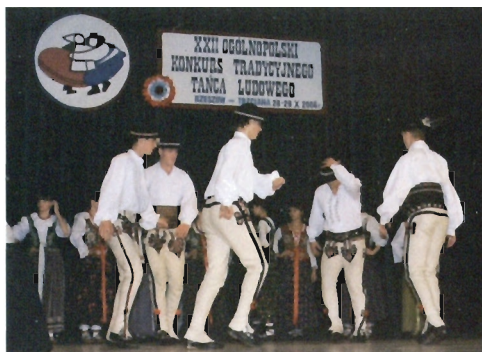
Zespół „Ślebodni Groni” z Leśnicy – nagroda główna w XXII OKTTL