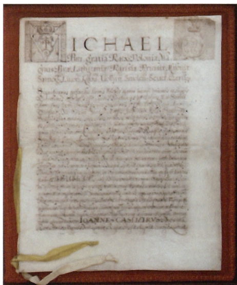
Dokument króla Michała Korybuta Wiśniowieckiego, 1670 (po konserwacji)