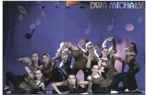
Zespół „Mikado” z Albigowej – laureat I nagrody w konkursie „Tańcowaly dwa Michały”