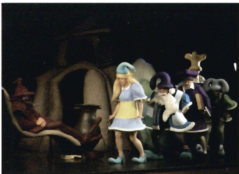
„W Błękitnej Krainie Elfoludków”

Spektakl opowiada o przygodach niebieskich ludków i ich zmaganiach z największym wrogiem – Gargułą. Dzieci mają możliwość spotkania z mieszkańcami Błękitnej Krainy, których jedni nazywają elfami, inni smurfami, skrzatami lub krasnoludkami. Milusińscy doradzają bohaterom w trudnych kwestiach, a niekiedy ratują im życie, ostrzegając przed zbliżającym się niebezpieczeństwem.