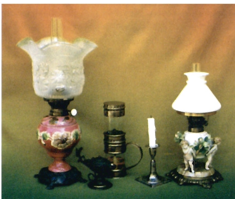
Lampy naftowe – chluba Muzeum