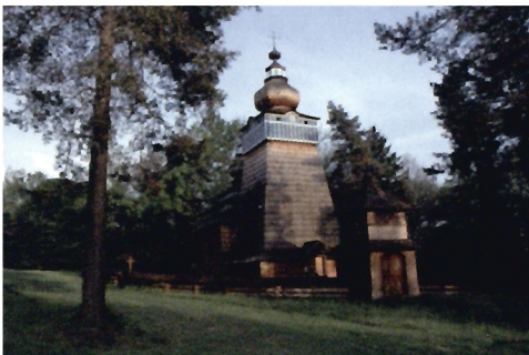
Cerkiew z Ropok

Istnieje możliwość zorganizowania ogniska dla dzieci i młodzieży. Koszt ogniska wynosi 50 zł (prawiant we własnym zakresie).