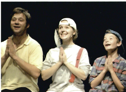
„Co może biedny Anioł Stróż?”

reż. Cezary Domagała • scenogr. Marika Wojciechowska • muz. Cezary Borowski • chor. Marta Domagała