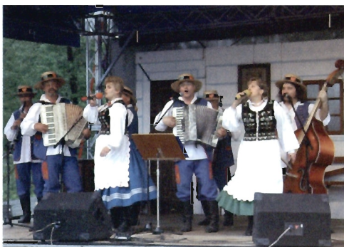
Prezentacje Twórczości Ludowej

Na terenie skansenu, w naturalnym otoczeniu dawnej wsi polskiej, swoją pracę zaprezentowali m.in.: garncarz, kowal, plecionkarz, powroźnik, malarze i rzeźbiarze. W chałupach gospodynie wiejskie pokazały pieczenie chleba „na trzonie”, ubijanie masła w maślnicy oraz przygotowały wiele tradycyjnych potraw. Na scenie można było zobaczyć dawne obrzędy i zwyczaje takie jak „Zamawianie siekiernicy”, „Wieczór taneczny w Budziwoju”, „Wesele w Giedlarowej” oraz występy kapel ludowych. Dużą atrak-