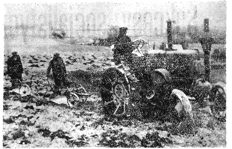
Przed wojną na polach Polski „B“ widziało tylko konie, a nie rzadko chłopów, którzy w braku zwierzęcej siły pociągowej, sami wprzęgali się do plugów.

Obecnie „oddział niemiecki“ rozbudowuje swoją szpiegowską sieć w Berlinie.