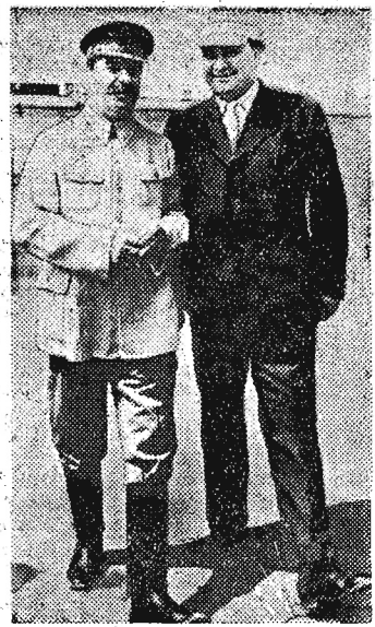
Józef Stalin i Georgi Dymitrow

W okresie Wielkiej Wojny Narodowej nowoudziński kolchoz im. Stalina przekazał na fundusz obrony narodowej tysiące cetnarów zboża i innych produktów rolnych, dał armii wiele koni. Ponad 150 mieszkańców wsi brało udział w walkach na froncie.