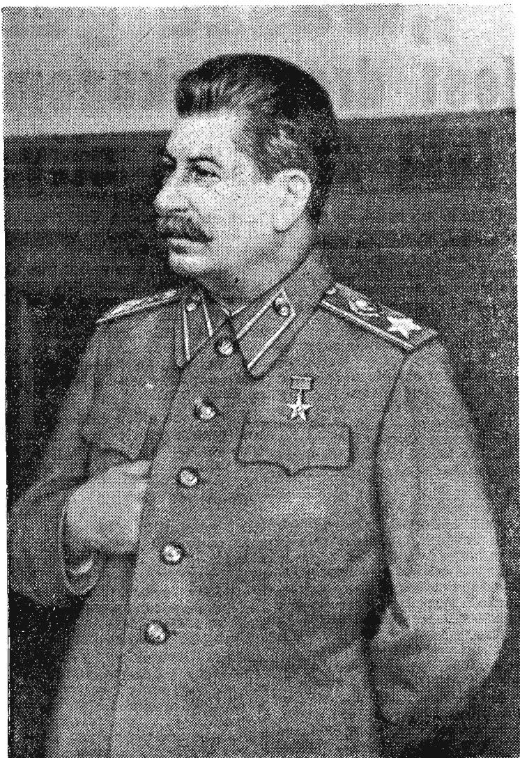
JOZEF STALIN Wódz światowego obozu pokoju i postępu

Str. 7-ma Sprawozdanie z Wielkiej Akademii Stalinowskiej w Rzeszowie