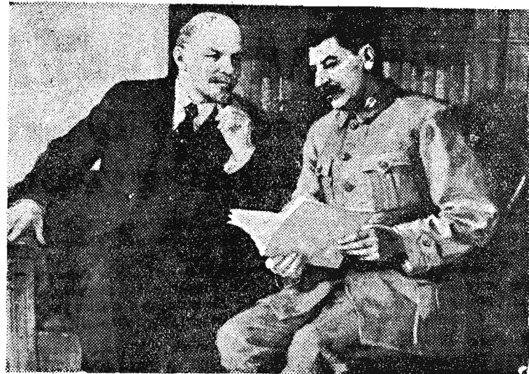
Włodzimierz Lenin i Józef Stalin (wg. obrazu P. Wasiljewa).

Rok II. Rzeszów — Przemyśl — Kresno, 20 stycznia 1950 Nr 20 (126)