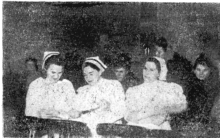
Absolwentki kursu dla mężów zaufania i radców zakładowych z zadowoleniem oglądają otrzymane świadectwa.

Stacja Przetaczania i Konserwowania Krwi w Rzeszowie przyjmuje zgłoszenia krwiodawców. Jednorazowe pobranie 300 cm sześć. krwi za wynagrodzeniem 7.500 zł. może uratować życie ludzkie, bez uszczerbku dla Twego organizmu. Ubytek krwi wyrównasz do kilku dni. Zgłoszenia przyjmuje Stacja Przetaczania i Konserwowania Krwi Rzeszów, ul. Kreczmera 4a obok starego szpitala codziennie z wyjątkiem niedziel i świąt od godz. 8 do 15.