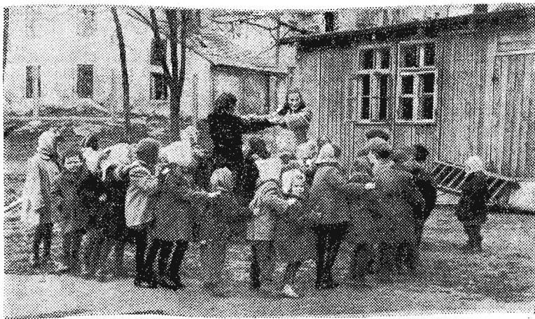
W Rzeszowie, oprócz przedszkola TPD, dzieci świata pracy korzystają również z ogródka jordanowskiego. W ciepły, wiosenny dzień zabawa na wolnym powietrzu, zorganizowana przez kwalifikowane wychowawczynie, należy do prawdziwych dziecięcych przyjemności.