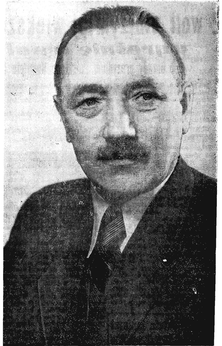
W DNIU DZISIEJSZYM PRZEWODNICZĄCY KC PZPR TOWARZYSZ BOLESŁAW BIERUT OBCHODZI 58 ROCZNICE SWYCH URODZIN.

Związek Bojowników o Wolność i Pokój XV dzielnicy Paryża wezwał do współzawodnictwa bratnią organizację XIV dzielnicy Paryża co do ilości zebranych podpisów.