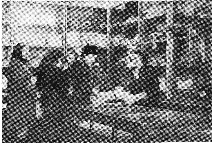
Nowy, pięknie urządzony i bogato wyposażony sklep odzieżowy CHPO w Rzeszowie, przy ul. 3 Maja, jest prawdziwą ozdobą miasta. Sklep ten zaopatrzony w różnorodne ubrania męskie, damskie i dziecięce, bieliznę, kapelusze itp. cieszy się wielkim powodzeniem zarówno wśród mieszkańców Rzeszowa jak i wśród chłopów z okolicznych wsi.