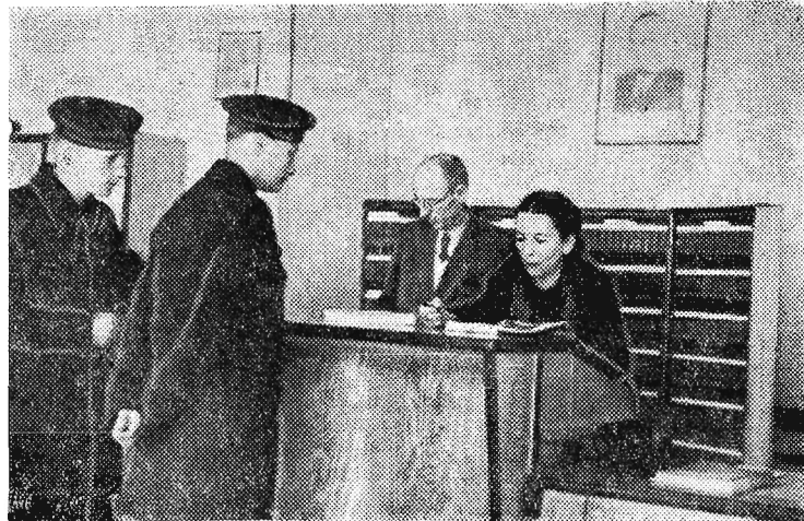
Płacówka „Orbisu“ od dawna była życzeniem rzeszowskiego świata pracy. Zorganizowany w pierwszych dniach bm. w Rzeszowie przy ul. 3 Maja oddział „Orbisu“ jest znacznym udogodnieniem dla pracujących, odcinając przy tym kasy biletowe na stacji kolejowej. Ci marynarze, których widzimy na zdjęciu — przyjechali do swych rodzin na święta, kupując właśnie bilety kolejowe z powrotem do Gdyni.